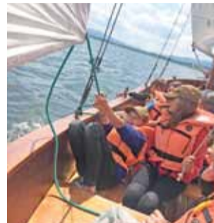
Dla wielu łowickich harcerzy i zuchów rejs po Jeziorze Żywieckim był pierwszą w życiu przygodą z żeglarstwem.

Szczególną atrakcją, ale tylko dla najaktywniejszych i najsumienniejszych wywiązujących się z obowiązków w czasie obozu, była możliwość odbycia około 15-minutowego lotu moto-paralotnią – nagroda mogła przypaść tylko jednemu namiotowi. Skorzystała