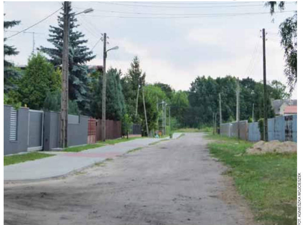
Wiele wskazuje na to, że mieszkańcy ul. Czarnieckiego będą mogli cieszyć się nową nawierzchnią już jesienią.

Przypomnijmy, że w marcu br. prowadzono we wspomnianym miejscu prace nad budową chodnika po jednej stronie drogi wraz ze zjazdami do poszczególnych posesji oraz wykonaniem sieci kanalizacji deszczowej. W planach na dalszą modernizację jest wykonanie nawierzchni brukowej na całej długości ulicy, a także brakującej części chodnika. Prace ruszą kilka dni po podpisaniu umowy z realizatorem inwestycji, do którego dojdzie pod