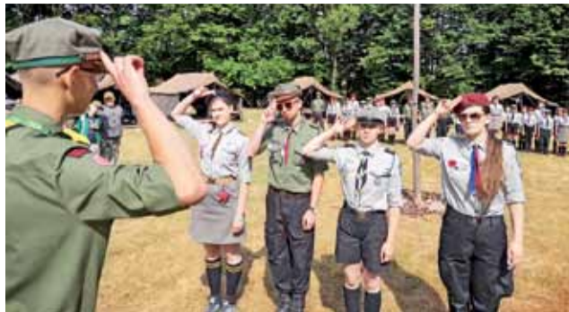
Musztra harcerska w obozie w Wapienicy.

Harcerstwo | Obóz łowickiego hufca w Wapienicy