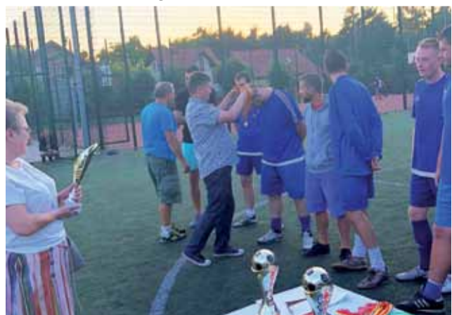
Burmistrz Główna wręcza zwycięzcom medale. Dyrektor SP nr 3 w Głównie wkrótce przekaże Puchar.

Piłkarze amatorzy rywalizację rozpoczęli 17 czerwca i przez kolejne 45 spotkań walczyli o ligowe punkty. Tradycyjnie już poziom rozgrywek był wysoki, a podczas finałowego dnia imprezy, 18 lipca zmaganiom osobiście przyglądali się Burmistrz Główna Grze-