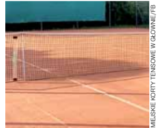
Korty przy ul. Kopernika w Głownie czekają na miłośników tenisa.

Zawodnicy, którzy utrzymają się w grupie Masters z początkiem września wezmą udział w Turnieju Mastersów, który wyłoni