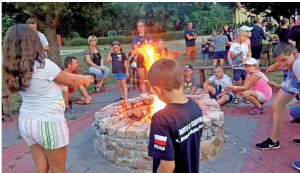
Ognisko z kiełbaskami jest istotnym punktem cyklicznych spotkań integracyjnych młodzieży.

Liczy ona ok. 22 kilometrów – rozpoczynając od mostu w miejscowości Kołacinek. Zbiórka przy Zatoce ZHP w Głownie (godz. 8.30) lub na miejscu. Start o godzinie 9.00. str. 7