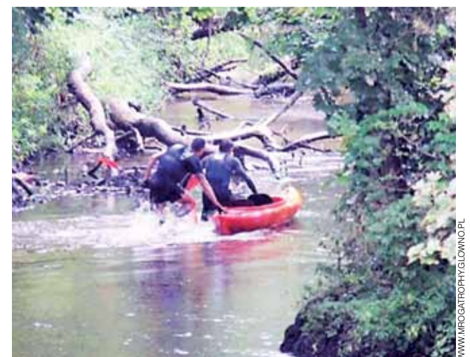
Uczestnicy splywu przed kolejną przeszkodą na rzece Mroga.

O udziale w splywie decyduje kolejność zgłoszeń. Dla wszystkich uczestników organizatorzy przewidzieli medale pamiątkowe, wodę i przekąskę oraz puchary dla trzech najszybszych załóg. Podsumowanie splywu i wręczenie nagród odbędzie się w trakcie Rodzinnego Pikniku na terenie rekreacyjnym nad Zalewem Mrożycka w Głownie. wp