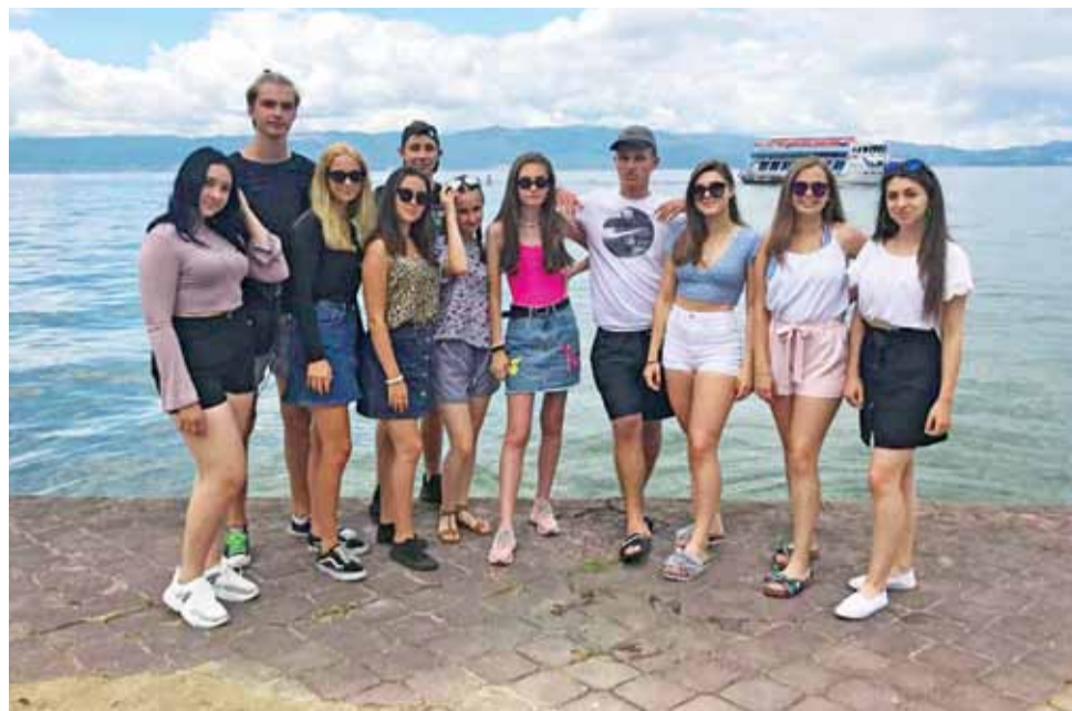
Członkowie Dziecięco-Młodzieżowego Zespołu Ludowego „Koderki” wypoczywali w malowniczej Macedonii.