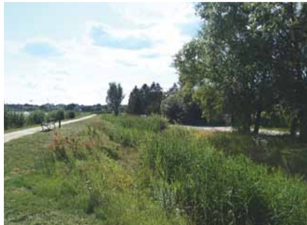
Rów obok deptaka przy zalewie porasta bujną roślinnością.