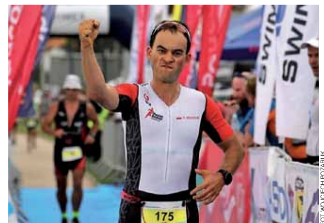
Zawodnicy Triathlonu w Strykowie mogą liczyć na wsparcie kibiców.

Zapisywać się można poprzez stronę www.zapisy.inessport.pl lub www.triathlonstrykow.pl , gdzie znajduje się także szczegółowy regulamin imprezy oraz mapki tras i wskazówki dotyczące treningów od profesjonalnego trenera Krzysztofa Wolskiego , znakomitego zawodnika i jednego z ambasadorów Triathlonu Stryków. wp