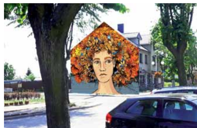
Wizualizacja wielkoformatowego muralu „Drzewo Życia”, jaki być może powstanie przy Pl. Wolności w Głownie.

Niewykluczone również, że w nieodległej przyszłości – być może także ze zbiórki publicz-