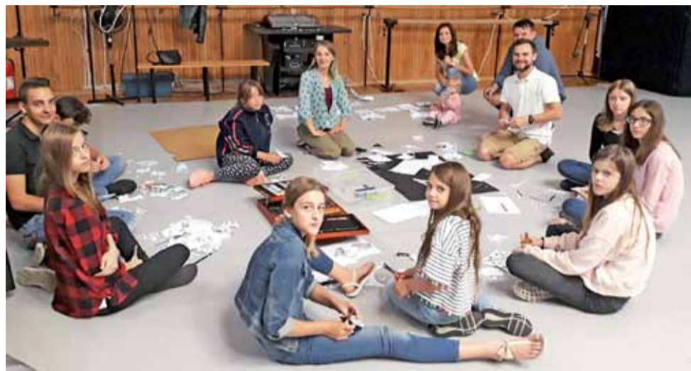
Warsztaty poświęcone tworzeniu szablonów inspirowanych ornamentami roślinnymi były okazją, by porozmawiać o charakterze muralu.

– Kolejne prace będą wykonywane przy wsparciu ze strony wo-