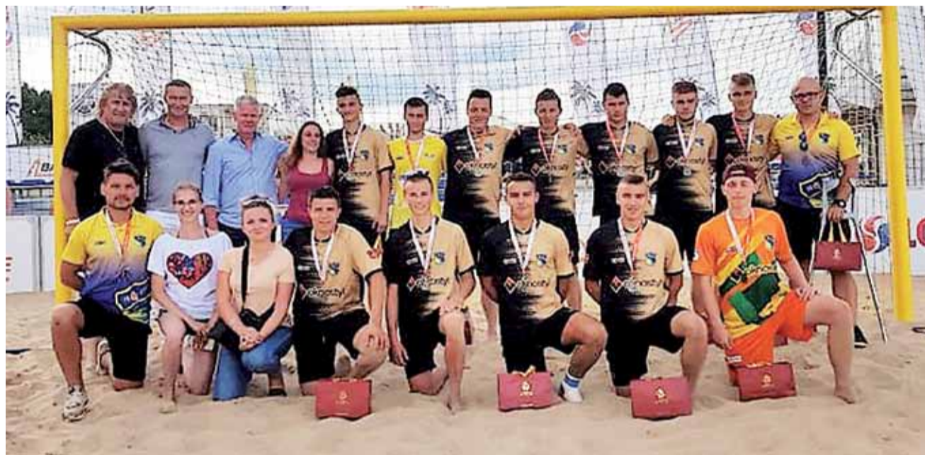
Drużyna BSC Pro-Fart SAN AZS Główno osiągnęła świetny wynik podczas Pucharu Polski do lat 21.

W walce o strefę medalową drużyna pod wodzą trenera Bartłomieja Krysiaka zmierzyła się z UKS Milenium Gliwice i tutaj bez większych problemów wygrała 6:3, meldując się tym samym w półfinałach. Spotkanie w 1/2 znów dostarczyło kibicom mnóstwa emocji i od początku BSC Grembach Łódź narzucił trudne warunki, prowadząc 1:0, 2:1 i 3:2. Końcówka należała jednak do głównian, którzy wygrali ostatecznie 5:4 i awansowali do wielkiego Finału. W wal-