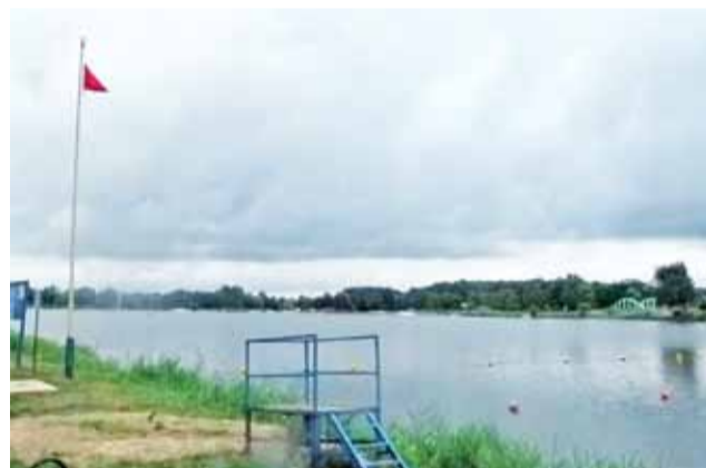
Czerwona flaga powiewa nad zalewem „Mroźyczka” od pierwszych dni lipca.

– Wszystko uzależnione będzie od decyzji sanepidu oraz wyników przeprowadzonych ba-