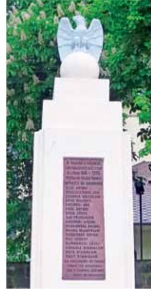
Orzeł na domaniewickim pomniku wciąż pozostaje pozbawiony korony.