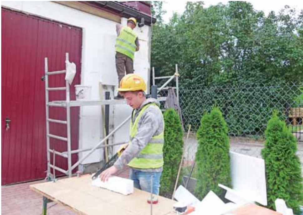
Prace przy ocieplaniu elewacji budynku OSP Koźle.

Tutaj w zakres robót weszło: ocieplenie ścian zewnętrznych, cokołu, stropu oraz podłóg, montaż obróbek blacharskich, wymiana oświetlenia na ledowe, wymiana stolarki drzwiowej i okiennej. Inwestycja objęła również zało-