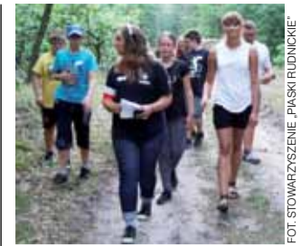
W podchodach brali udział zarówno młodzi, jak i starsi uczestnicy.

Dodajmy, że mieszkańcy naszego miasta mogą zgłaszać dyrektorowi MZK własne propozycje terenów, w których możliwie byłoby wprowadzenie systemu zachowania bioróżnorodności. W rozmowie z naszym reporterem podkreślił on bowiem, że chciałby, by rozważana idea powrotu miasta do natury wiązała się z inicjatywą obywatelską. aw