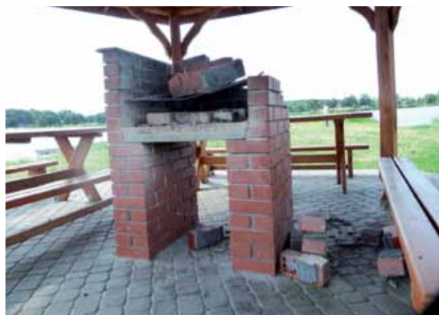
Widok uszkodzonego grilla wzbudzał oburzenie również wśród przechodniów.