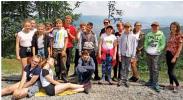
Odpoczynek podczas górskich wędrówek.