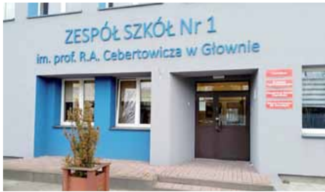
Zespół Szkół nr 1 w Głownie

Przypomnijmy, że sprawa trafiła do sądu po tym, jak Wojewoda Łódzki, Zbigniew Rau, zdekomunizował nazwę ZS nr 1 w Głownie, pozbawiając szkołę imienia patrona zarządzeniem zastępczym, wydanym 20 marca br., które zaskarżył powiat. O wspomnianym zarządzeniu, w którego uzasadnieniu znalazła się wzmianka o aktywności politycznej profesora Cebertowicza w okresie PRL-u, w tym fakt bycia posłem na sejm w latach 1952-56, wielokrotnie