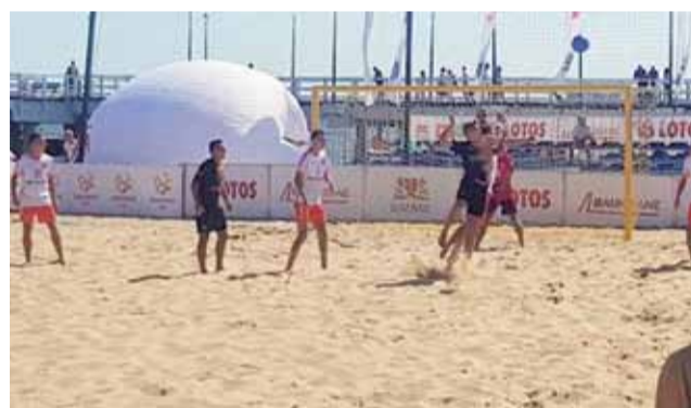
Spotkanie półfinałowe Pro-Fart – KP Łódź wygrali 6:3 głównianie.

Głównianie mieli trudną grupę, ale poradzili sobie świetnie i wygrywali mecz za meczem, aż do wielkiego finału.