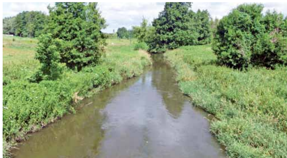
Mroga w Ziewanicach. Widok z mostu. To w tej miejscowości mieszkańcy dostrzegają problem z jakością wody w rzece, a źródeł zanieczyszczeń typują kilka.

W zakładzie tym, jak argumentują mieszkańcy Ziewanic, większość infrastruktury do oczyszczania ścieków pochodzi z okresu PRL-u i jest w złym stanie technicznym, a dawne zakłady (dziś to prywatna firma) diametralnie zwiększyły produkcję i zatrudnienie w stosunku do tamtego czasu, stworzyły też miejsce zakwaterowania dla pracowników, którzy wszak wytwarzają ścieki bytowe. Przeprowadzona modernizacja zakładu z wykorzystaniem środków unijnych, umożliwiająca zwiększenie produkcji, nie wiązała się jednak z żadną inwestycją w unowocześnienie starej infrastruktury służącej ochronie środowiska. W efekcie zakład posiada jedynie osadnik z mieszałkami do napowietrzania, które nieczęsto