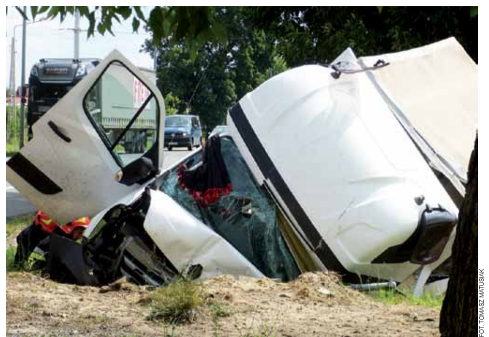
Finał wypadku był tragiczny, ponieważ samochód przewrócił się akurat tak, że zmiążdżone zostało miejsce kierowcy.

Już po kilkunastu minutach na miejscu zjawili się strażacy. Stwierdzili, że kierowca jest nieprzytomny. Ze względu na zakleszczenie wewnątrz kabiny nie byli w stanie sprawdzić jego czynności życiowych ani udzielić pierwszej pomocy, zanim nie