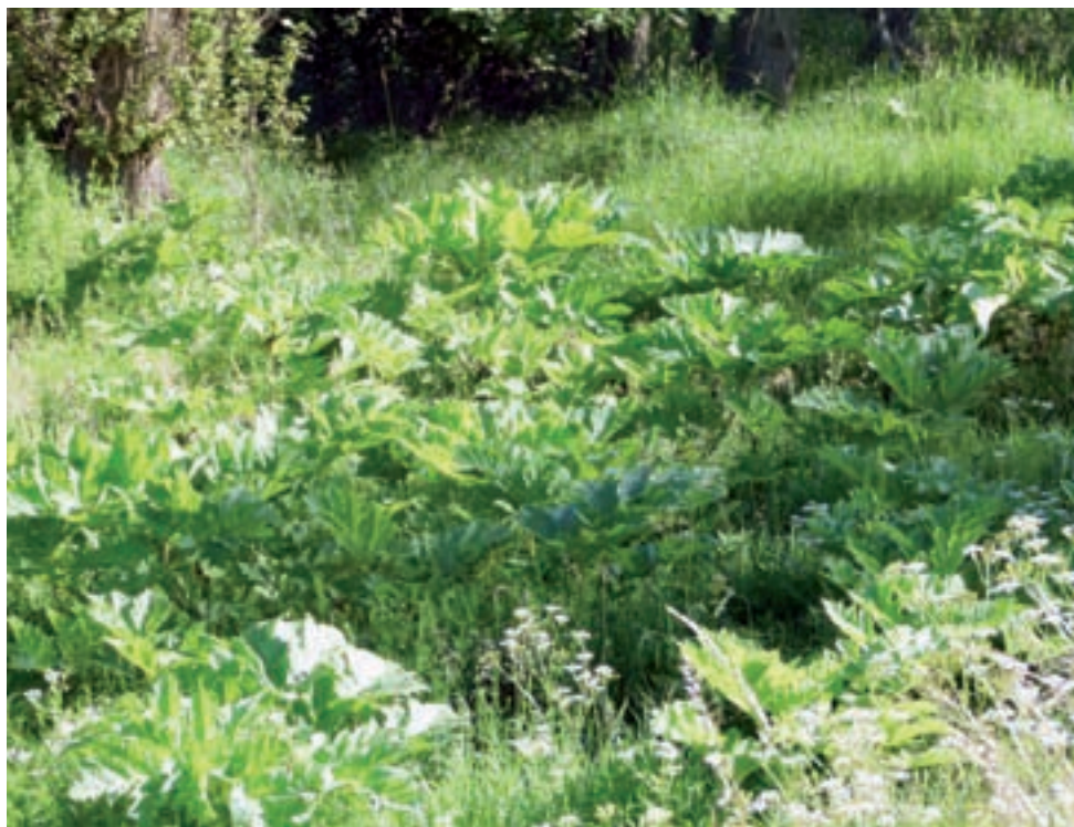
Charakterystyczne zielone liście sięją niepokój.

Rośliny nie udaje się jednak tak łatwo wyeliminować. Przetrwają zabiegi chemiczne, mimo iż zwiększano dawkę stężenia herbicydu.