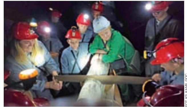
W kopalni soli w Wieliczce młodzież wzięła udział w zajęciach edukacyjnych „Młody górnik”.