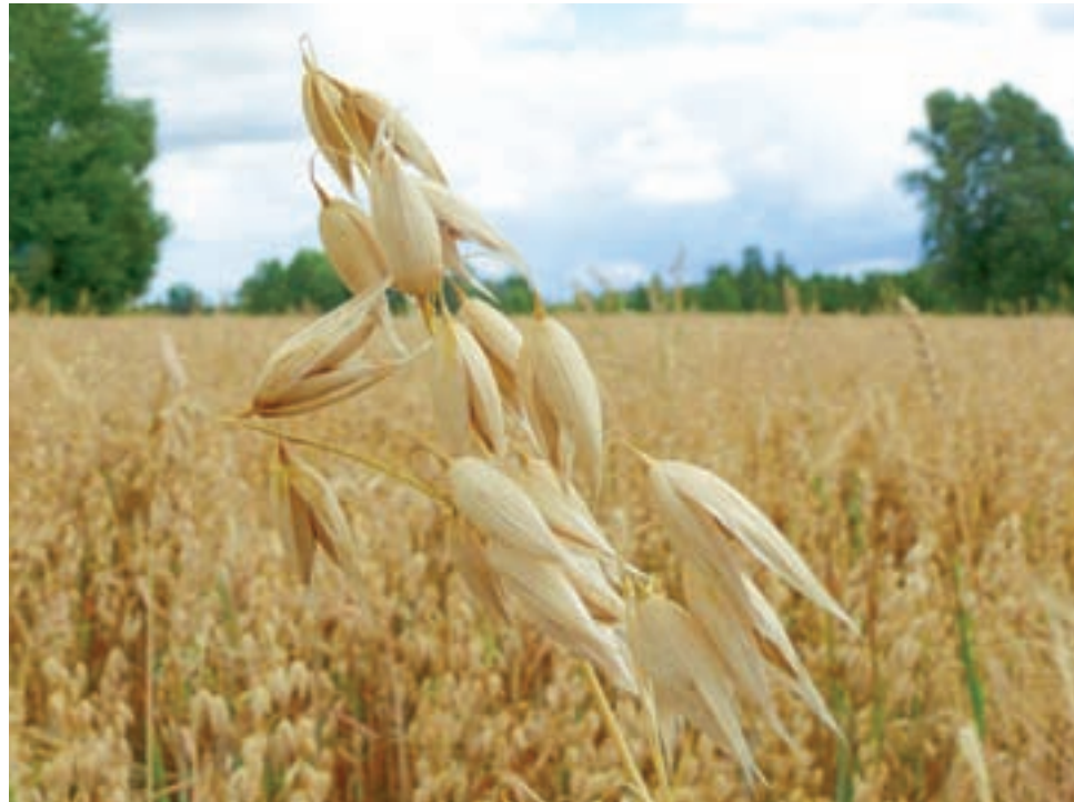
Na polach i łąkach jest bardzo sucho, zboża urosły, ale ziarna już niekoniecznie. Na zdjęciu owies.

Do rejonu, który w gminie ucierpiał najbardziej, można też zaliczyć Przemysłów oraz Karsznice Małe i Duże. Zdarza się, że po zweryfikowaniu przez komisję straty okazują się znacznie niższe niż w zgłoszonym wniosku, były nawet przypadki, że ze zgłoszonych 70% w rzeczywistości wynosiło 40%. Straty są większe niż