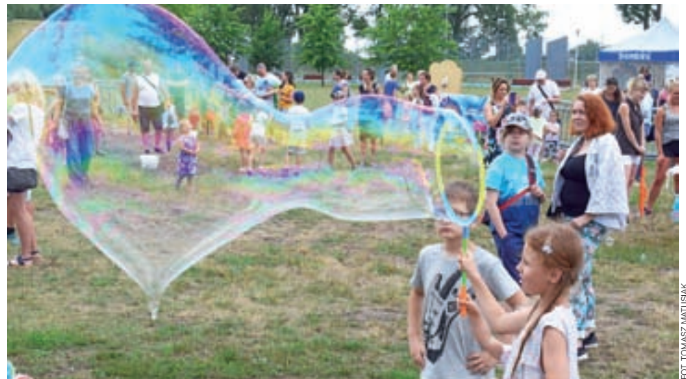
Na terenie imprezy można było wypożyczyć nieodpłatny sprzęt do robienia baniek.

To przede wszystkim zabawa dla najmłodszych dzieci, choć włączyli się w nią ludzie w różnym wieku, najczęściej całe rodziny. Wydarzenie nie miało szczęścia do pogody, bo sobotnie popołudnie 27 lipca stało pod znakiem zachmurzenia, przelotnych opadów, a w oddali nawet burzy (potem się okazało, że jednak ominęła ona Łowicz). Już na samym otwarciu Bubble Day gości przywitał deszcz. Z jednej strony to dobrze dla puszczania mydlanych baniek, bo najdłużej utrzymują się one w powietrzu właśnie wtedy, kiedy jest ono wilgotne,