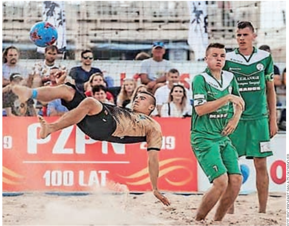
Piłkarze plażowi z Głowna (złoto-czarne stroje) osiągnęli duży sukces w Młodzieżowym Pucharze Polski. Teraz BSC Pro-Fart SAN AZS liczy na podobny wynik w Mistrzostwach Polski U-21.

Liderem Ekstraklasy Beach Soccera z kompletem punktów jest naszpikowany gwiazdami KP Łódź – finalista tegorocznej Ligi Mistrzów, zdobywca po raz szósty z rzędu Pucharu Polski oraz mурowany faworyt do zdobycia tytułu Mistrza Polski w plażowej piłce nożnej w tym roku. wp