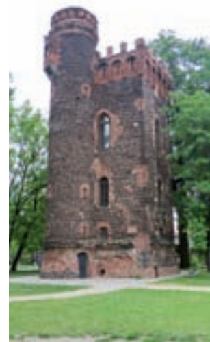
Baszta gen. S. Klickiego była w 2017 roku poddana pierwszym od lat pracom remontowym, wówczas za 144 tys. zł poprawiono stan jej elewacji.