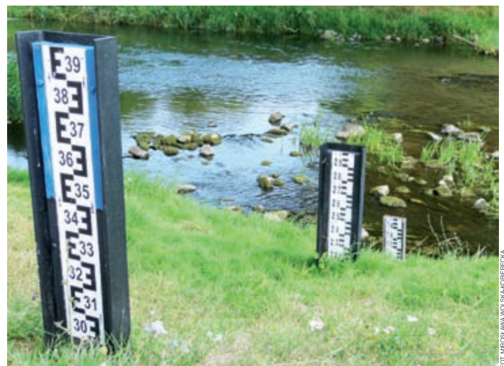
Poziom wody w Bzurze w Łowiczu nie jest jeszcze rekordowo niski, wynosi około 40 cm