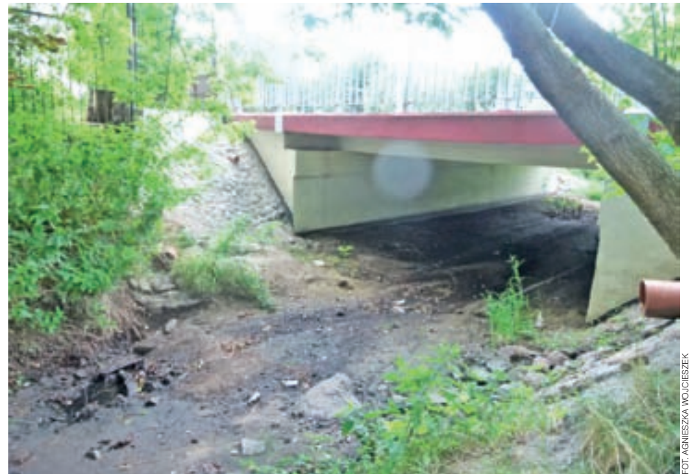
Suche koryta Brzuśni tuż przy moście na ul. Dworskiej.

Innym problemem, jaki zauważył dyrektor MZK w okolicy ul. Dworskiej, było zanieczyszczenie