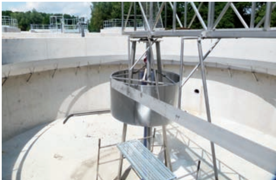
Osadnik wtórny. Stąd oczyszczone ścieki będą odprowadzane do rzeki, a osad z dna – do zagęszczacza i pod nową prasę.

Z sitopiaskownika płynne ścieki będą kierowane do okazałego nowoczesnego reaktora biologicznego, podzielonego na strefy tlenowe i beztlenowe, gdzie do eliminacji zanieczyszczeń zaprężnięte zostaną żywiące się nimi mikroorganizmy. Oczyszczone ścieki trafią do osadnika wtórnego, na dnie którego osiadzie wytrącony osad, a ciecz skierowana będzie do rzeki. Osad z dna będzie odpompowywany do zagęszczacza (pozostającego z dotychczasowej instalacji), a następnie będzie podawany na nową prasę i odwadniany. Po odwodnieniu i higienizacji