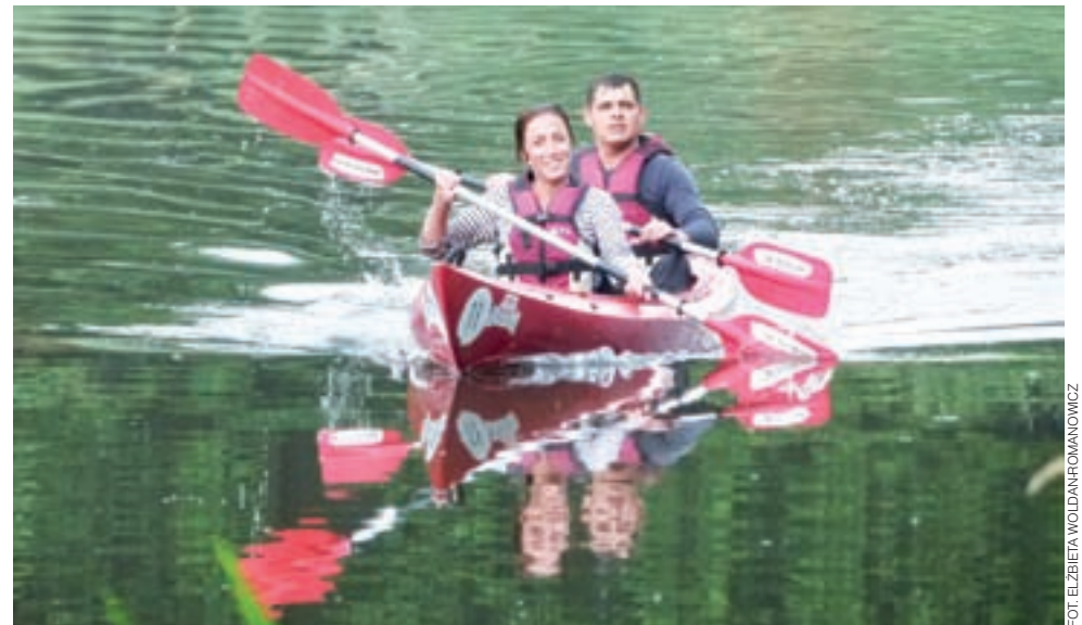
Zmęczeni, ale szczęśliwi. Para z Ukrainy podjęła się najtrudniejszego wyzwania i przepłynęła Trasę Diamentową.

Wśród uczestników tegorocznego ekstremalnego spływu były też osoby, które po poprzednim zarzekały się, że nigdy więcej do kajaka nie wsiądą, ale minął rok i chęć przeżycia przygody oraz zmierzania się z własnymi słabościami okazała się silniejsza.