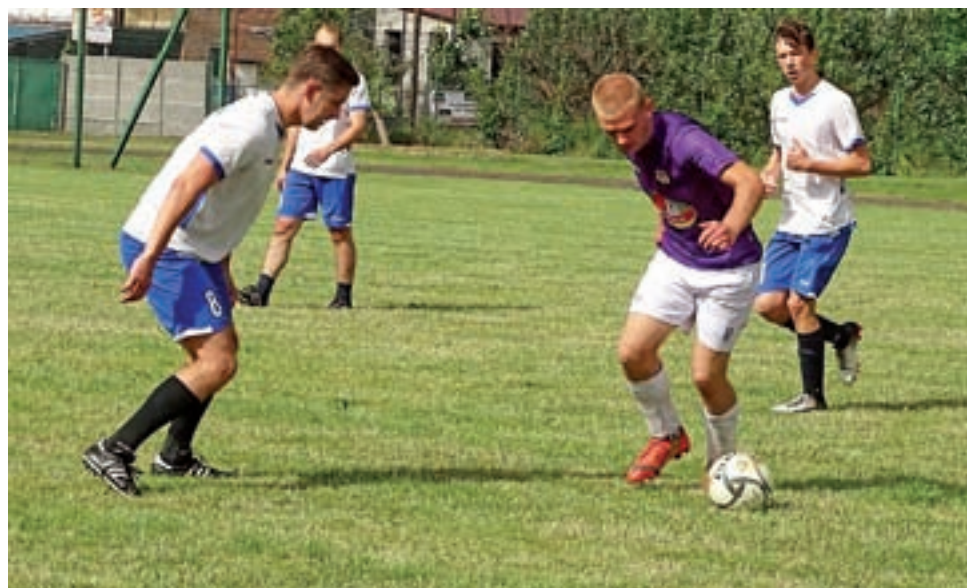
Piłkarze Huraganu Swędów (białe koszulki) mogą w krótkim odstępie czasu osiągnąć podwójny sukces. Po pierwsze awansować do kolejnej rundy Pucharu Polski i po drugie wywalczyć promocję do A-klasy.