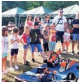
Strażacki Piknik Rodziny.

Jak co roku pogoda nie zawiodła. W upalne popołudnie największym zainteresowaniem cieszyła się piana gaśnicza imitująca śnieg oraz kurtyna wodna, pod którą można było się ochłodzić. Na placu rozłożono także dmu-