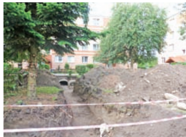
Wykop przy blokach na ul. Kościuszki mają zniknąć do połowy sierpnia.