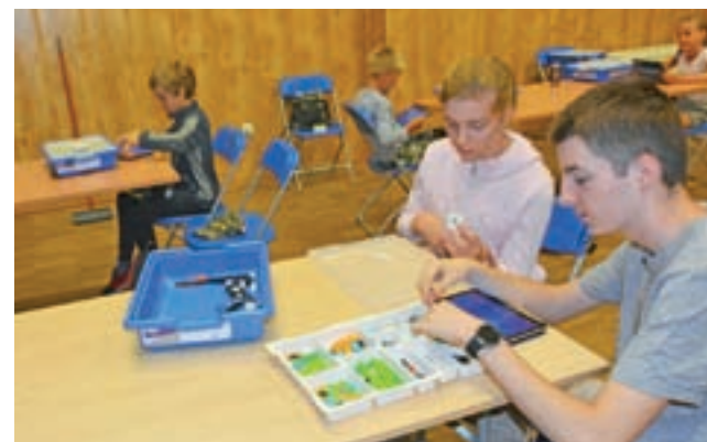
Wiele radości sprawiły dziesięć uczestników wakacyjne bezpłatne warsztaty z robotyki , zorganizowane 23 lipca w strykowski Domu Kultury w ramach projektu „Matma – lubię to!” przez Stowarzyszenie „I love math”, finansowanego przez Fundację mBanku. Uczestnicy budowali i programowali mini roboty z klocków LEGO, a następnie sterowali nimi za pomocą tabletów. oprac. ewr