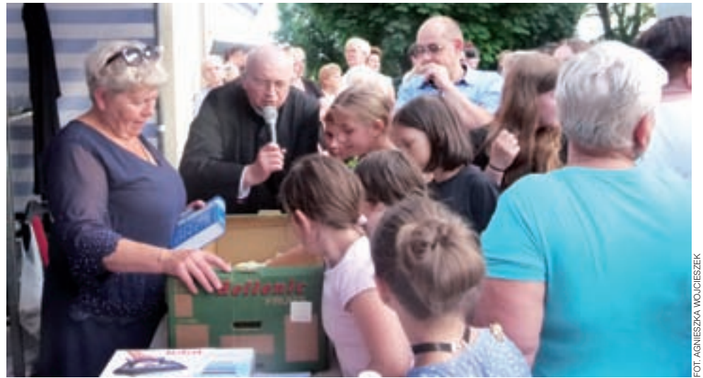
Zabawa z fantami cieszyła się dużym zainteresowaniem dzieci i dorosłych.

Tuż po wieczornej mszy św. na terenie przed kościołem odbyło się losowanie głównych nagród