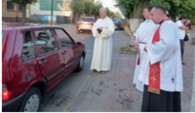
Tradycyjne święcenie pojazdów przy ul. Łowickiej w Głownie.