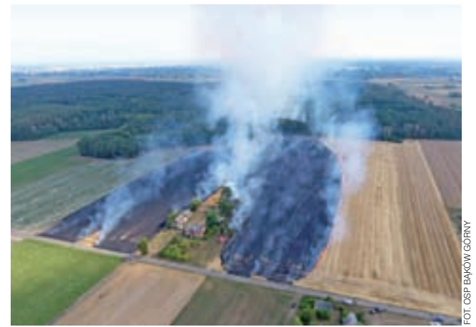
Pożar rżyska w miejscowości Leśniczówka w gminie Bielawy.