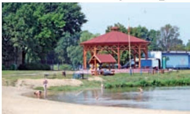
Mimo czerwonej flagi nad zalewem „Mroźyczka” w Głownie nie brakuje amatorów kąpeli.