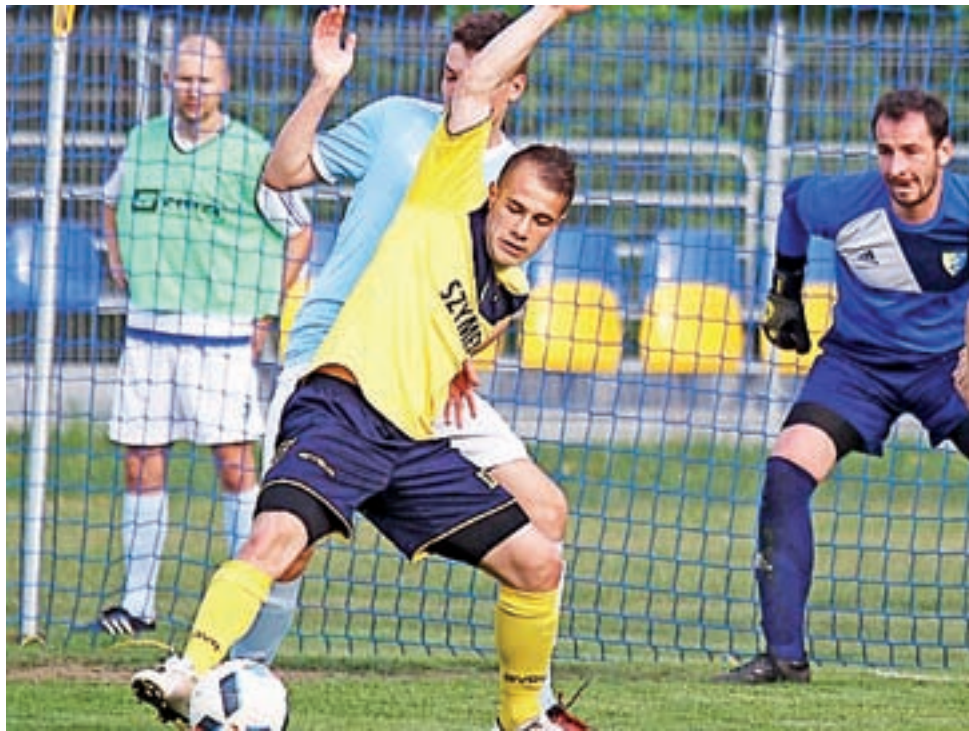
Piłkarze Strykowa (błękitne koszulki) na cztery rozegrane sparingi wygrali trzy. To dobry zwiastun przed zbliżającymi się rozgrywkami IV Ligi w sezonie 2019/2020.