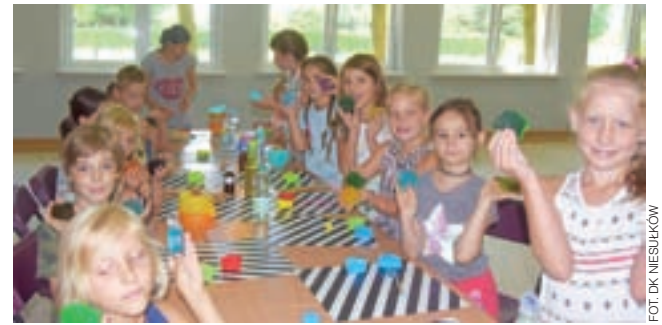
Dzieci prezentują mydełka przed chwilą wyjęte z foremek.