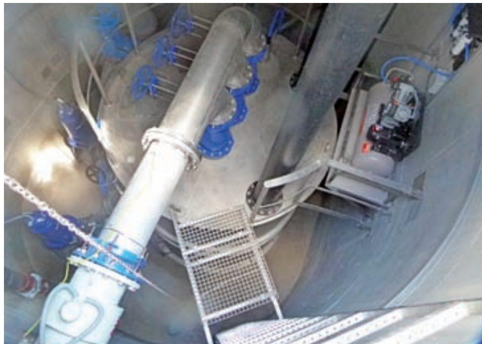
Nowoczesna tłocznia – to tutaj trafią ścieki z miasta.