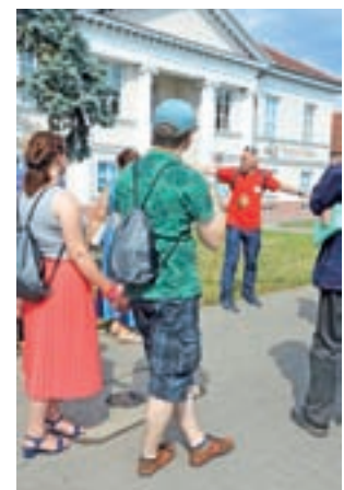
Przewodnik i uczestnicy spaceru przy gmachu dawnej Poczty Konnej (ul. 3 Maja).

W spacerze udział wzięli nie tylko mieszkańcy Łowicza, ale także goście z Warszawy i Gdyni. Łącznie były 24 osoby. Na pamięt-