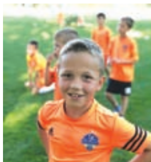
Gracze Soccer Kids byli bardzo zadowoleni z pobytu w Rynie.

Był też wyjazd do Parku Tropikana w Mikołajkach, rejs mo-