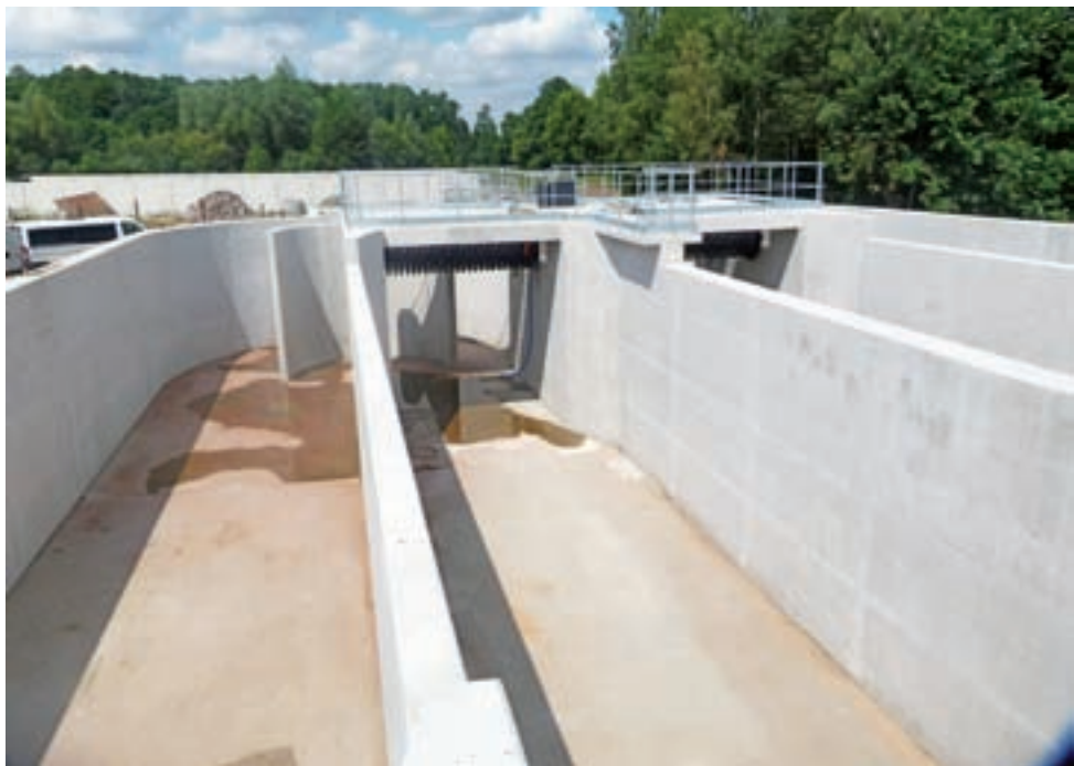
Reaktor biologiczny. Tutaj w procesie oczyszczania ścieków będą uczestniczyły mikroorganizmy.