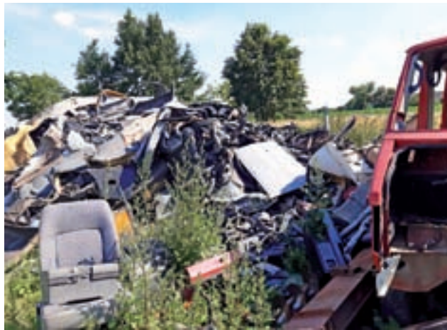
Zastany na miejscu przez urzędników stos porozbiórkowych części pojazdów.

Z informacji, jakie otrzymaliśmy we wtorek, 30 lipca, od dyrektora WIOŚ Artura Owczaraka wynika, że w sprawie zebrany został już cały materiał, a do for-