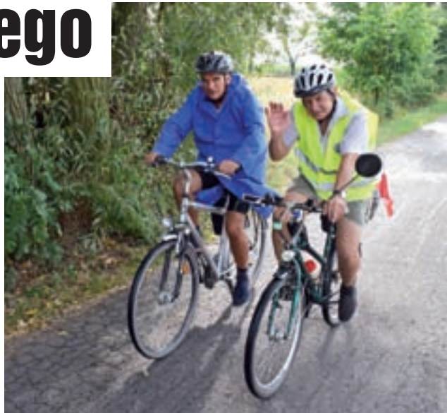
Uczestnicy rajdu w Zduńskiej Dąbrowie, w samej końcówce trasy wyznaczonej na pierwszy dzień.

Pierwszego dnia uczestnicy pokonali 75 km. Wyruszyli ze Starego Rynku około 10.30, na miejscu, czyli w internacie Zespołu Szkół CKR w Zduńskiej Dąbrowie, gdzie nocowali, zameldowali się przed 17.30. Pokonali 75