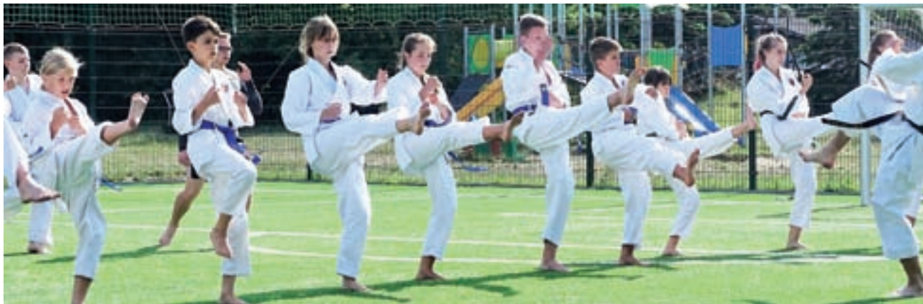
Treningi karate podczas obozu w Mikoszewie dostarczyły wielu doświadczeń.