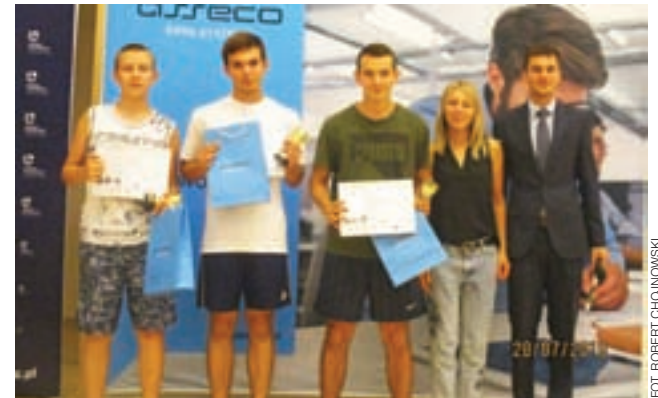
Całe podium do lat 18 zajęli zawodnicy z Nieborowa.