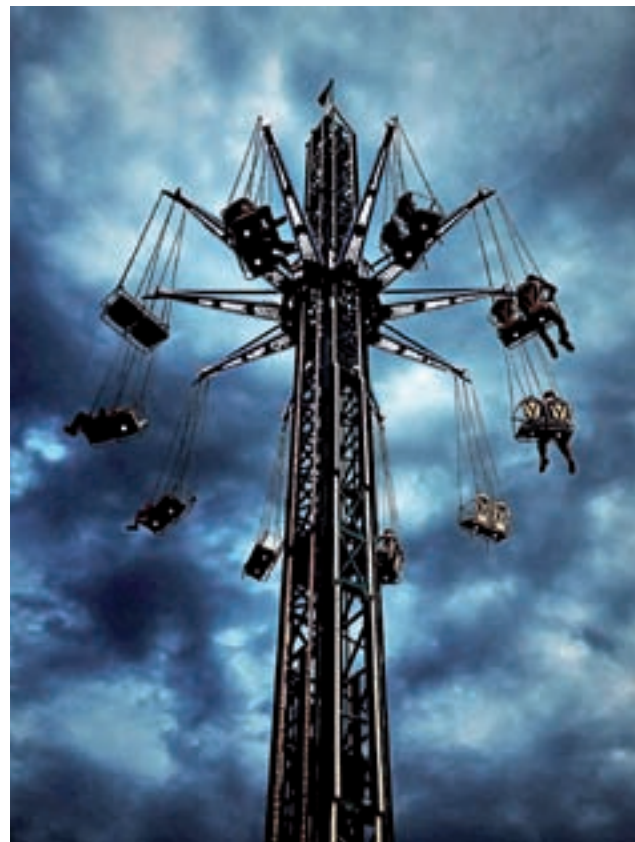
W ostatnie Boże Ciało adrenalinę na karuzeli podnosiła nie tylko jej wysokość, ale także ciemne chmury na niebie, które uchwycił na zdjęciu Paweł Kaczmarek.

Co ciekawe, Paweł większość swoich zdjęć potrafi skojarzyć z jakimś wybranym fragmentem