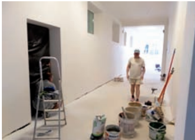
Korytarze na pierwszym i drugim piętrze szkoły zmieniają się z dnia na dzień. Stan na 31 lipca br.

Dodajmy, że od tego czasu własnym sumptem wykonano już