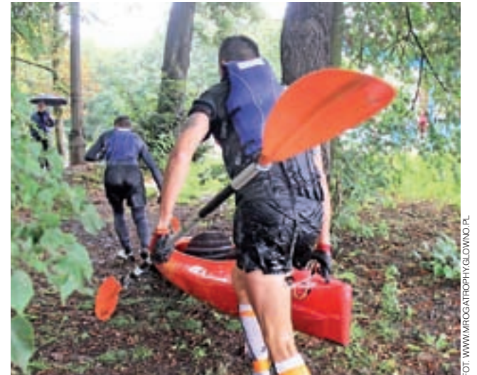
Stary element Mroga Trophy, czyli raz kajakiem, raz z kajakiem.

Mroga Trophy to nie jest zwyczajny spływ kajakowy. Uczestnicy muszą odznaczyć się dużą sprawnością fizyczną, bowiem liczne meandry rzeki oraz tarasujące koryta drzewa sprawiają, że wielokrotnie trzeba wyskakiwać z kajaka i przedzierać się z nim przez przeszkody. Impreza organizowana jest przy okazji Rodzinnego Pikniku w ramach Kreatywnego Lata Rodzinnego w Głownie 2019. Meta ponad 5 km odcinka z Dmosina do Głowna mieścić się będzie na terenie rekreacyjnym przy przystani nad zalewem Mrożyńskim w Głownie. Dla wszystkich uczestników przewidziano pamiątkowe medale, wodę i przekąskę, a dla najlepszych trzech załóg puchary. wp