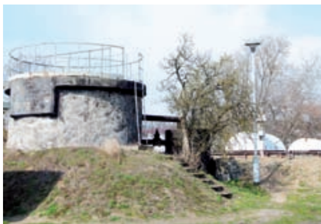
Oczyszczalnia ścieków w Bratoszewicach.

Przypomnijmy, że na ostatniej sesji Rady Miejskiej 27 czerwca, przyjęto uchwałę w sprawie zaciągnięcia pożyczki długoterminowej na preferencyjnych warunkach z Wojewódzkiego Funduszu Ochrony Środowiska i Gospodarki Wodnej w Łodzi z przeznaczeniem na rozbudowę oczyszczalni ścieków w Bratoszewicach w łącznej wysokości 3,05 mln zł. Inwestycja, której realizacja rozpoczęła się w czerwcu i potrwa do połowy 2022 roku, ma kosztować gminę w sumie ponad 16,5 mln zł.