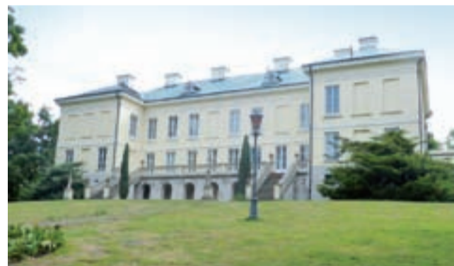
Pałac w Walewicach, widok od strony parku.

– Niedawno jechałem rowerem i z pobliskiego drzewa poderwał się orzeł, trzymający w szponach