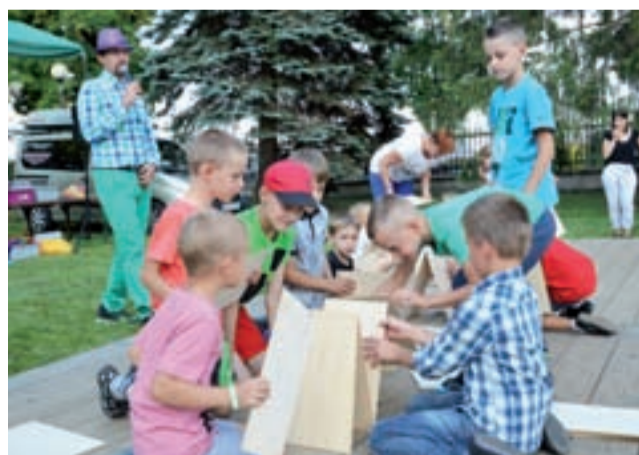
Zabawy z wodzirejem. Drużyna chłopców układa wieżę z drewnianych kart.

Nad stawem parafianie mogli obejrzeć pokaz ratownictwa dro-