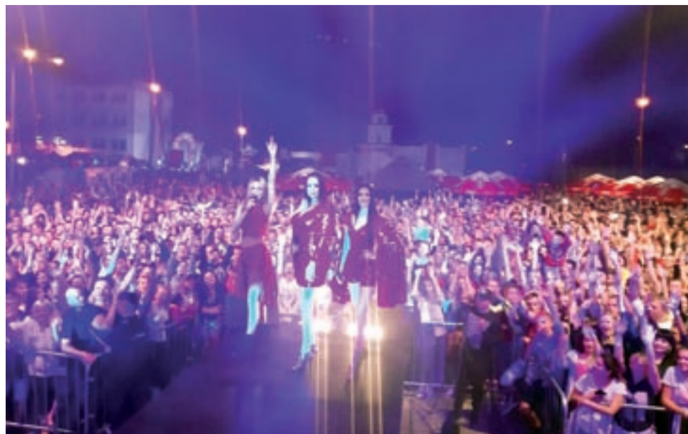
Gwiazdą wieczoru na festynie w Łyszkowicach był trzyosobowy girlsband Top Girls.

– Wtedy to już przed sceną nie było gdzie szpilki wcisnąć – relacjonują nam uczestnicy festynu. Muzycy disco-polo zwykle mają doskonały kontakt z publicznością. Loverboy podczas swojego występu rozdał pewnie i z kilka-