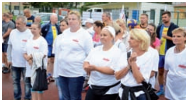
Zawodnicy w koszulkach z napisem „Solidarność” Łowicz podczas ubiegłorocznej Spartakiady.

Podobnie jak rok temu, rozegrane zostaną następujące konkurencje: piłka siatkowa kobiet (drużyny 4-osobowe), piłka siatkowa