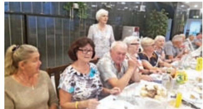
Tym razem w zabawie, która trwała od godz. 16 do 21 uczestniczyło około 90 osób.