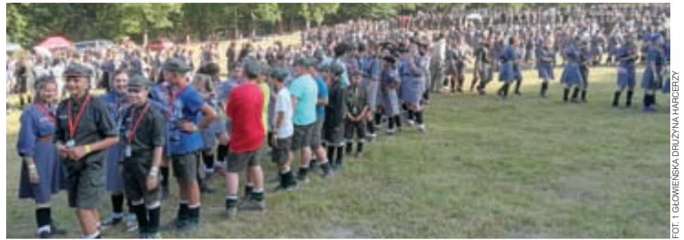
Belgijka. Przygotowanie do bicia rekordu Polski.

Głowno | Złot Trzydziestolecia Związku Harcerstwa Rzeczypospolitej