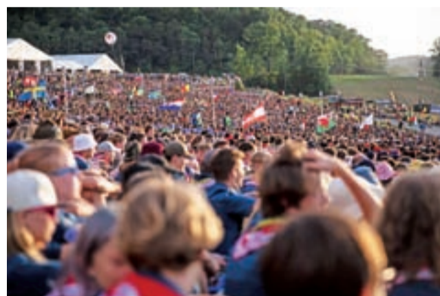
W 24. Światowym Jamboree Skautowym udział wzięło około 46 tys. uczestników z ponad 160 krajów świata. Na zdjęciu ceremonia otwarcia.