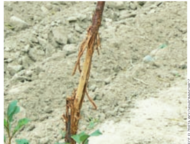
Uszkodzona sadzonka wiśni. Plantatorka twierdzi, że aby uratować to drzewko, trzeba je przyciąć poniżej widocznego uszkodzenia, a więc sporo poniżej korony.

O danielach niszczących uprawy na pograniczu Głowna i gminy Głowno rozmawialiśmy z przewodniczącym Zarządu