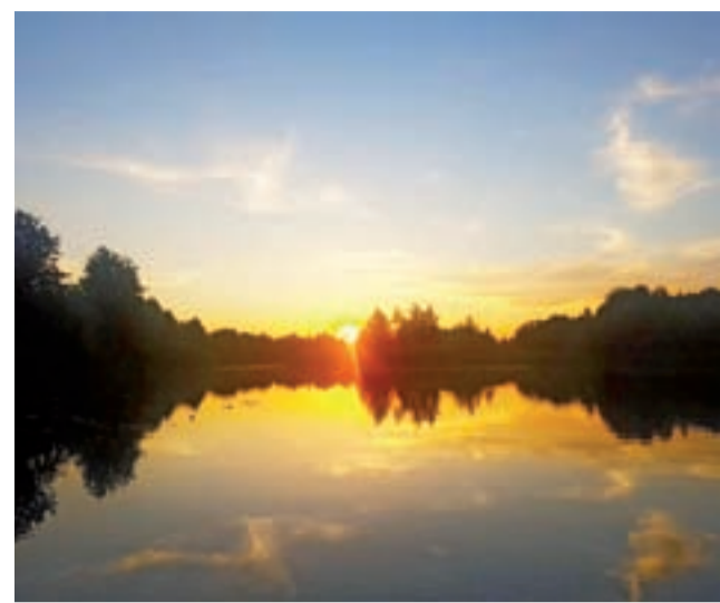
Jeziro w Dąbkowicach – jedno z częściej fotografowanych miejsc w naszych okolicach. Tym razem podczas zachodu Słońca.