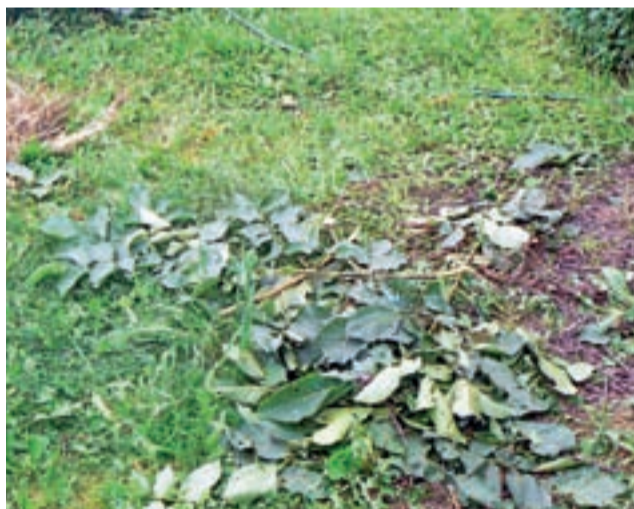
Resztki po posiłku. Daniele obgryzły na Kamieńskiej m.in. sadzonkę orzecha włoskiego i połamały gałęzie, których nie dało się uratować.

Wiemy, że problem szkód czynionych przez daniele w uprawach został już zasygnalizowany w Urzędzie Gminy Głowno, a być może także i w Urzędzie Miejskim w Głownie, lecz do zamknięcia numeru nie udało nam się ustalić, czy i jaką rolę mogą mieć urzędy w rozwiązaniu tej sprawy. ■