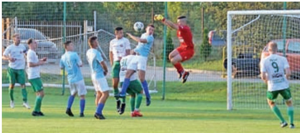
Zjednoczeni Stryków (błękitne koszulki) zanotowali jeden z najgorszych początków sezonu od lat.

Kilka dni później w sobotę, 17 sierpnia podopieczni trenera Łukasza Wijaty rozegrali trudny pojedynek w Zgierzu, gdzie czekały ich derby powiatu z Borutą. Gospodarze lepiej wystartowali w tym sezonie, pokonując 3:1 na wyjeździe Orzeł Nieborów. Zgierzanie jeszcze przed spotka-