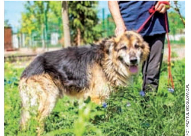
Dolar. Psi staruszek, który najprawdopodobniej został porzucony przez poprzednich właścicieli ze względu na wiek. Przebywa w przytulisku na ul. Piaskowej w Głownie.

Często to właśnie wolontariusz-wizytator TPZ uzmysławia potencjalnemu opiekunowi, czego ten może spodziewać się, gdy przóg jego domu przekroczy nowy czworonożny mieszkaniec, czyli np., że szczenię może gryźć meble i sikać na podłogę, że trzeba będzie chować buty do szafki. Wolontariusz pyta o poprzednie lub inne obecnie mieszkające w domu zwierzęta, opowiada o podstawowych obowiązkach opiekuna – nie po to, by go wystraszyć i zniechęcić, lecz po to, by decyzja została podjęta świadomie i odpowiedzialnie.