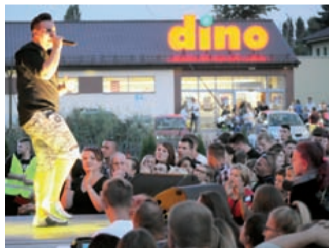
Kilkanaście minut po godzinie 20 na scenę wkroczył Loverboy, a pod sceną wtedy zaczęło robić się tłoczno.

– Wtedy to już przed sceną nie było gdzie szpilki wcisnąć – relacjonują nam uczestnicy festynu. Muzycy disco-polo zwykle mają doskonały kontakt z publicznością. Loverboy podczas swojego występu rozdał pewnie i z kilka-