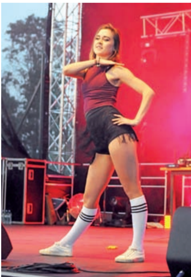
Loverboy'owi towarzyszyły na scenie skąpo ubrane tancerki.

Kilkanaście minut po godzinie 20 na scenę wkroczył Loverboy z dwiema tancerkami. Przed sceną zrobiło się naprawdę tłoczno, a miłośników disco-polo cały czas przybywało. Później zaplanowany był bowiem koncert zespołu Bayera, pokaz sztucznych ogni w przerwie pomiędzy występami, a gwiazdą wieczoru był trzyosobowy girlsband Top Girls.