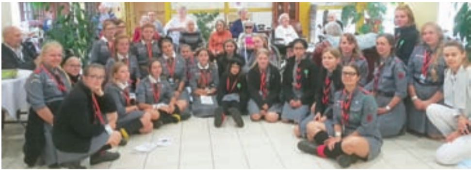
Na służbie. Harcerki podczas odwiedzin u mieszkańców Domu Pomocy Społecznej w Olsztynie.