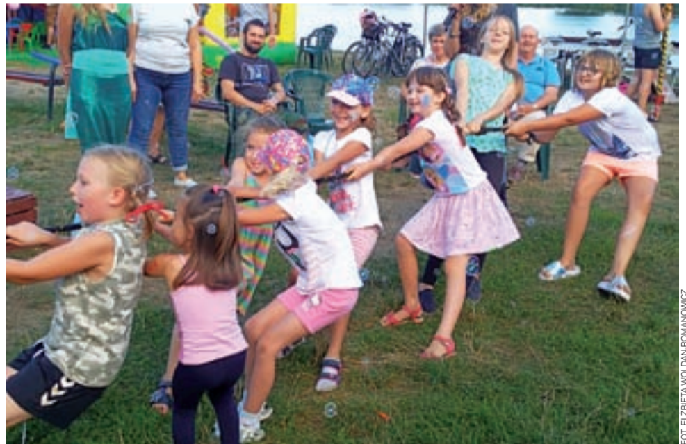
Przebieganie liny. Jedna z konkurencji niedzielnego pikniku.

Galerię zdjęć z Bajkowej Skandynawii nad Mroźyczką publikujemy w serwisie lowiczainfo