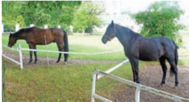
Walewickie konie. Wiele osób zastanawia się dziś, jak potoczą się losy stadniny po przejęciu jej przez większą spółkę buraczaną.

Potraw z walewickiego karpia, a także z wołowiny z hodowanego przez spółkę bydła mięsnego