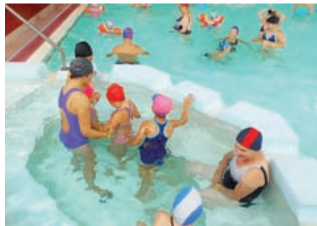
W skierniewickim basenie. Na wyjazdy na pływalnie zawsze jest komplet chętnych.

Z początkiem roku szkolnego obydwie drużyny ruszą z akcją naborową, by zachęcić uczniów począwszy od klas IV szkoły podstawowej do wstępowania w szeregi ZHR. To ciekawa propozycja na spędzenie wolnego czasu dla wszystkich, którzy lubią przebywać na świeżym powietrzu, chcieliby zdobyć różne umiejętności (m.in. z zakresu pierwszej pomocy), rozwinąć się artystycznie (zwłaszcza dziewczęta często razem śpiewają) i przeżyć razem niejedną ciekawą przygodę. ■