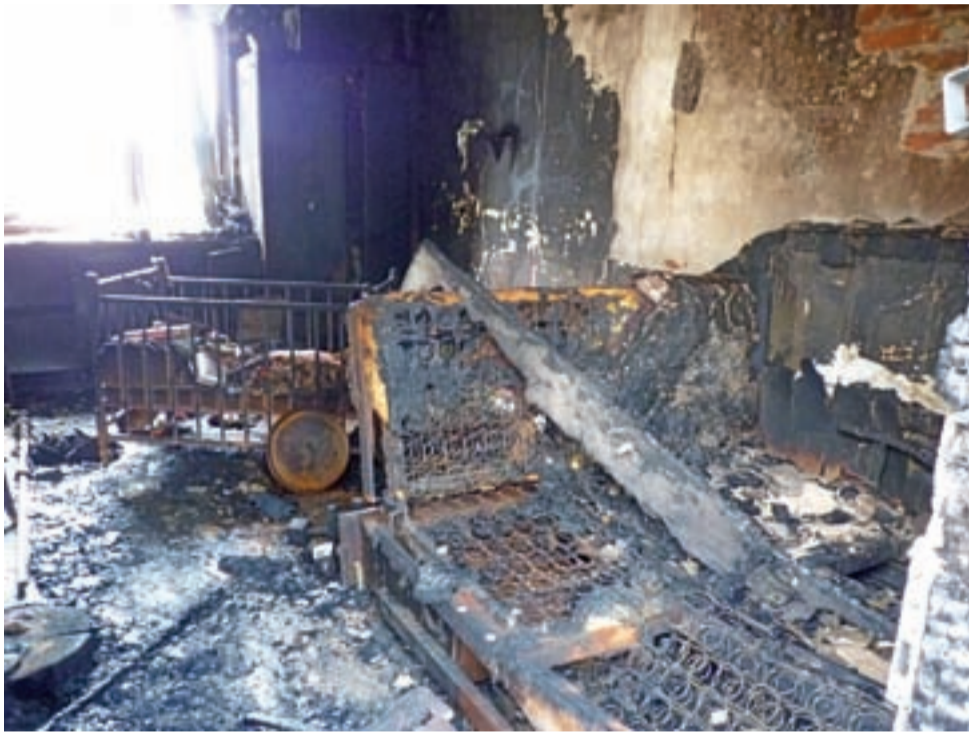
Spłonęły wszystkie meble, a wśród nich łóżeczko, w którym na szczęście feralnej nocy nie spało dziecko.

Dom nie był ubezpieczony. Dziś nie nadaje się do zamieszkania. Właściciele wiedzą, że dochody z emerytur i pracy to, przy rozmiarze poniesionych strat, kro-