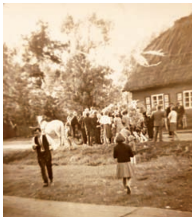
Takie to były początki. Kolejka po lody sprzedawane wprost z wozu. To mógł być rok 1969.

Do produkcji lodów potrzebny był lód, który pozyskiwano