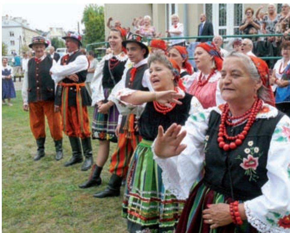
Część zespołów swoje występy prezentowała w łowickich strojach ludowych.