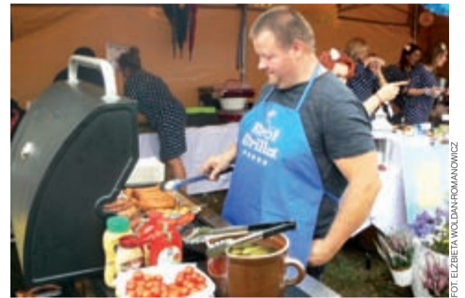
Królewskie dania. „Król Grilla” serwował gorące kiełbaski przy stoisku KGW Kalinów.