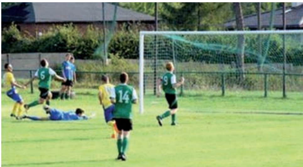
Piłkarze Stali (żółto-niebieskie stroje) od początku sezonu są w wybitnej formie strzeleckiej. Takich osiągnięć, jak głównianie nie ma w tej chwili żaden zespół w okręgu łódzkim.

W sobotę, 7 września na stadionie przy ul. Kopernika w Głownie rozpadła drużyna pod wodzą