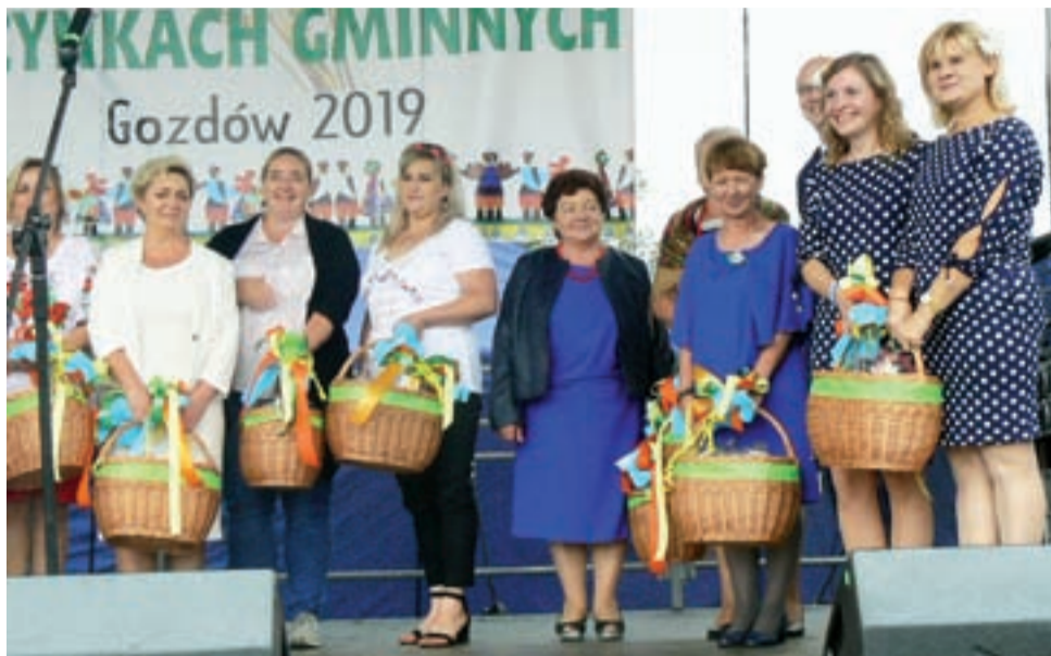
Podziękowania dla kół gospodyń. Prezeski KGW odebrały od władz gminy kosze upominkowe – w podziękowaniu za to, że koła przygotowały dożynkowe stoły.

Na święcie plonów dopisali parlamentarzysty kończącej się kadencji, dbający o to, by po-