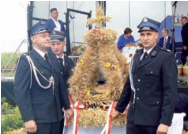
Dożynkowy wieniec. Na scenę wnieśli go strażacy z jednostki OSP w Gozdowie.

Galerię zdjęć z Gminnych Dożynek w Gozdowie zamieszczamy w naszym serwisie www.lowiczanie.info w zakładce Główny/Stryków.