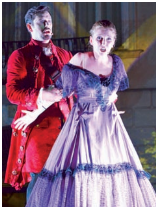
Tytułowy bohater z Donną Elwirą, którą rozkochał, wykorzystał, porzucił – a potem chciał „pocieszyć”.