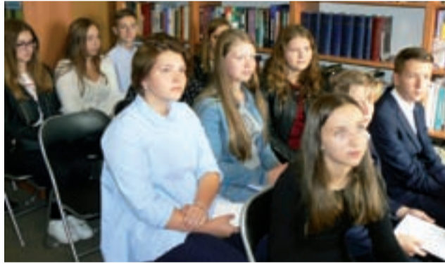
Narodowe Czytanie w Głownie zorganizowano w czytelni Miejskiej Biblioteki Publicznej. Na zdjęciu – zasłuchani uczestnicy.

Trema, zaangażowanie, a przede wszystkim doskonały efekt końcowy wszystkich prezentacji doczekały się nagrody w postaci gromkich braw publiczności. Na koniec uczestnicy spotkania