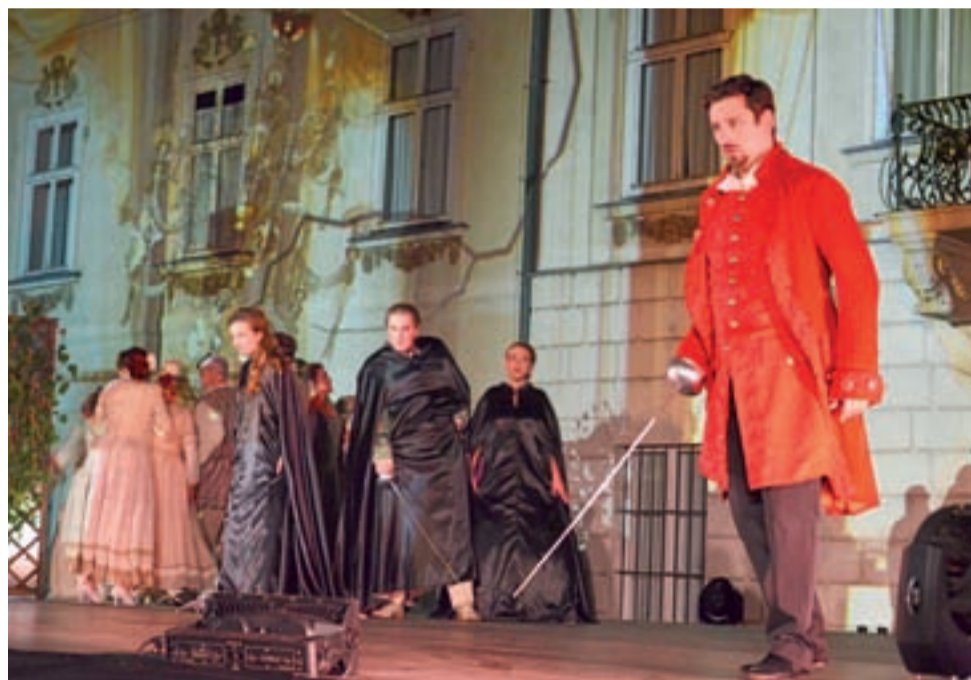
Don Giovanni (z prawej) to cynik, który nie cofnie się przed niczym, by spełnić swe zachcianki.

Pierwsza część spektaklu przebiegała bez problemów, widownia była zachwycona tak śpiewem, jak i oprawą sceniczną. Nagłośnienie było bezbłędne, głosy młodych przecięź śpiewaków brzmiały znakomicie, mapping na ścianie (wykorzystano zdjęcia z wnętrza nie-