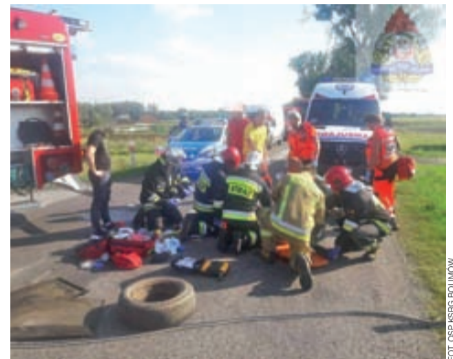
Działania straży pożarnej na miejscu wypadku.

Po udzieleniu pierwszej pomocy kierowca został przekazany ratownikom medycznym, a następnie załozce wezwanego z Płocka śmigłowca LPR „Ratownik 18”, którym został zabrany do szpitala w Zgierzu. Nieoficjalną drogą do-