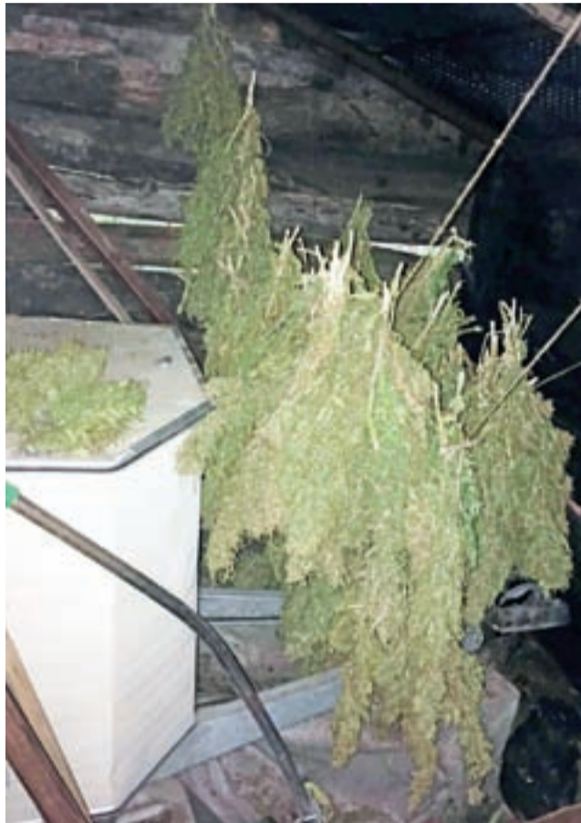
Wykrycia narkotyków i broni w przyczepie kempingowej dokonali policjanci z Komendy Wojewódzkiej i Miejskiej w Łodzi oraz Komendy Powiatowej w Zgierzu.

Wspomnianego dnia policjanci pojawili się na jednej z posesji pod Strykowem, bowiem istniały przesłanki o przebywaniu tam poszukiwanego 44-letniego mieszkańca powiatu zgierskiego. Nie zastali go na miejscu, jednak na działce w przyczepie kempingowej zauważyli 35-letniego męż-