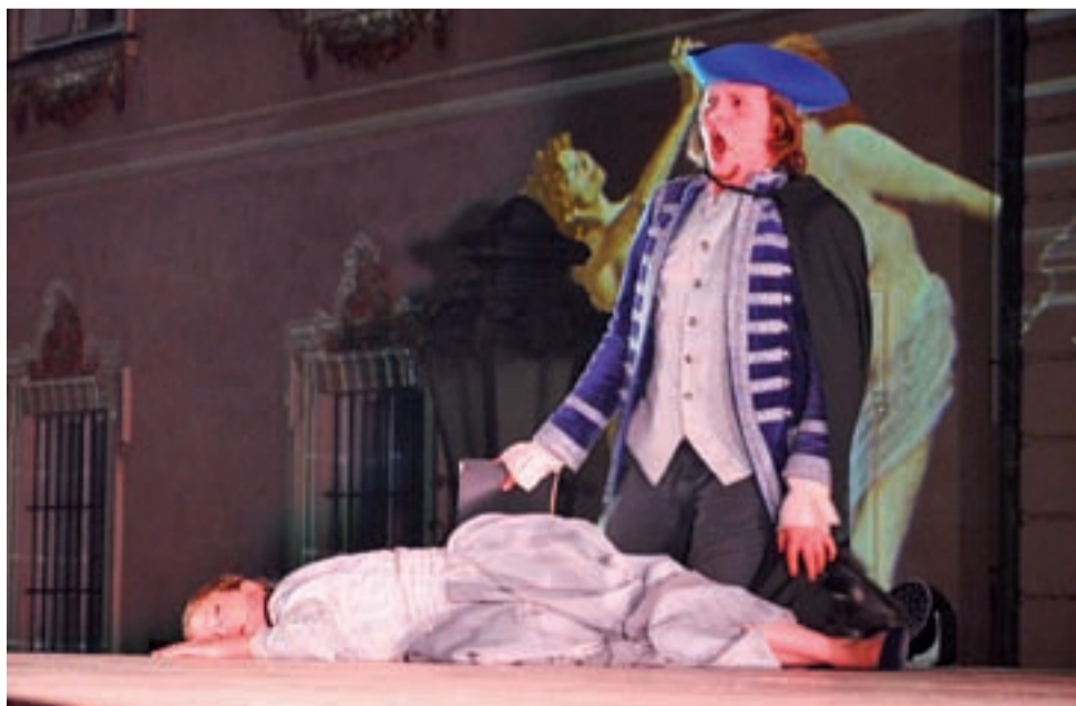
Leporello, sługa Don Giovanniego, właśnie ujawnił zapisaną w kajecie historię miłosnych podbojów jego pana.