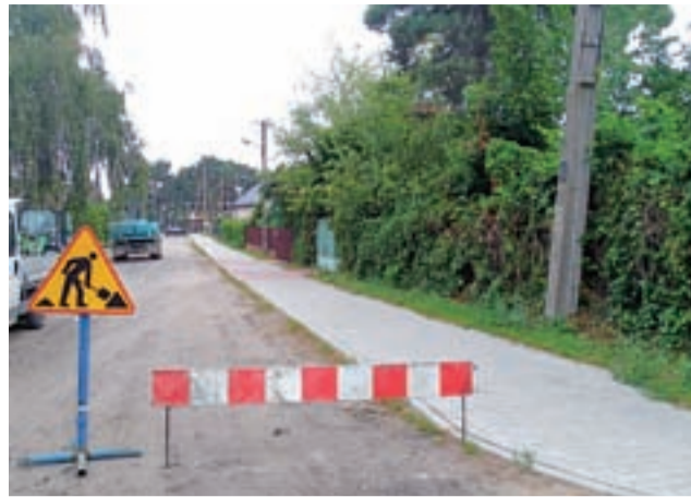
Prace przy ul. Czarnieckiego już się rozpoczęły. Widok od strony skrzyżowania z ul. Skłodowskiej-Curie na odcinek drogi wyłączony z ruchu samochodowego.

Podobnie jak w marcu, budowy ul. Czarnieckiego podjęła się firma Wig-Kost z Lenartowa. Przypomnijmy, że wówczas miasto za-inwestowało w poprawę jakości drogi 140 tys. zł. Koszt całości zadania opiewa na 473.904,51 złotych. aw