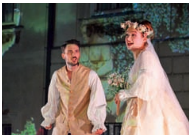
Masetto i Zerlina. Ich związek był szczęśliwy – do chwili, gdy pojawił się Don Giovanni.

Pod koniec pierwszego aktu, gdy trwała scena balu i chwilę później, gdy na fasadzie pałacu wśród wyświetlanych grafik pojawiły się pioruny, część osób z widowni rozbłąski na niebie za pałacem wzięła za efekty świetlne