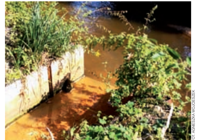
Nieczystości w postaci zawiesiny o pomarańczowym zabarwieniu spływały do rzeki w środę, 28 sierpnia.