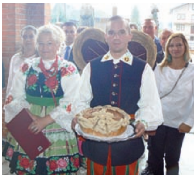
Dożynki parafialne. Starostowie i mieszkańcy parafii wnoszą do kościoła w Mąkolicach bochen dożynkowego chleba i wieniec ze zboża.

– Dożynki to nasza tożsamość. Na przestrzeni wieków obrzędy dożynkowe zmieniały swój charakter, jednak tak dawniej, jak i dziś, dożynki są ważne dla wszystkich, bo przypominają, że właśnie dzięki ciężkiej pracy rolnika codziennie trafia na nasze stoły chleb. Rzadko zdarza się rok, w którym pogoda w pełni sprzy-