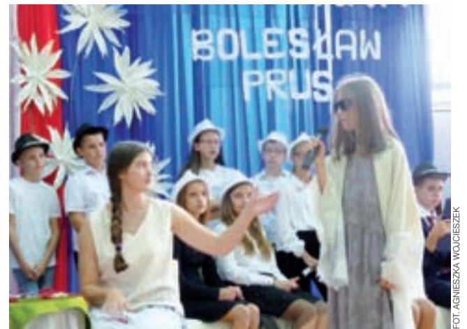
Do przygotowania przedstawienia wykorzystano ciekawe stroje i rekwizyty, które dopełniły całości.

Muzycznego w Łodzi współpracujących z fundacją Form. Art. Osoby, które przyniosły własne