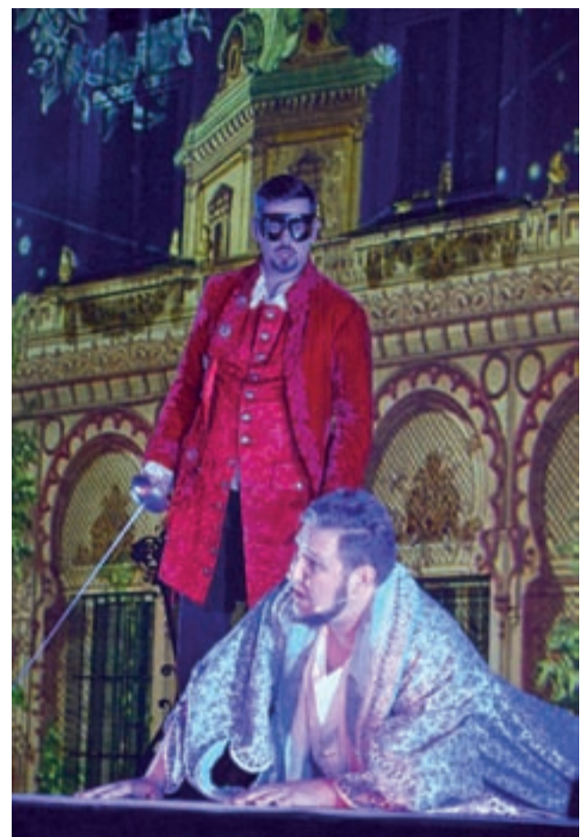
Jedna z pierwszych scen: Komandor na chwilę przed śmiercią, za nim ten, który go zabił.