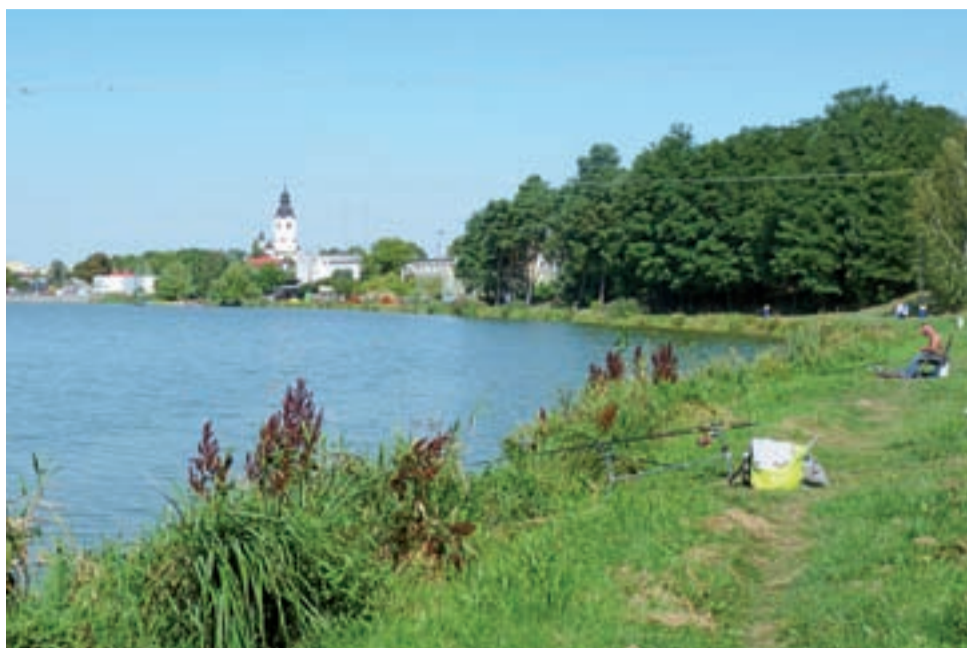
Strykowski zalew to ostoja wędkarzy. Dla nich to, o czym mówi się w magistracie, to – cyt. – „polityka”.

Ludzie wrzucają do wody nadmiar chleba. To, czego nie zjedzą ptaki, rozkłada się w wodzie nie sprzyjając ani jej wyglądowi, ani zapachowi.