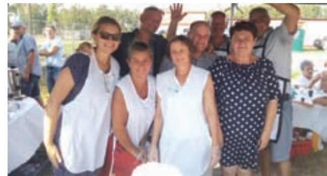
Przedstawiciele sołectw Kadzielin i Kamień w gminie Głowno.