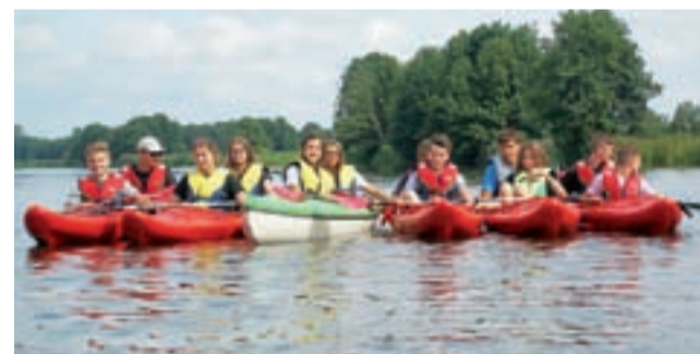
Uczniowie podczas spływu na Narwii.

Koncert wpisuje się tematycznie w wystawę „Jeszcze słychać śpiew i rżenie koni... Wrzesień 1939 roku w Łowiczu”, która do 13 października dostępna jest w Muzeum w Łowiczu. mwk