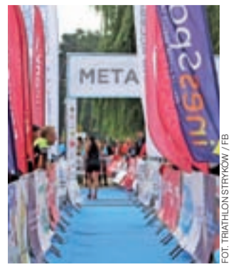
W sobotę, 14 września triathloniści zawładną okolicami Strykowa.

W godz. 9:00-16:00 zamknięte zostaną: część ul. Targowej od SP nr 2 w kierunku targowiska, dalej drogi w kierunku Cesarki, Bartolina, do Sierzni i odcinek Sierznia-Stryków, a także okolice Sosnowca, gdzie rozegra się część biegowa. Szczegółowa mapa utrudnień w ruchu drogowym dostępna na stronie www.triathlon-