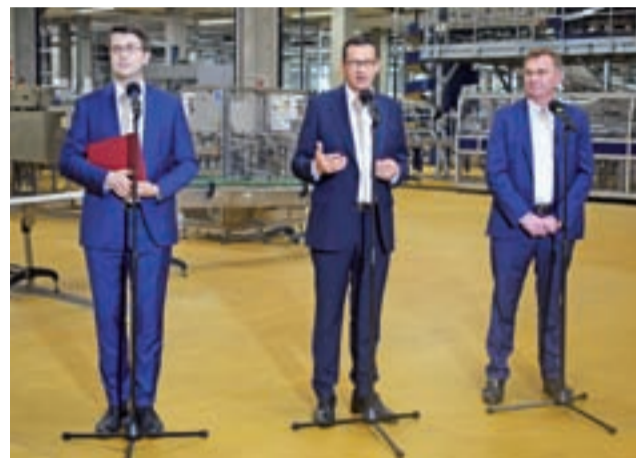
Konferencja prasowa w nowej hali produkcyjnej ZPOW „Agros Nova”.

Po miesiącu organ zwrócił się do głowienieńskiego urzędu z prośbą o wskazanie listy pięciu podmiotów gospodarczych, które mogą wymagać kontroli. str. 4