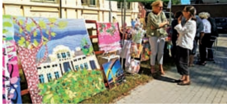
Plenerowa wystawa prac uczestników ŚDS w Głownie. Obraz na pierwszym planie został uszyty z różnych rodzajów tkanin, a przedstawia pałac Jabłońskich, czyli siedzibę ŚDS, przed którą urządzono wystawę.

Przyjemnie było oglądać kolorowe obrazy olejne, gobeliny, wyklejanki i rękodzieło w otoczeniu zieleni, w cieniu wiekowych drzew. Takie „otwarcie się” SDS-u i pokazanie plastycznych talentów uczestników nie pozostało w środowisku lokalnym niezauważone – jednodniową wystawę „Świat wokół mnie” odwiedzili m.in. uczniowie głowieńskich szkół podstawowych, przedstawiciele koła Słoneczne Dęby