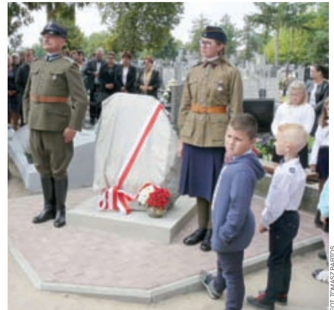
Chwila przed odsłonięciem pomnika na oszkowickim cmentarzu, aktu tego dokonały dzieci z miejscowej szkoły wspólnie z wójtami gmin Bielawy i Piątek.