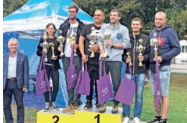
Zwycięcy klasy generalnej podczas II KJS Głowno.