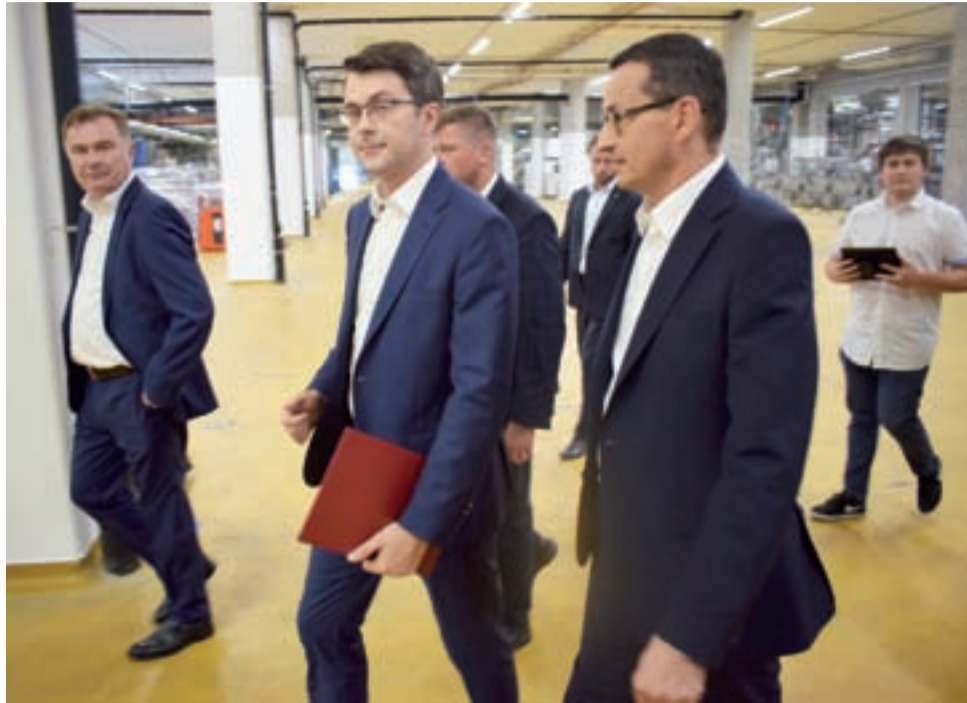
Koniec konferencji. Premier Mateusz Morawiecki wychodzi z hali produkcyjnej.

Premier mówił, że rząd pamięta o 1,5 do 2 mln Polaków żyjących za granicą, licząc na to, że atrakcyjne wynagrodzenia i warunki zakładania własnej działalności