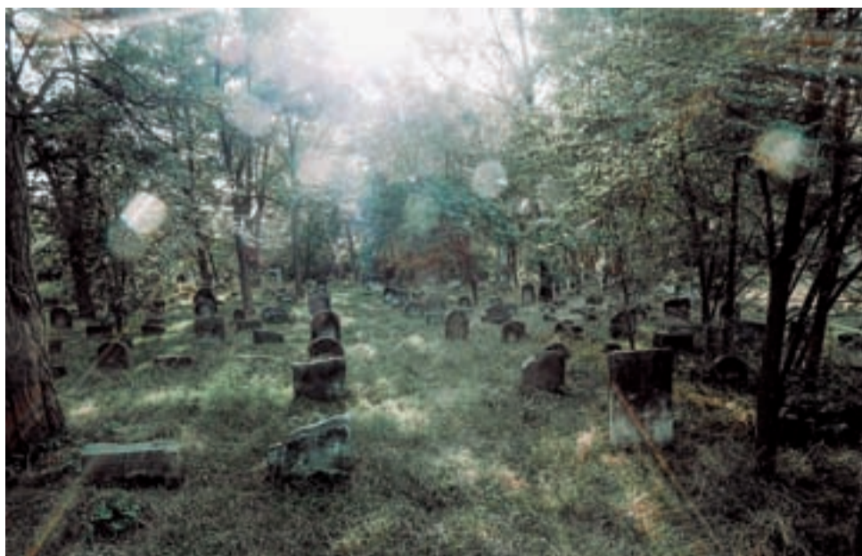
Bliki dodały jeszcze klimatu temu i tak klimatycznemu miejscu...

Gdy przyszedł czas na publikowanie swoich zdjęć w internecie, zaczął im nadawać osobisty charakter, poprzez dodawanie linków do utworów muzycznych, które go inspirowały, a także nadawanie specyficznego klimatu zdjęciom poprzez np. mroczniejszą kolorystykę – często czarno-białą.