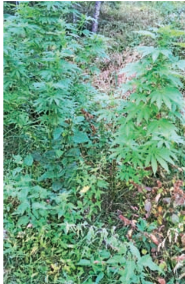
Konopie indyjskie w Starym Imielniku.

czyżnę, który został niezwłocznie zatrzymany. Po przeszukaniu przyczepy funkcjonariuszom uda-