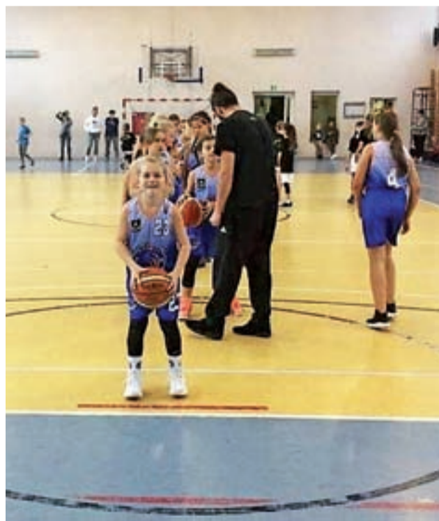
Koszykarki TK Basket Stryków (niebieskie stroje) grają na różnych poziomach wiekowych rozgrywek ŁZKos.

Z kolei pierwsze ligowe pojedynki w tym sezonie mają za sobą młodsze koszykarki Strykowa z drużyny TK Basket U-12. W niedzielę, 12 grudnia strykowska drużyna była gospodarzem 1. kolejki, w której rywalizowały zespoły