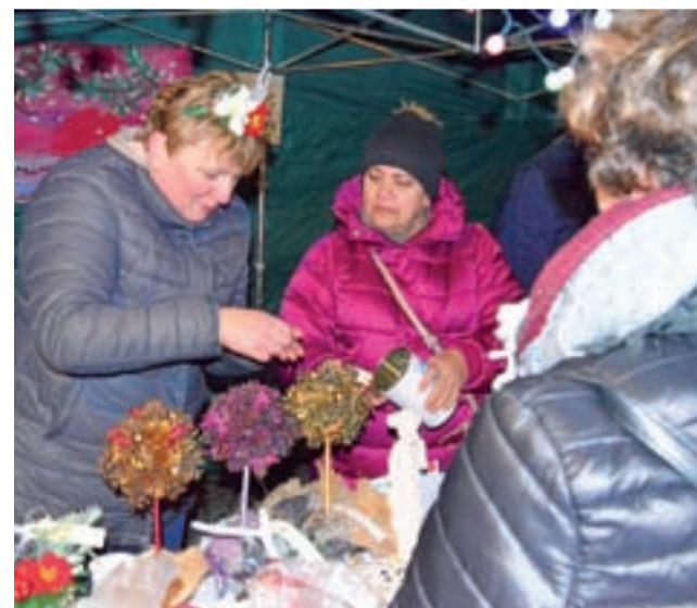
Można było wziąć udział w kiermaszu ozdób bożonarodzeniowych, wspierając w ten sposób Środowiskowy Dom Samopomocy i stowarzyszenie „Niezapominajka” z Głowna.