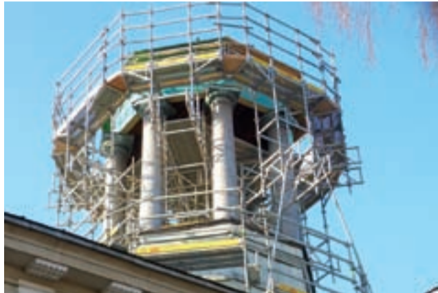
Glorieta w trakcie renowacji – zdjęcie z ubiegłego tygodnia.

Ze względu na zabytkowy charakter obiektu trudno jest mówić o choćby przybliżonych termi-