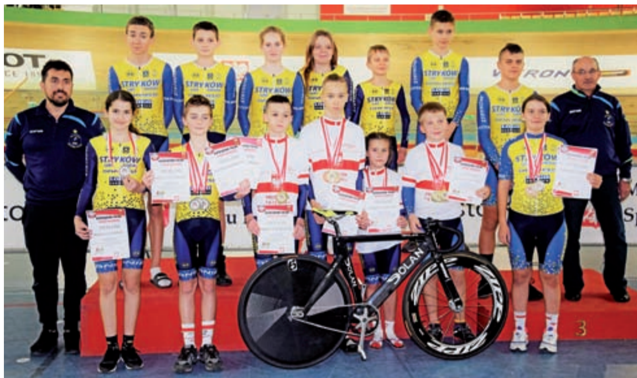
Szkółka Kolarska LUKS Dwójki Stryków zdobyła w Mistrzostwach Polski w kolarstwie torowym 21 medali i została najlepszą drużyną w kraju.

Uczestnicy rywalizowali w czterech konkurencjach: 250 m ze startu lotnego, scratch (na kreskę), wyścig eliminacyjny (co rundę