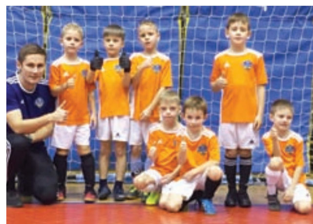
Soccer Kids zadowolone z turnieju rocznika 2013.