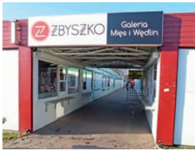
Firmę „Zbyszko” mieszkańcy Łowicza kojarzą z pawilonem na targowisku.

Poszkodowani w tej sprawie są hodowcy, którzy w ostatnim czasie sprzedawali firmie zwierzęta na ubój. Problemy z wypłacalnością zaczęły się pojawiać od oko-