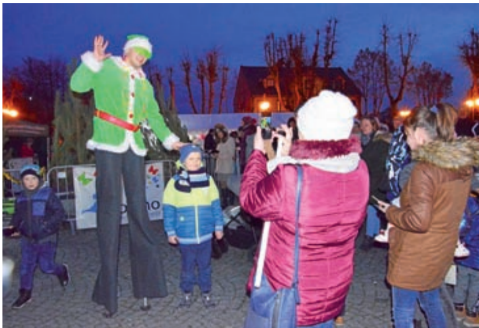
Okazją do zrobienia sobie świątecznego zdjęcia było spotkanie ze świątecznym elfem na szczudłach.