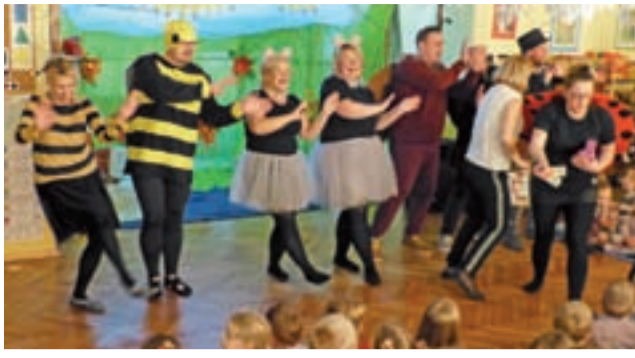
Na koniec wszyscy aktorzy zaprezentowali układ taneczny do piosenki „Tyle stońca w całym mieście” Anny Jantar.

Stanisława Moniuszki przedstawiać nie trzeba, tym bardziej w roku 200. rocznicy jego narodzin, bo nie będzie to pierwszy w ostatnim czasie koncert z jego kompozycjami. Być może nieco zapomnianym, ale bardzo ciekawym kompozytorem jest z kolei Otton Mieczysław Żukowski. W koncercie znajdują się jego opracowania kolęd i pieśni bożonarodzeniowych – zaledwie kilka z nich to popularne kolędy, większość to utwory rzadko wykonywane, wręcz unikatowe. Koncert 18 grudnia rozpocznie się o godzinie 12.00. Utworów z tego repertuaru w wykonaniu tych samych uczniów będzie można wysłuchać także 11 stycznia w Muzeum w Łowiczu. tm