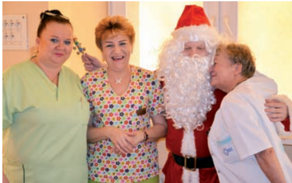
Prawdziwą radość z wizyty Mikołaja w szpitalu wyraziły też widoczne na zdjęciu pracownicy Izby Przyjęć.