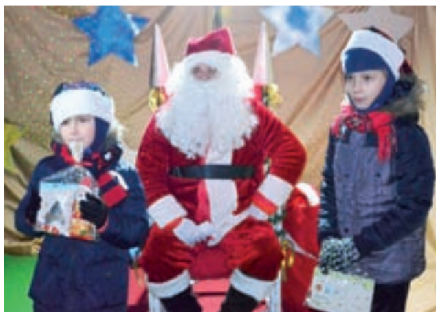
Spotkanie z Mikołajem było dla dzieci czymś niesamowitym.