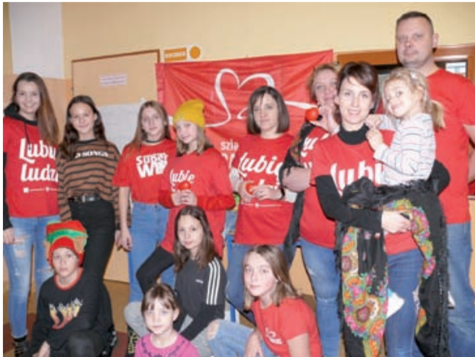
Wolontariusze głowieńskiej Szlachetnej Paczki w bazie, czyli SP 2.

Głowieńscy wolontariusze odwiedzili m.in. rodzinę, w której jest bardzo chory 13-letni chłopiec, który nie jest w stanie cho-