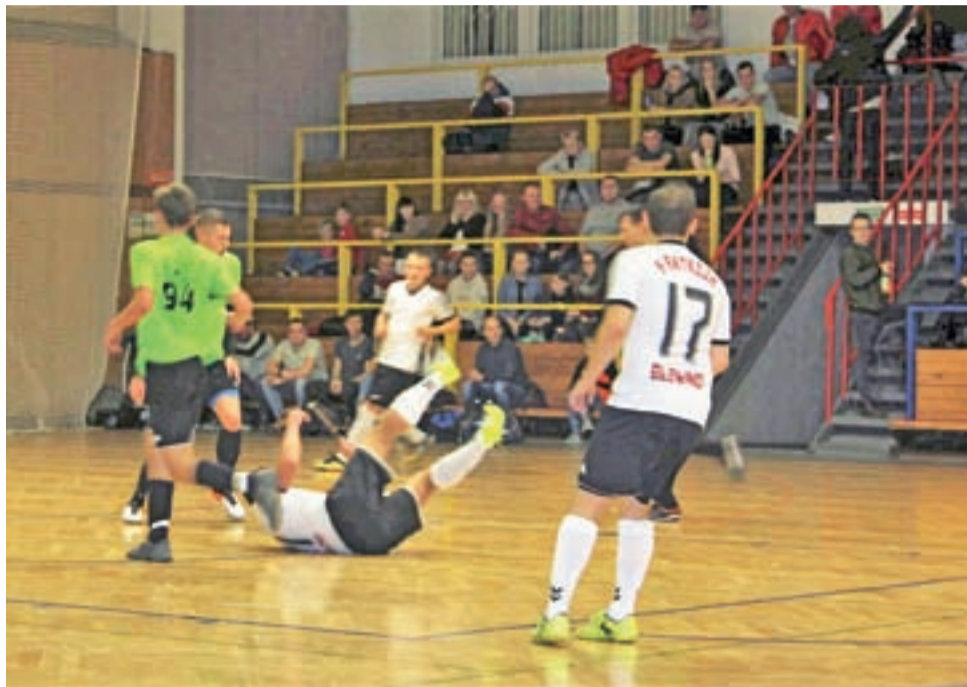
Piłkarze halowi Fantazji Głowno udanie zrehabilitowali się za poprzednią klęskę z liderem.

4. kolejka KIA Open I Ligi ŁoLiF: Bo-Dach Grudze – Błękitni II Dmosin 1:3, Błokerski Łowicz – Fantazja Głowno 3:7, Drużyna KIA Łowicz – Błękitni I Dmosin 1:1, Ogródowa SMS Fruktus Dąbkowice – Victoria Bielawy 12:0, Chińska