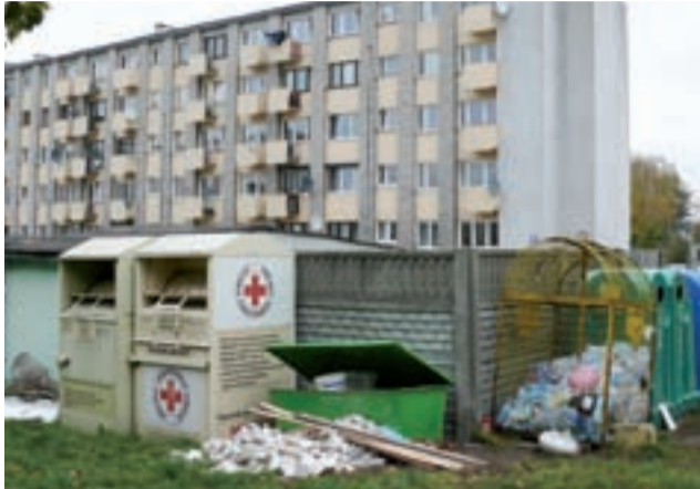
Ktoś wyrzucił śmieci poremontowe ... obok skrzyni do przechowywania piasku.

Ponieważ kontenery nie są przypisane do konkretnych budynków, za źle posegregowane odpady odpowiadać będzie całe osiedle.