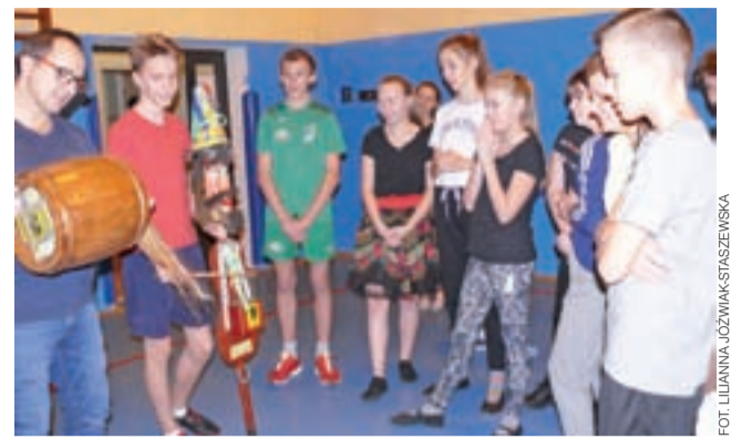
Redzanie przywieźli instrumenty: diaboliskie skrzypce i burczybas.

Nasza Nenka, czyli taniec ocepinowy, koseder, czyli odpowiednik staropolskiego poloneza i akrobatyczny dzek, czyli dzięki tańcom – wszystkich trzech miały okazję nauczyć się Koderki. Redzanie przywieźli ze sobą rów-