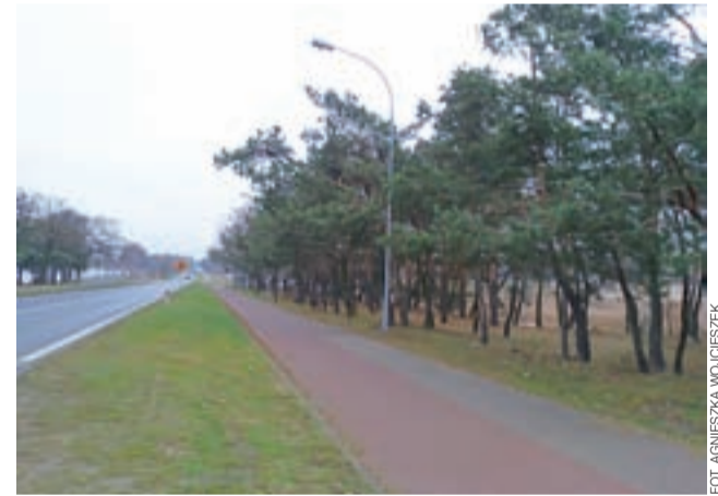
Deptak i ścieżka rowerowa przy 14-stce. To tutaj wystąpiły problemy z oświetleniem.

Ostatecznie, po usunięciu uszkodzeń kablowych oraz napra-