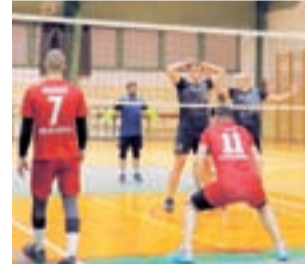
Mnichy z Głowna w akcji.

■ Następna, 6. kolejka odbędzie się w piątek, 13 grudnia: OSP Seligów – LKS Retki, Korabka Łowicz – Pijarska Łowicz, Awanturik Łowicz – Mnichy z Południa Głowno, I LO Łowicz – Dora Digital Łowicz.