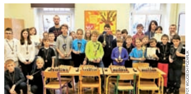
Uczestnicy Turnieju Szachowego w SP nr 1 w Strykowie.