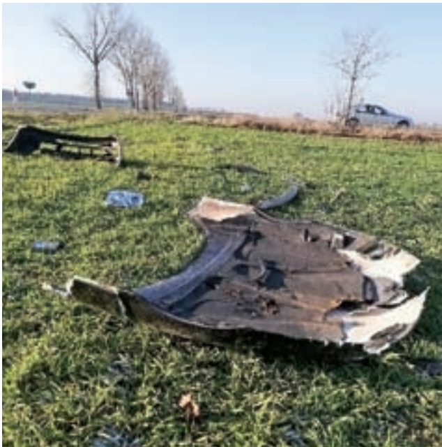
Na polu w Bocheniu pozostała nawet maska silnika Alfy Romeo, pas przedni i wiele innych części.