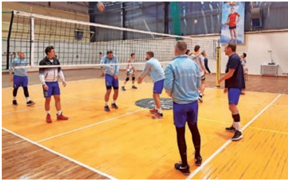
Siatkarze Stali Głowno ponieśli w Łodzi drugą porażkę w sezonie III Ligi.