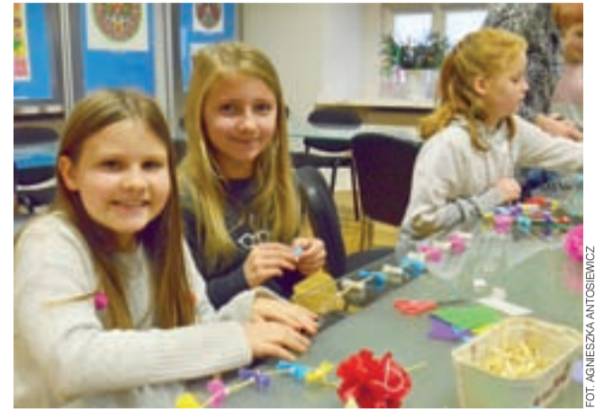
Świetna zabawa towarzyszyła uczestnikom warsztatów wykonywania ozdób choinkowych w muzeum.

Budynek był częściowo zniszczony podczas działań wojennych w 1914 roku, odbudowany po wojnie. W 1985 r., na mocy porozumienia pomiędzy administratorem parafii ewangelicko-augsburskiej w Łowiczu a naczelnikiem miasta, kościół wraz z przyległym placem został zakupiony przez Skarb Państwa za 9,16 mln zł. Andrzej Biernacki nabył go w 1991 r. 9 lat później została otwarta Galeria Browarna. tm