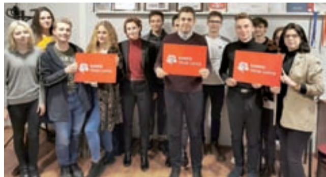
Pierwsze spotkanie łowickiej Młodej Lewicy w pomieszczeniu udostępnionym przez Stowarzyszenie Łowickie.pl.