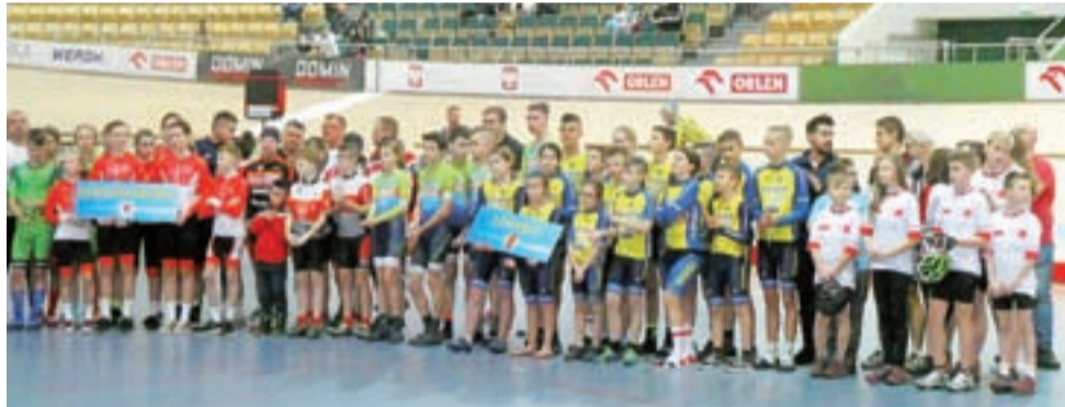
Strykowianie byli jedną z dwóch szkótek z województwa łódzkiego.

– To dla nas wielki wynik i jestem dumny z tego osiągnięcia. Przekroczyliśmy magiczną, wy-