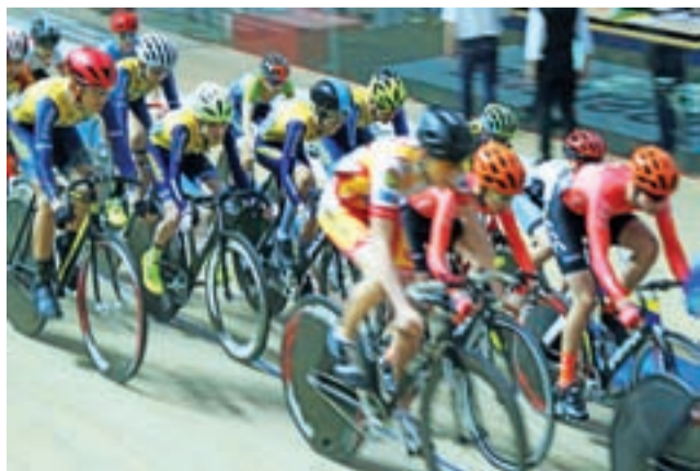
Żółto-niebieski rój w peletonie się popłoch wśród rywali.