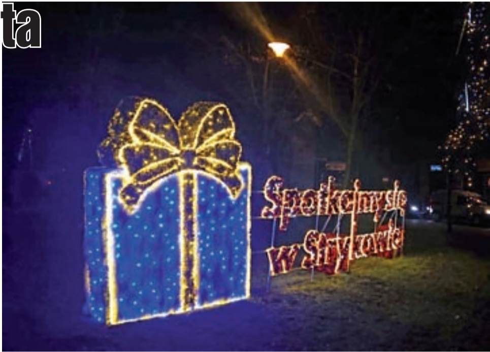
Nowe iluminacje rozblęsnęły w parku już na mikołajki.

W mikołajkowe popołudnie uruchomione zostały iluminacje świąteczne na słupach oświetleniowych wzdłuż ul. Warszawskiej, Kopernika, pl. Łukaszyńskiego i w parku przy kościele katolickim. Na budynku Urzędu Miejskiego rozblęsnęła napis „Wesołych Świąt” w towarzystwie bałwana i gwiazdek, a kolumnach wejściowych – łańcuchy. Świecące ozdoby znów upiększyły choinkę przy fontannie. Tu w tym roku pojawił się wysoki na ponad 2 m i szeroki na 6 m napis „Spotkajmy się w Strykowie” wraz z prezentem 3D – wszystko w wielobarwnej