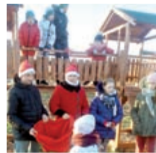
Pani Mikołajowa odwiedziła dzieci podczas otwarcia placu.

To inicjatywa Stowarzyszenia „Dla Naszej Wsi”, które pozyskało pieniądze z dotacji dla Kół Gospodyń Wiejskich zarejestrowanych w krajowym rejestrze Agencji Restrukturyzacji i Mo-