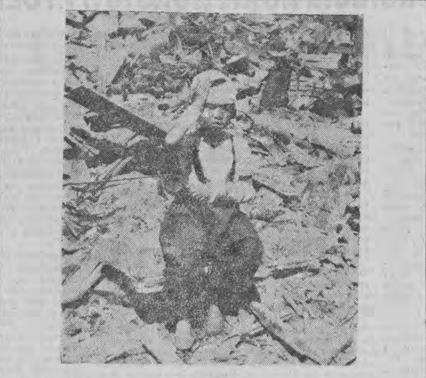
Ciężko ranne dziecko na zgliszczach zombombardowanego miasta koreańskiego — oto jedna z wielu ofiar agresji amerykańskiej.