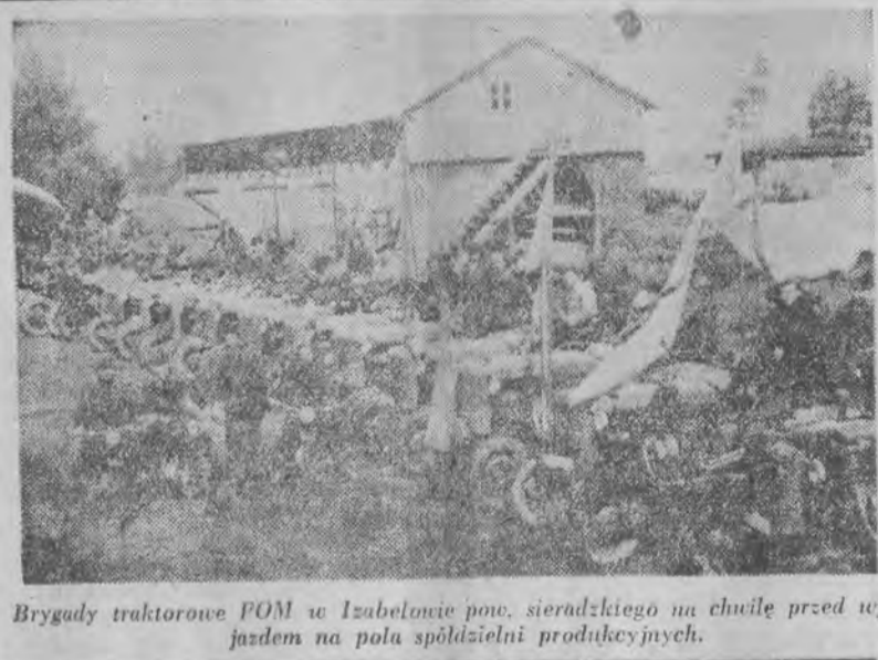
Brygady traktorowe POM w Izabelowcu pow. sieradzkiego na chwile przed wyjazdem na pola spółdzielni produkcyjnych.