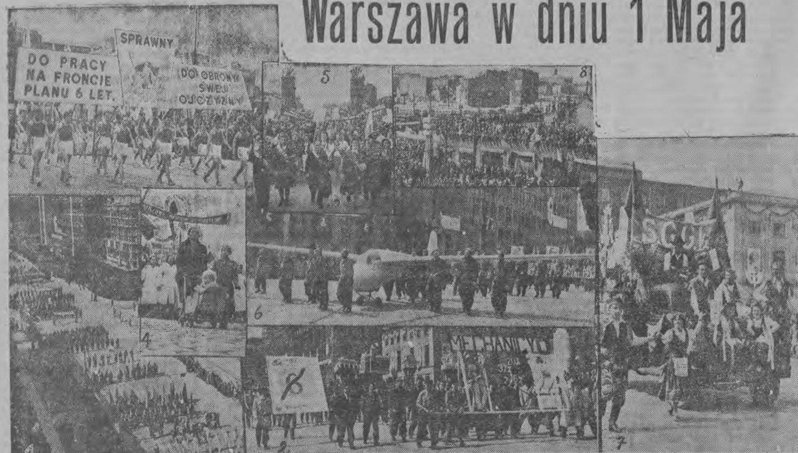
Tegoroczny obchód 1 Maja w Warszawie był wielkim świętem dumnego ze swoich wspaniałych osiągnięć narodu polskiego, wyraził naszą gotowość do nieugiętej walki o pokój i Plan 6-letni. Na ilustracji: 1) Fragment pochodu, 2) Studenci Wydziału Mechanicznego Politechniki Warszawskiej, 3) Defilada sportowców, 4) Matki z maleństwami biorą udział w pochodzie, 5) Maszerują przodownicy pracy, 6) Liga Lotnicza, 7) Szkoła Główna Gospodarstwa Wiejskiego, 8) Nieprzeliczone tłumy obserwują przebieg pochodu.