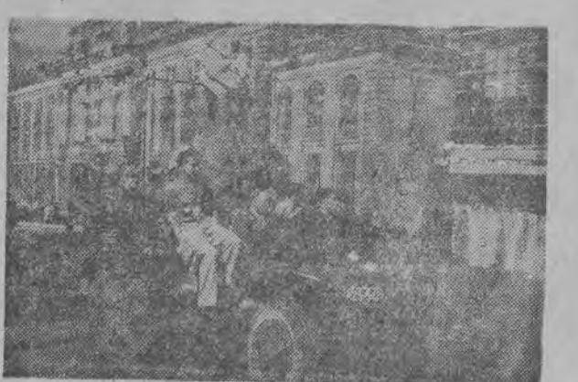
Kuźby — przedstawiające podlegaczy wojennych — wywiozły salwy śmiechu na ulicach Łodzi.