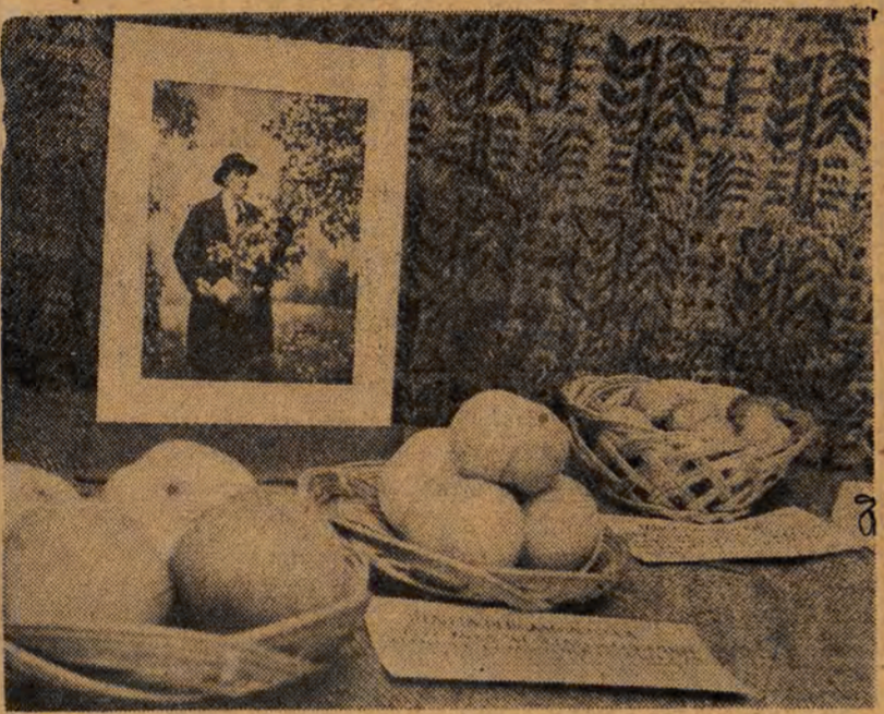
Na zdjęciu: okazowe owoce, wyhodowane w kraju metoda miczurinowska.