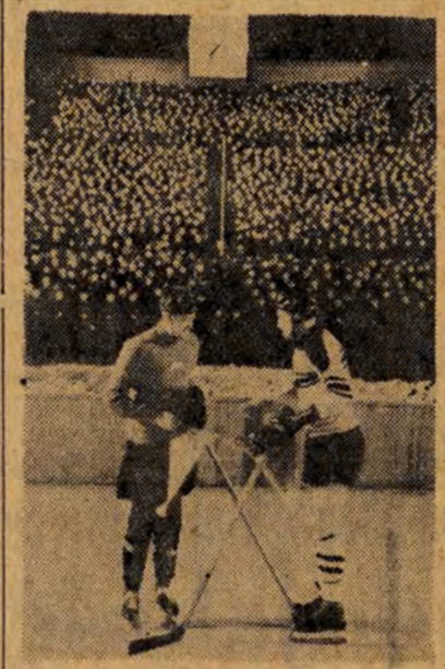
Na zaproszenie Wszechzwiązkowego Komitetu do Spraw Kultury Fizycznej i Sportu wyjechali na trening do Moskwy nasi hokeiści.