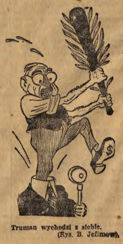
Truman wychodzi z siebie. (Rys. B. Jefimow)

Wprowadzenie „stanu wyjątkowego” zmierza więc do ostatecznej likwidacji praw narodu amerykańskiego do celu umożliwienia monopolistom nieograniczonego wycisku mas pracujących i usunięcia przeszkód w przygotowaniu nowej wojny.