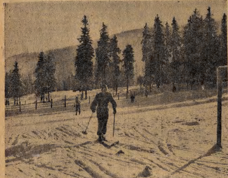
Ostatnio odbyły się w Zakopanem zorganizowane przez Polski Związek Narciarski pierwsze masowe zawody na odznakę „Sprawny do pracy i obrony“.

Na zdjęciu: młodzi narciarze na trasie biegu.