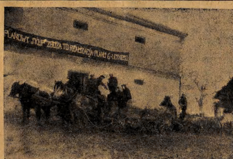
Chłopi z Tychowa, pow. łódzki, odstawili manifestacyjnie nadwyżki zbożowe na punkt skupu

W myśl uchwały, zakłady, których produkcja przeznaczona jest bezpośrednio na potrzeby miejscowej ludności oraz na potrzeby przemysłu kluczowego znajdującego się w najbliższym zasięgu terenowym, zostaną przekazane pod zarządek rad narodowych.