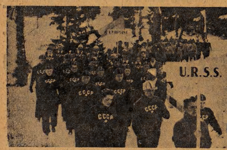
Zawodnicy w drodze na stadion. Na pierwszym planie drużyna radziecka, w głębi rumuńska.