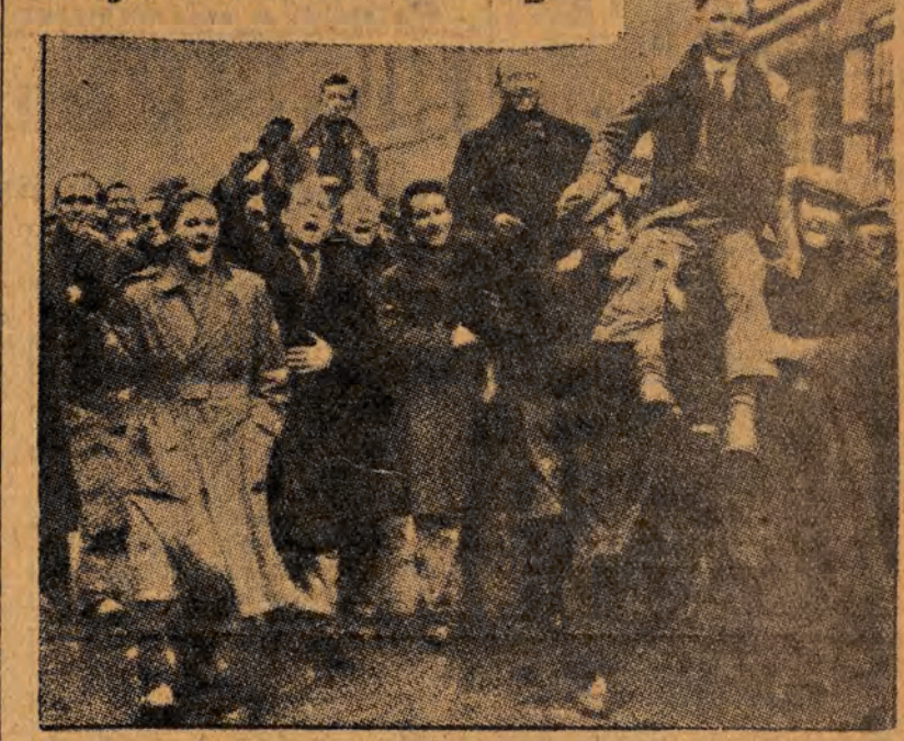
Strajkujący dokerzy londyńscy niosą przez ulice miasta swych towarzyszy, zwolnionych z aresztu na skutek masowych demonstracji i protestów. („Daily Worker“)