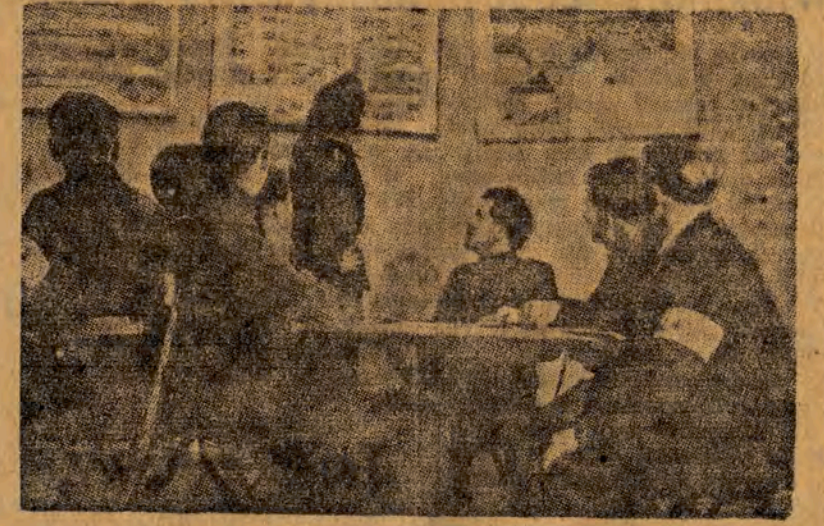
ORMO-acy w czasie wykładu z terenoznawstwa.

czuwa Rezerwa Milicji Obywatelskiej czuwa nad spokojem i mieniem obywateli, pomaga w wykonaniu odpowiedzialnych zadań budowy podstaw socjalizmu.