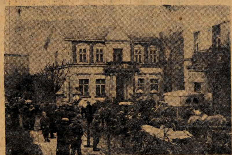
W powiecie łaskim chłopcy masowo odstawiają zboże do punktu skupu. Na zdjęciu: Punkt skupu w Łasku, do którego w dniu 14 b. m. przybyło około 100 wozów, naladowanych zbożem.

Za kilka dni rozpoczynamy druk nowej, ciekawej powieści z okresu walk rewolucyjnych ŁÓDZKIEGO PROLETARIATU