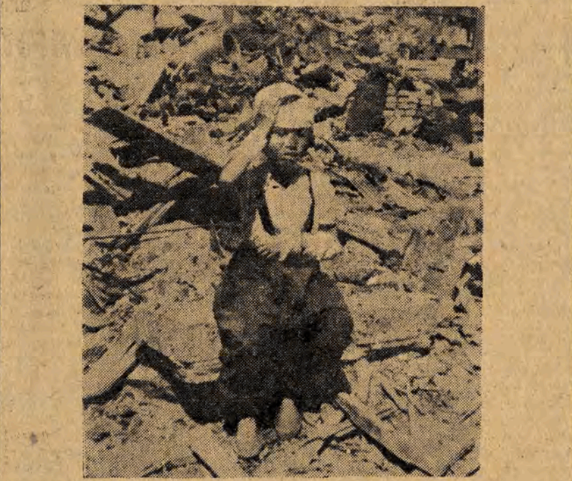
Ciężko ranne dziecko na zgliszczach zombombardowanego miasta koreańskiego — oto jedna z wielu ofiar agresji amerykańskiej.