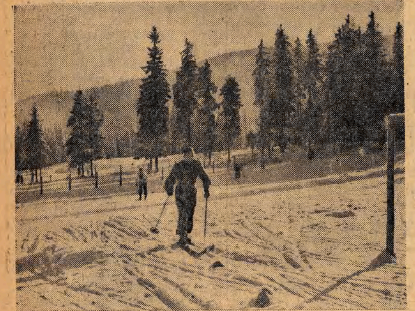
Ostatnio odbyły się w Zakopanem zorganizowane przez Polski Związek Narciarski pierwsze masowe zawody na oznakę „Sprawny do pracy i obrony“. Na zdjęciu: młodzi narciarze na trasie biegu.