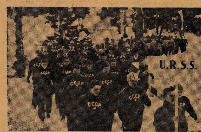
Zawodnicy w drodze na stadion. Na pierwszym planie drużyna radziecka, w głębi rumuńska.