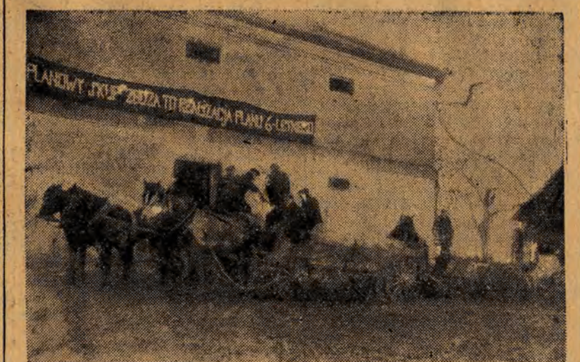
Chłopi z Tychowa, pow. łódzkiego, odstawił manifestacyjnie nadwyżki zbożowe na punkt skupu

WIEDEŃ. Na rozkaz władz brytyjskich w Karyntii utworzono 4 t. zw. szkoły „bandarmerii“, do których przyjmowani są wyłącznie b. żołnierzy armii hitlerowskiej.