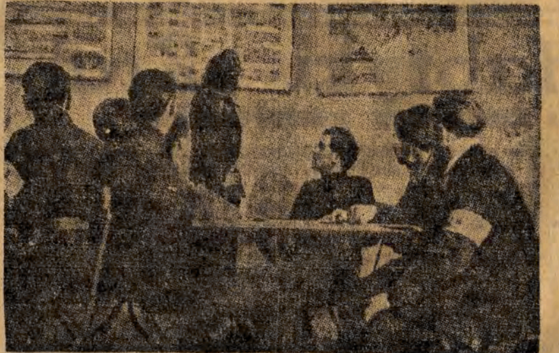
ORMO-wcy w czasie wykładu z terminoznawstwa.