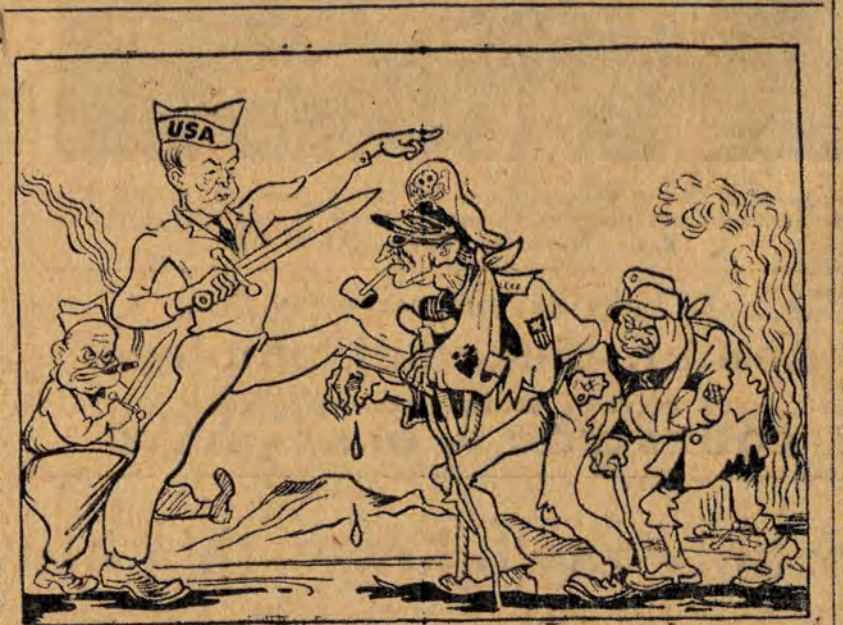
Mac Arthur (do Eisenhowera): I je też tak samo, jak ty, zacząłem...

Liczne rzesze społeczeństwa stolicy przybyły na dworzec — gorącymi okrzykami na cześć światowego obozu pokoju i jego Wodza Józefa Stalina, na cześć przywódcy narodu polskiego Prezydenta RP Bolesława Bieruta aprobowali przedstawione zlecenie.