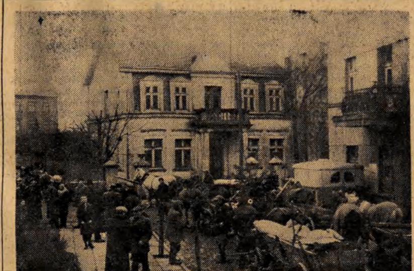
W powiecie łaskim chłopcy masowo odstawiają zboże do punktu skupu. Na zdjęciu: Punkt skupu w Łasku, do którego w dniu 14 b. m. przybyło około 100 wozów, naładowanych zbożem.

Za kilka dni rozpoczynamy druk nowej, ciekawej powieści z okresu walk rewolucyjnych ŁÓDZKIEGO PROLETARIATU