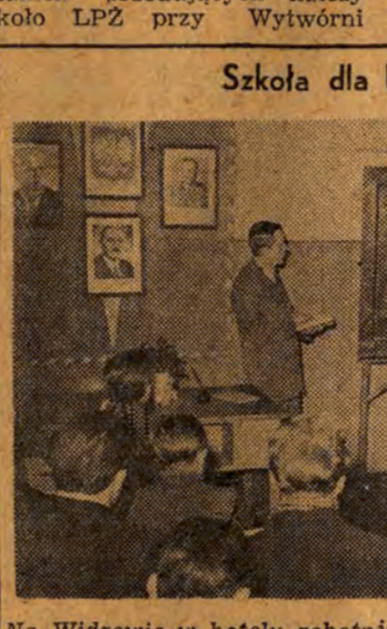
Szkola dla budowlanych Na Widzewie w hotelu robotniczym przy ul. Fabrycznej, otwarta została pierwsza w Łodzi szkoła podstawowa, której słuchacze rekrutują się wyłącznie z robotników budowlanych. NA ZDJĘCIU: pierwsza lekcja języka rosyjskiego.