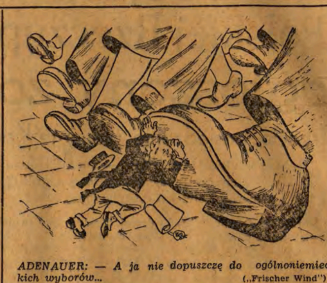
ADENAUER: — A ja nie dopuszczę do ogólnoniemieckich wyborów... (Frischer Wind)

W zakończeniu deklaracji KPD wzywa ludność Niemiec Zachodnich do wzmocnienia narodowego oporu wobec adenauerowskiej polityki kata- strofy wojennej.