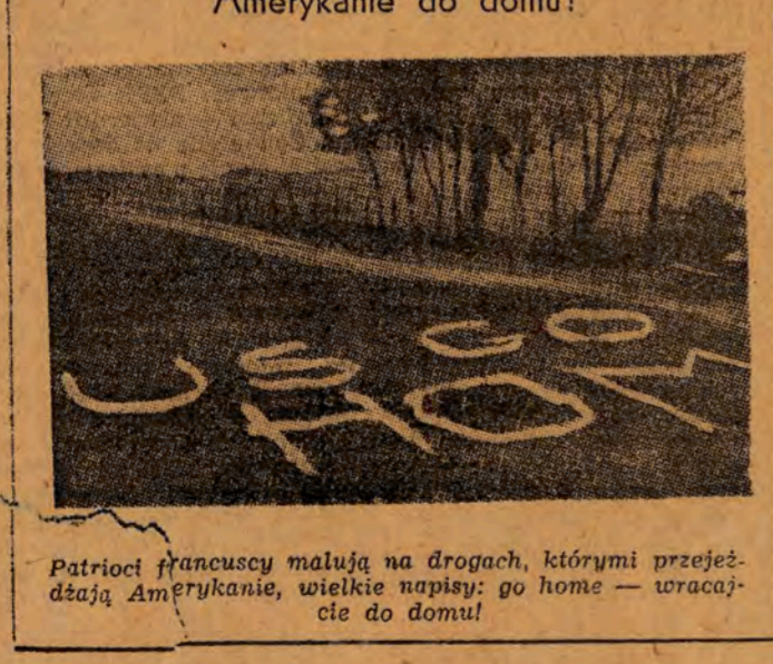
Patrioci francuscy malują na drogach, którymi przejeżdżają Amerykanie, wielkie napisy: go home — wracajcie do domu!