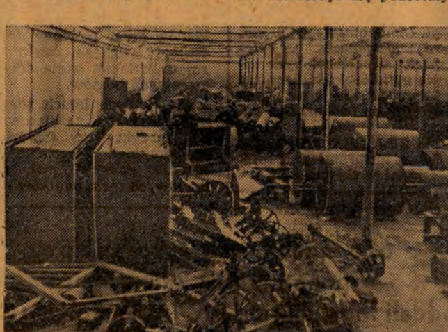
Jedna z wielkich sal ZPW im. Gwardii Ludowej przypomina jakieś pobojuwisko albo składnię złomu.

Zakłady nasze otrzymały w roku 1951 i 1952 maszynę przedziałnicę. Do chwili obecnej nie zostały one zamontowane i leżą w jednej z sal. W tej samej sali znajdują się zgrzeblarki zdolne do produkcji, które na skutek braku konserwacji rdzewieją i niszczeją.