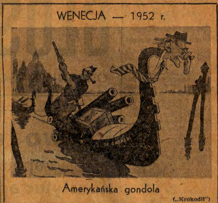
Amerykańska gondola (Krokodil)