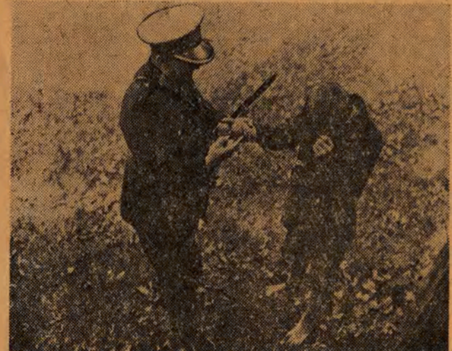
Przedstawiciel porządku w Polsce sanacyjnej ujął „prześciepcę”.

...Nie wyrzucając więc resztek obiadów, lecz przeznaczając je dla złodziejów i dziturów. Nie było perspektyw rozwoju ani awansu społecznego przed młodzieżą robotniczą