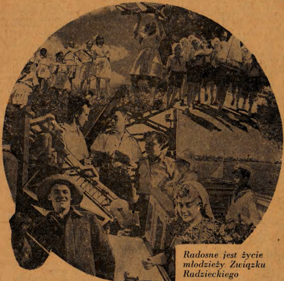
Radosne jest życie młodzieży Związku Radzieckiego

(Artykuł 68 projektu Konstytucji Polskiej Rzeczypospolitej Ludowej)