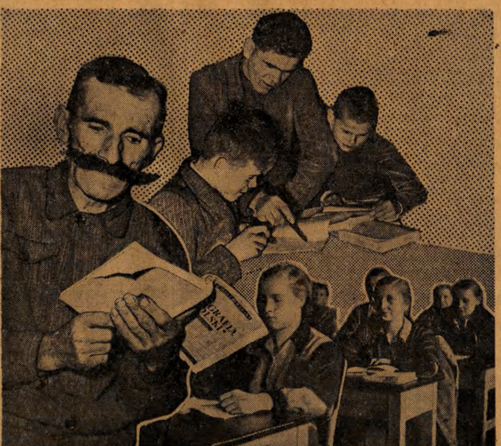
Obywatele Polskiej Rzeczypospolitej Ludowej mają prawo do nauki (Z art. 61 Konstytucji Polskiej Rzeczypospolitej Ludowej).

Szczegółowe wskazówki, dotyczące konkursu oraz sposobu opracowania korespondencji otrzymać można w Klubie Korespondentów we wtorek, środy i czwartki, w godz. 17 — 19.