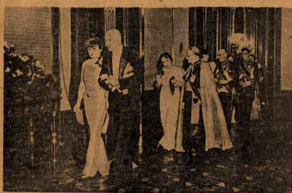
Raut na Zamku w Warszawie.