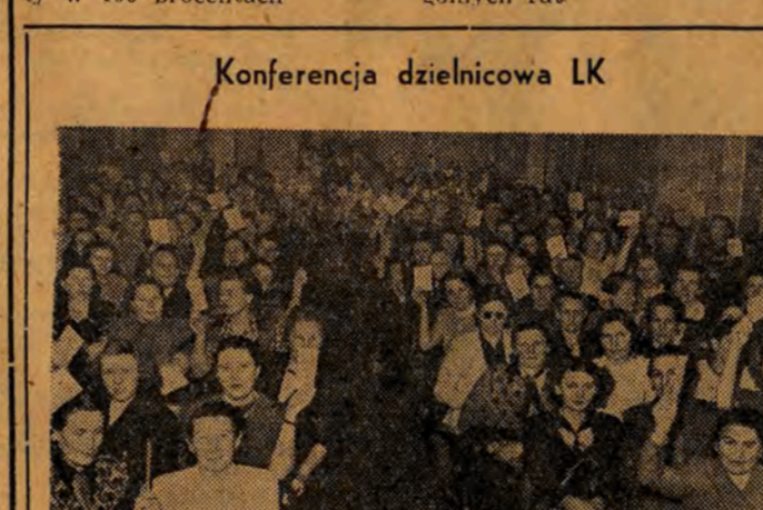
Fragment sali obrad. Członkinie Ligi Kobiet z dzielnicy Śródmieście — Lewa dokonały wyboru nowych władz swej organizacji.