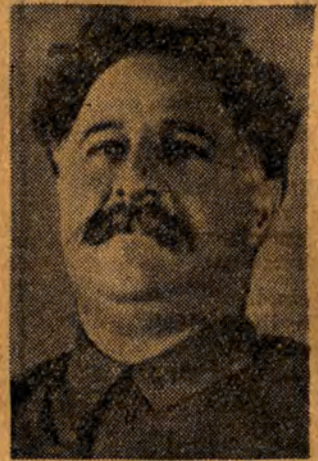
1912, miała olbrzymie znaczenie w historii partii bolszewickiej: przeprowadziła z partii mienszewików i zapoczątkowała istnienie partii bolszewickiej, jako samodzielnej partii nowego typu.