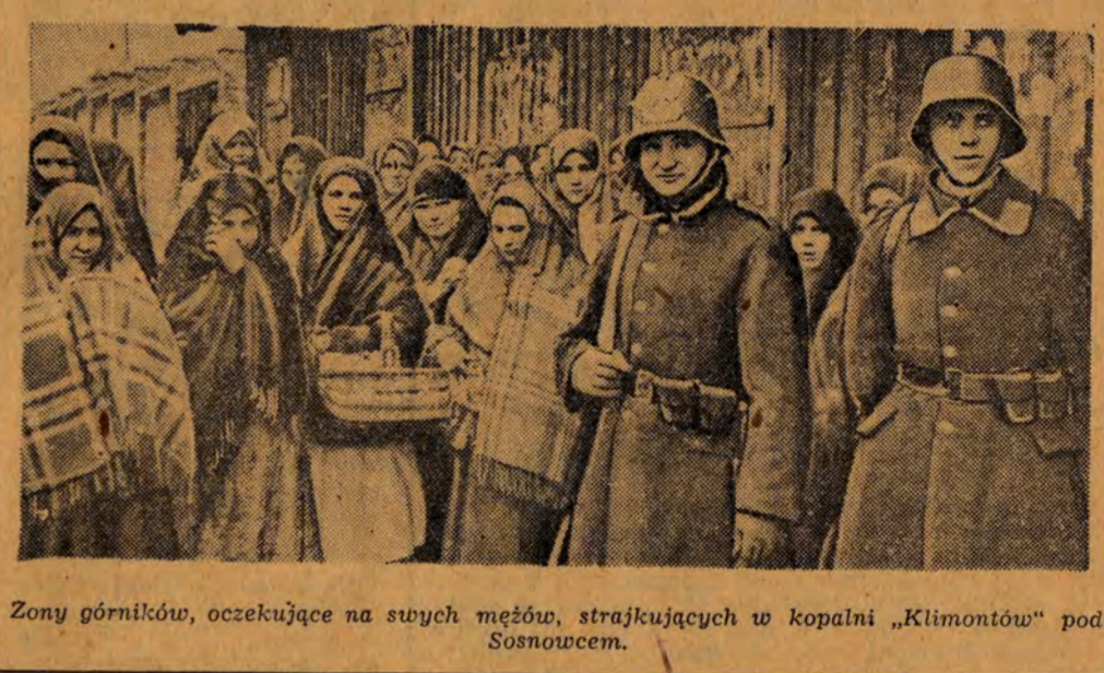
Zony górników, oczekujące na swych mężów, strajkujących w kopalni „Klimontów” pod Sosnowcem.