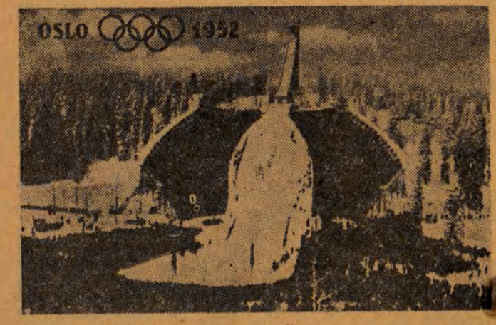
Skocznia w Holmenkollen

rozpoczęło zawody w jeździe figuralnej. Z meczu fiatur obowiazkowych rozegrano w sobote trzy, do których prowadzi mistrz świata, Anziela Altvage — 486,8 pkt. przed Albricht (USA) — 467,2 i du Bieff (Francja) — 475 pkt. Na stadionie w Bislet w obecności 30 tysięcy widzów rozegrano pierwszą konkurencję łyżwiarską w jeździe szybkiej — bieg na 500 m. Zwyciężył Henry (USA) w czasie 43,2 sek. przed Mc Dermotten (USA) 43,8. Trzecie i czwarte miejsce podzielił Rudley (Kanada) i Johansen (Norwegia) w jednakowym czasie 44,0. Mistrz olimpijski Helgen (Norwegia) zajął piąte miejsce. Startowało 42 zawodników z 14 państw. W Norefjell odbył się bieg zjazdowy mężczyzn na trasie długości 2 435 m. Z 85 startujących zawodników zjazd ukończyło tylko 25. Pierwsze miejsce zajął mistrz świata i faworyt tej konkurencji, Wloch Zeno Colo w czasie 2:30,8 przed Schnelderem (Austria) 2:32,0 i Pravda (Austria) 2:32,4. Dalsze miejsca zajęli 4) Rudi (S-wa) 2:33,3, 5) Beck (USA) 2:33,3, 6) Erikson (Norwegia) 2:33,3. Pierwszy z Francuzów — Couttet zajął jedenaste miejsce. W piątkowym meczu hokejowym, który zakończył się późno wieczorem, Kanada pokonała Niemców Zachodnie 15:1 (6:1, 7:0, 2:0). Najwięcej bramek dla zwycięzców zdobyli najlepsi gracze drużyny ka-