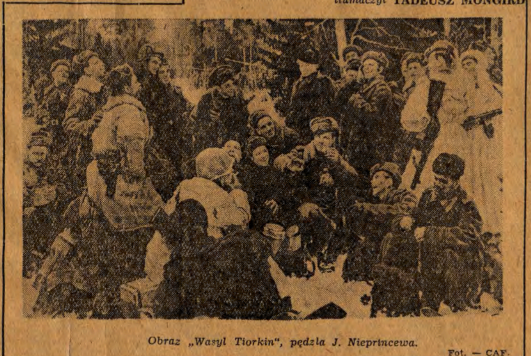
Obraz „Wasył Tiorkin”, pędzla J. Nieprincewa.