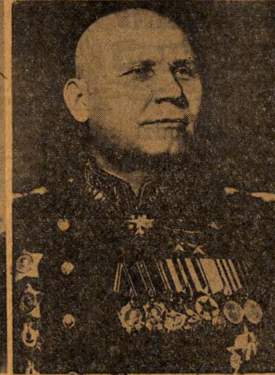
Marszałek Związku Radzieckiego I. S. KONIEW