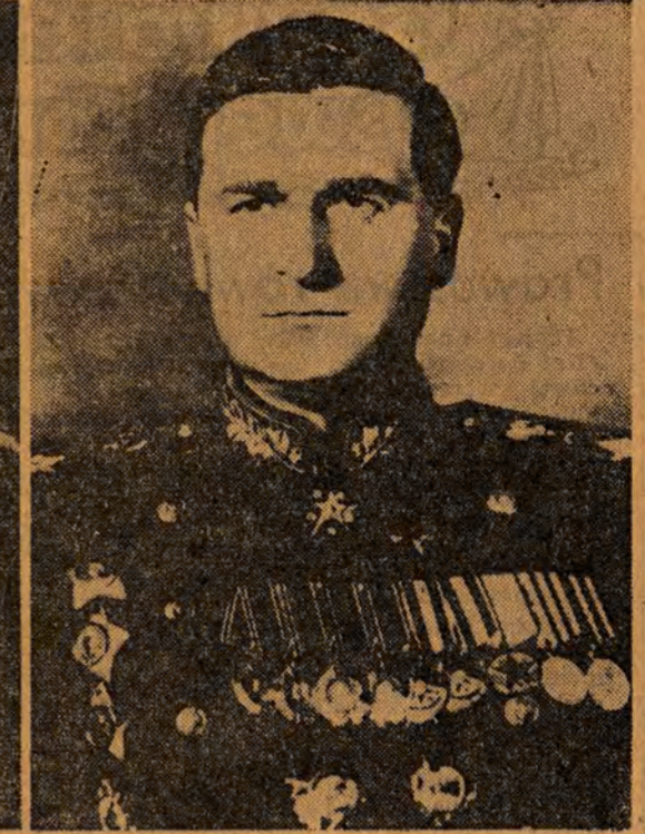
Marszałek Związku Radzieckiego W. D. SOKOŁOWSKI