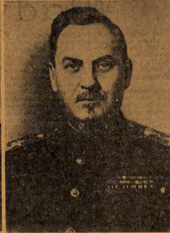
Marszałek Związku Radzieckiego M. A. BULGANIN