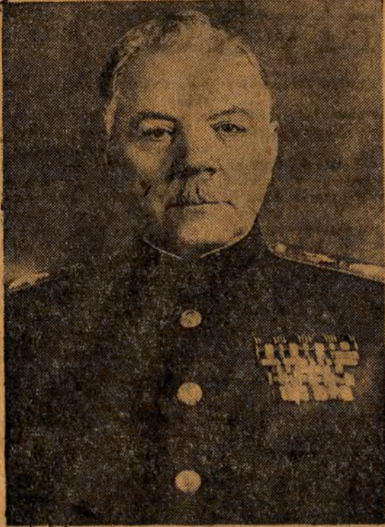
Marszałek Związku Radzieckiego K. J. WOROSZYŁOW