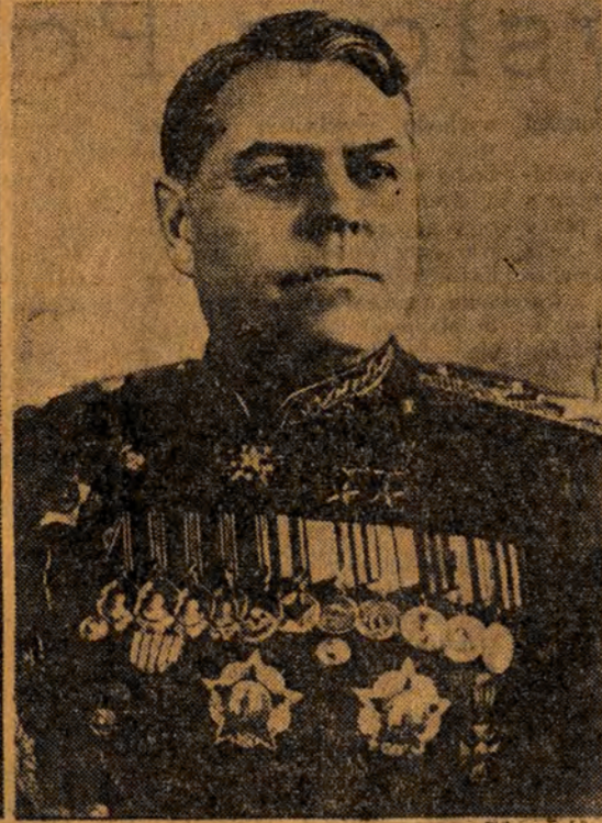
Marszałek Związku Radzieckiego A. W. WASILEWSKI