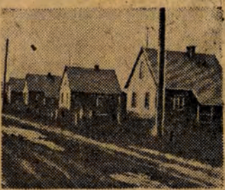
Farmki jednorodzinne spółdzielców z Wilkanowic w pow. rawskim. Takich oto domków spółdzielcy posiadają już 13.

MATEUSZ CIESLA spółdzielnia produkcyjna w Kraszkowicach, pow. wieluński