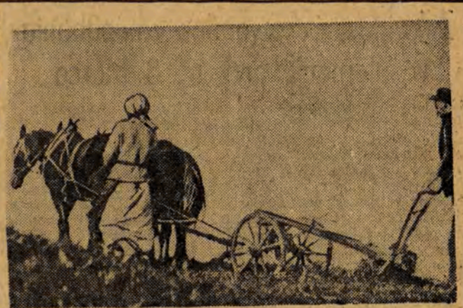
W POLSCE KAPITALISTYCZNEJ: orka sochą w 1937 roku. Takimi i podobnymi narzędziami w Polsce sanacyjnej chłop uprawiał swą ziemię.