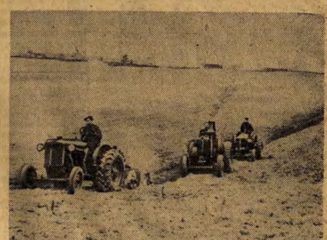
W POLSCE LUDOWEJ: traktory POM w Dębowej Górze orzą ziemię spółdzielni produkcyjnej w Kochanowie w pow. skierniewickim. Socha zniknęła na zawsze.