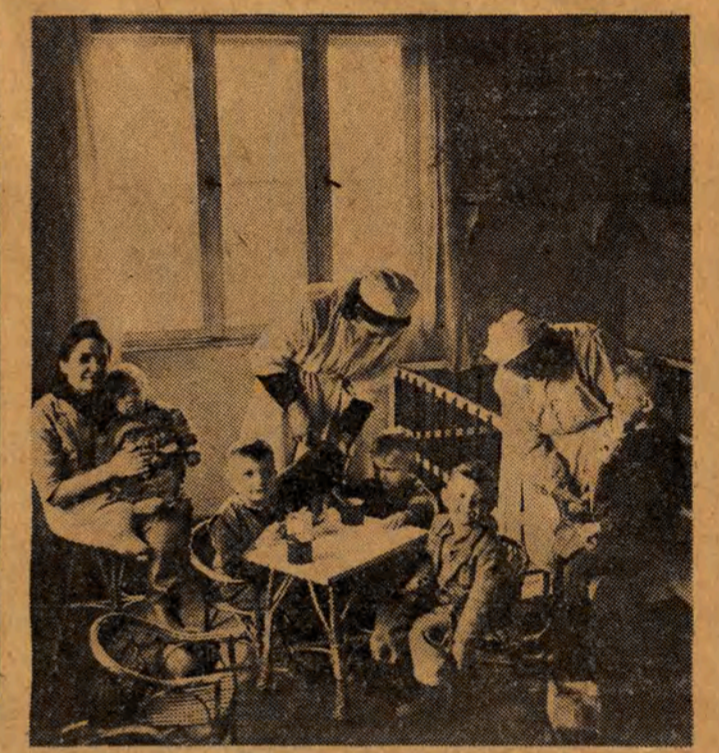
W Izbie Dworcowej Ligi Kobiet na stacji Łódź - Kaliska matki i dzieci mogą odpocząć po trudach podróży.