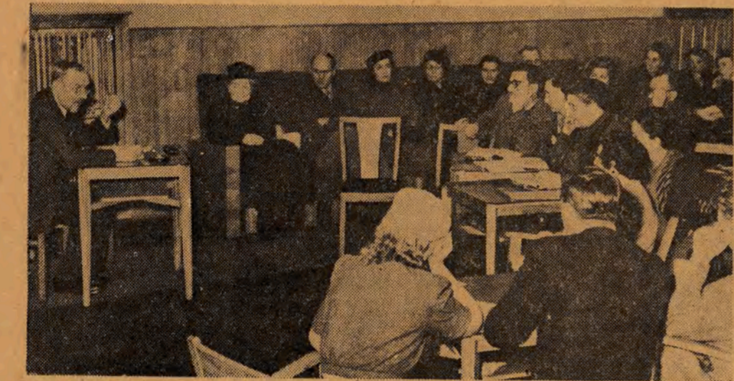
Na lekcji języka rosyjskiego w Klubie Prasy i Książki.

Następujące apteki: Piotrkowska 165, Narutowicza 6, Rzgowska 147, Wękrowskiego 21, Karłowicza 48, Przebyszczyńskiego (Napierkowskiego 41), Al. Kościuszki 48.