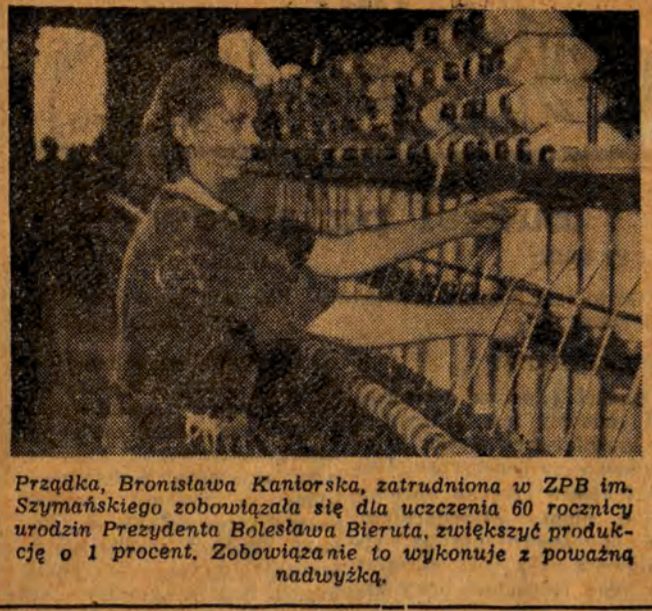
Przedstawienie artystyczne z okazji 60-lecia Bieruta.