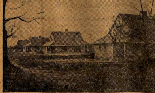
Nowe domki robotników PGR w Kobierzycy.

„Pracowałem przy wykopaniu kanału, przy budowaniu domów mieszkalnych. Do każdego z nich prowadzi od głównej drogi chodnik z betonowych płyt.