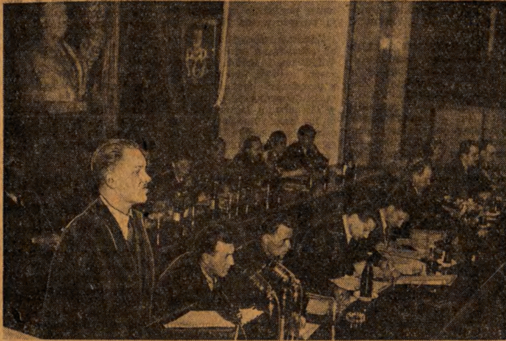
Wicepremier Hilary Chelchowski w czasie wygłaszania referatu.

W zakończeniu swego referatu wicepremier Chelchowski przedstawił wielki rozmach, jaki przybrał wśród żółg PGR czyn produkcyjny dla uczczenia 60 rocznicy urodzin Prezydenta i święta 1 Maja.