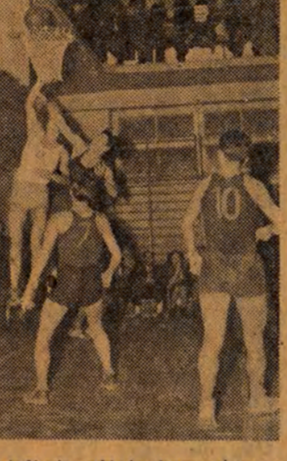
wąpliwie różne kompletowane. I to jest najbardziej ryzykowne, gdyż na podstawie sukcesu, końcowego rezultatu walki próbuje się ocenić wartość tego lub innego zespołu.