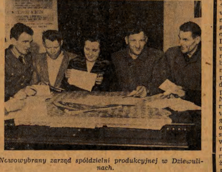
Nowowybrany zarząd spółdzielni produkcyjnej w Dziewulinach.