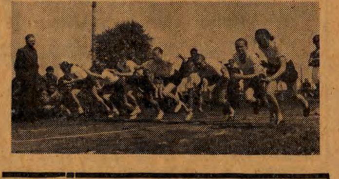
dziane są pamiątkowe dyplomy. Zgłoszenia od dziś można kierować do sekcji lekkoatletycznej przy LKKF (ul. Piotrkowska 67).

Świeżo są jeszcze w pamięci meldunki z przebiegu międzynarodowych spotkań, w których niejednokrotnie sprawozdawcy sportowi donosili, że sztafeta polska przegrała wskutek złej zmiany pałek. Od lat nie możemy jakoś opanovać tej sztuki. Często więc nadrobioną przewagą dzięki szybkości naszych biegaczy tracimy przy zmianie pałeczek. Rzecz zrozumiała, że sytuacja wymagała, aby na tę konkurencję zwrócić szczególną uwagę. Należało więc wśród naszej młodzieży jak najbardziej spopularyzować bieg sztafetowy, gdzie o zwycięstwie decyduje nie wynik jednego indywidualisty, a praca całego zespołu. Szczególnie chodziło o sprinty. Biorąc pod uwagę m.in. powyższy stan rzeczy redakcja „Głosu Robotniczego” organizuje w kwietniu bieg sztafetowy po ulicy Piotrkowskiej. W imprezie tej będą mogli wziąć udział mężczyźni i kobiety. Czternastoboje sztafety składać się będą z 7 meczów i 7 kobiec. Dopiero wysiłek całej grupy zdecydowanie o zwycięstwie. Mężczyźni będą mieli do przebiegnięcia 200 m, kobiety 100 m. Jak widzimy, start w biegu sztafetowym nie będzie łatwym. Każdy, kto posiada najmniejszy nawet talent do sprintu, bez trudu przebiegnie swój odcinek. Zwycięski zespół zdobędzie nagrodę przechodnią, ufundowaną przez naszą redakcję, a zawodniczki i zawodnicy tej sztafety otrzymają pamiątkowe dyplomy i książki. Również dla sztafet, które zajmą dalsze miejsca przewidziane są pamiątkowe dyplomy. Zgłoszenia od dziś można kierować do sekcji lekkoatletycznej przy LKKF (ul. Piotrkowska 67).