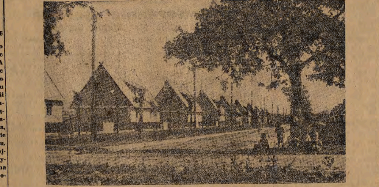
Fragment nowego osiedla mieszkaniowego dla kolejarzy w Rumii Janowie pod Gdynią. Osiedle składa się obecnie z 34 donków bliźniaczych, z których każdy posiada dwa mieszkania, zabudowania gospodarcze i duży ogródek.

misariatu W. Polsk. Akcja ta miała być prowadzona możliwie jak najdużej, dawała ona bowiem nie tylko dodatnie rezultaty, ale stanowiła ponadto moralny argument wobec biernej ludności Królestwa Polskiego.