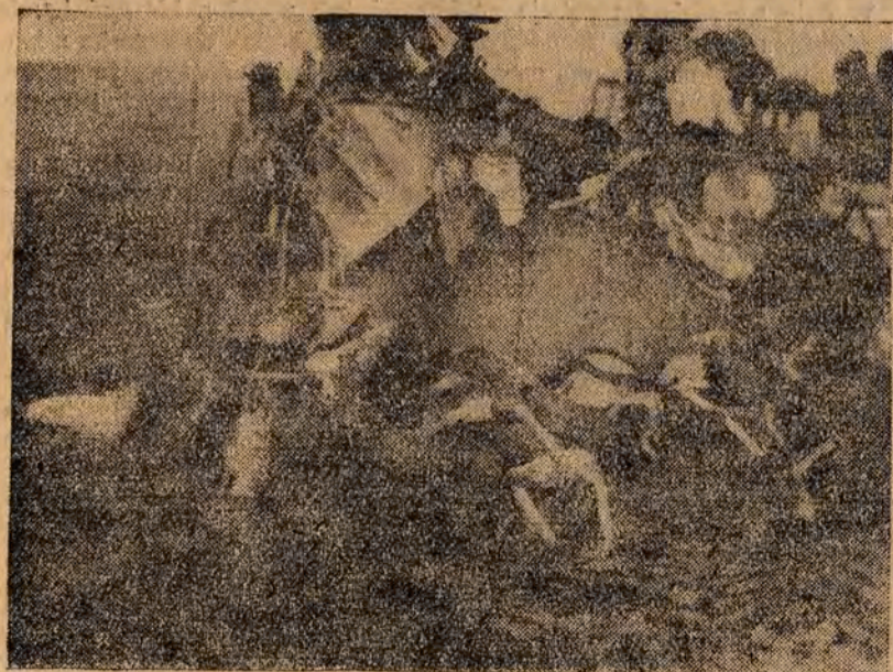
Moment wydobywania rozbitego samolotu, który uległ katastrofie w zatoce Rio de Janeiro.