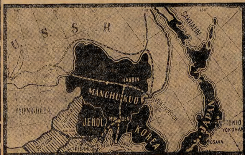
Mapka orientacyjna Sachalinu, sta nowiącego kość niezgody między Sowieciami a Japonią.