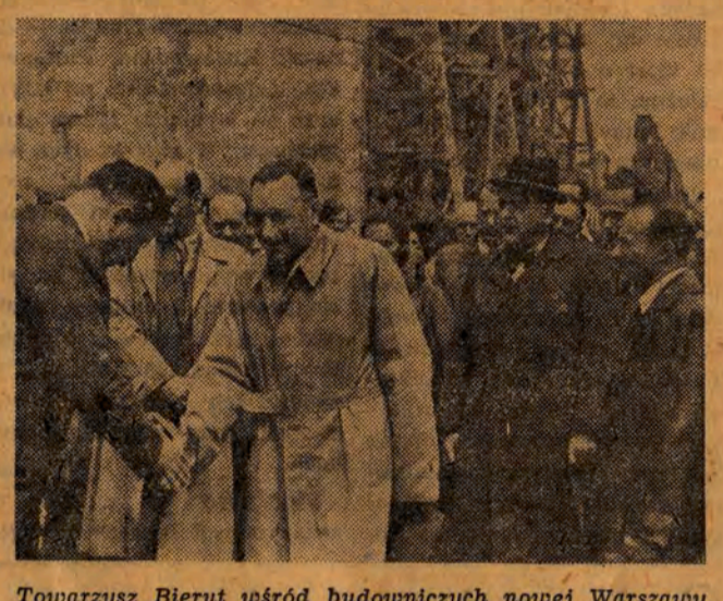
Towarzysz Bierut wśród budowniczych nowej Warszawy.

Muszę Ci powiedzieć, Towarzyszu Prezydencie, że w naszym zespole pracuje sama młodzież. Nie ma wśród nas starych „wygi”, wytrawnych fachowców — ot, młodzież, która niedawno dopiero pracuje na krosnach. Ale też nie długa praktyka dzisiaj decyduje. Mają młodzi zapal i chęć do pracy, szkoła się — toteż wyniki osiągamy coraz lepsze. Z każdym miesiącem nasza wydajność wzrasta. A trzeba jeszcze powiedzieć, że tkacze w moim zespole pracują na 6 i na 8 krosnach — a więc wielowarsztatowcy. Ja sam także jestem młody i nie mam długiej praktyki tkackiej. Niedługo pracowałem na krosnach, a już kierownictwo zakładu posłało mnie na kurs pod mistrzów. Potem znów — na roczny kurs majstrów. Uczyłem się, a zarobek dostawałem taki, jakbym pracował zawodowo. Gdzie kto słyszał o takich wygodach w Polsce sanacyjnej! Dzisiaj jestem majstrem, ale wiem, że mam przed sobą dalsze możliwości — marzę o Technikum Włókienniczym, no i nic nie stoi na przeszkodzie tym marzeniom.