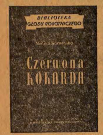
dokumentach i ułożone w kolejności chronologicznej...