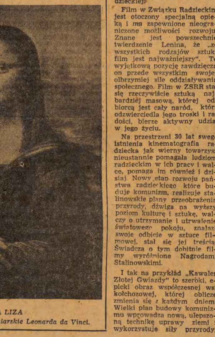
MONA LIZA - największe dzieło malarskie Leonarda da Vinci