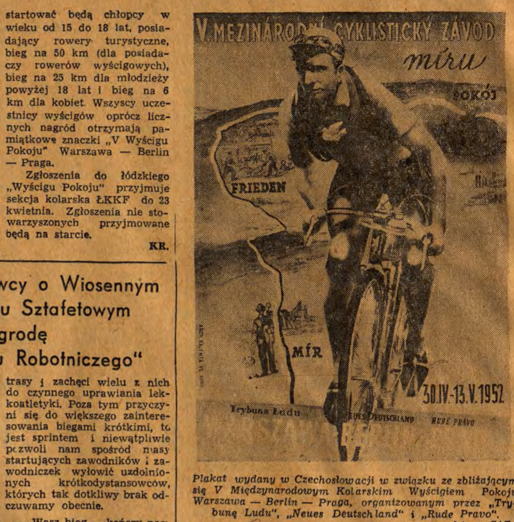
Plakat wydany w Czechosłowacji w związku z zbliżającym się V Międzynarodowym Kolarskim Wyścigiem Pokoju...