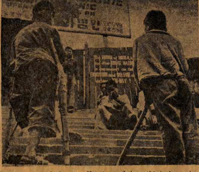
Faszyści amerykańscy w Korei mordują setki tysięcy niewinnych dzieci. NA ZDJĘCIU: ofiary bestialstwa Amerykanów.

Wszystkie nasze dzieci są takie — mówi mi miniaturowa kobietka, także podobna do kwiatu i motyla. A mnie chwytą za gardło, dławki takie wrzucenie, że nie mogę nie odpowiedzieć.