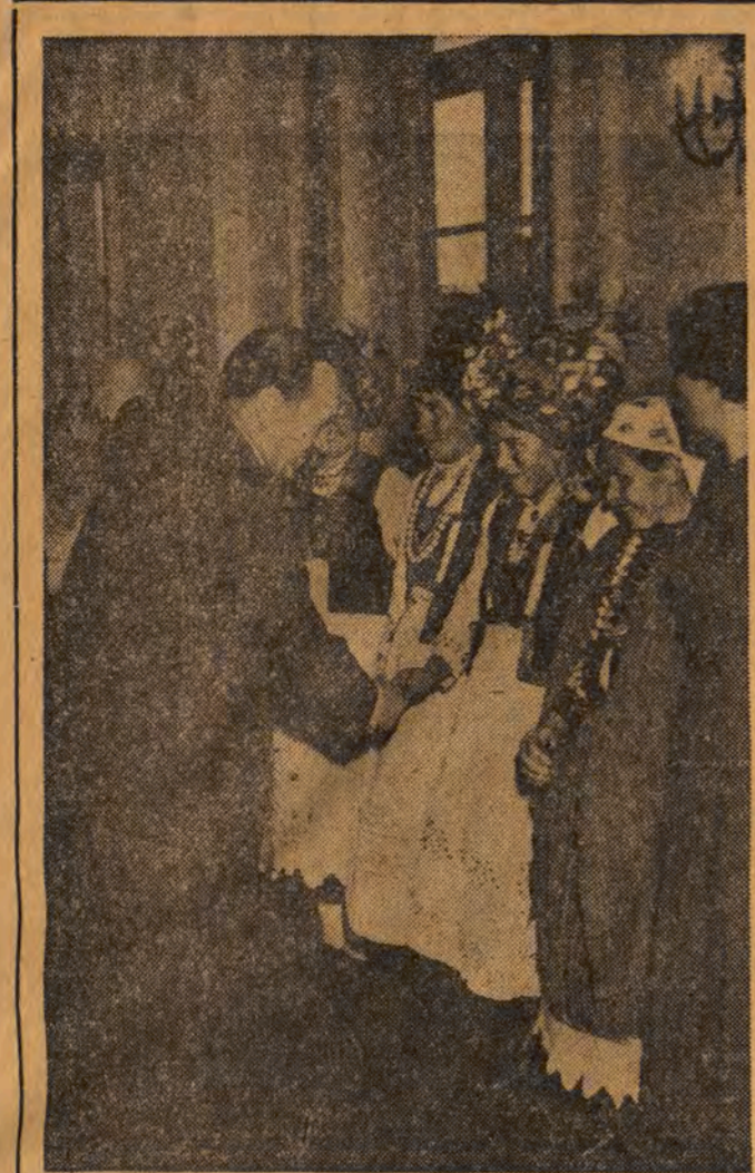
27 października 1950 roku Prezydent RP przyjął w sali Rady Państwa delegację świetlicowych zespołów amatorskich Ligii Kobiet, uczestniczących w I Krajowym Festiwalu.