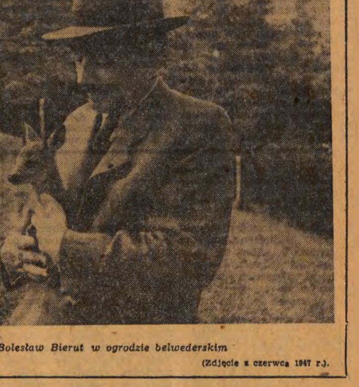
Prezydent Bolesław Bierut w ogrodzie belwederskim