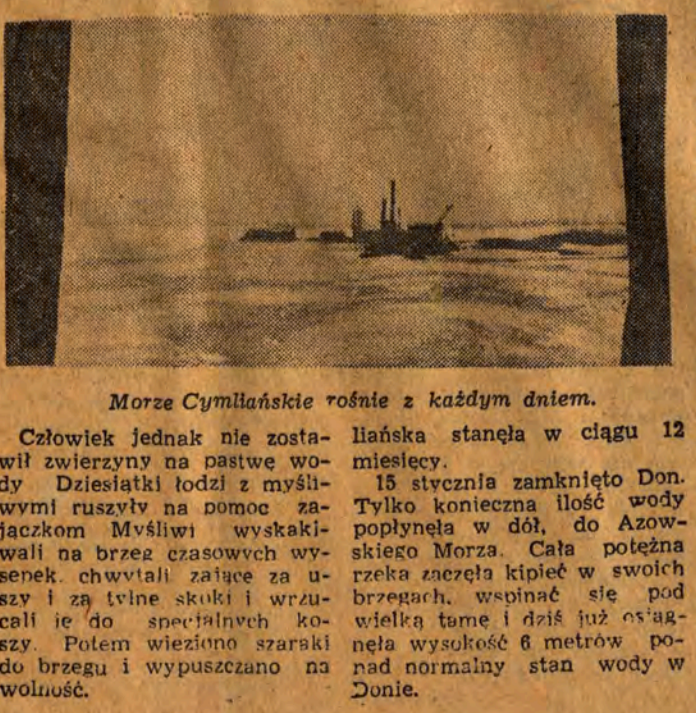
Morze Cymilańskie rośnie z każdym dniem.