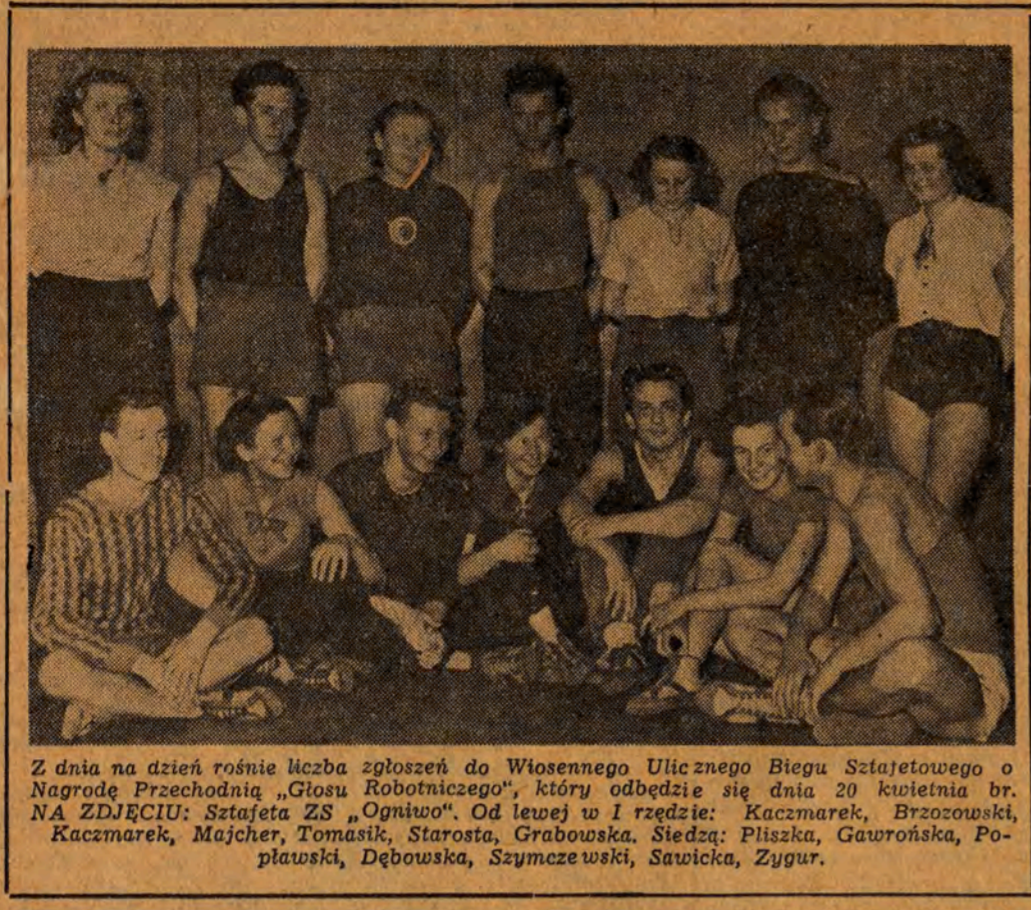
Z dnia na dzień rośnie liczba zgłoszeń do Wiosennego Ulicznego Biegu Sztafetowego o Nagrodę Przechodnią „Głosu Robotniczego”...