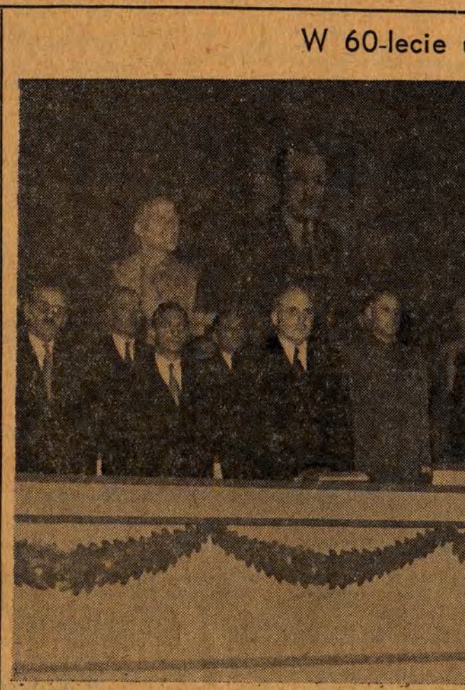
Z okazji 60 rocznicy urodzin Prezydenta RP, Bolesława Bieruta, odbyła się w sali Państwowego Teatru Polskiego w Warszawie uroczysta akademii.