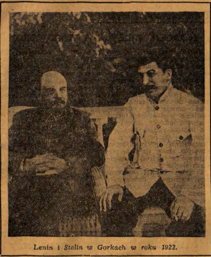
Lenin i Stalin w Gorkach w roku 1922.

22 kwietnia masy pracujące całego świata obchodzą rocznicę urodzin Włodzimierza Lenina, twórcy i przywódcy partii komunistycznej i państwa radzieckiego, wielkiego wodza, nauczyciela i przyjaciela całej postępowej ludzkości. Zycie Lenina było życiem nieugiętego rewolucjonisty, który poświęcił wszystkie siły sprawie walki o szczęście ludzi pracy. Lenin i Stalin stali u kolebki Wielkiej Październikowej Rewolucji Socjalistycznej, która zapoczątkowała istnienie państwa nowego typu — radzieckiego państwa socjalistycznego. Na czele państwa socjalistycznego stanął Lenin. Historia nie znała dotąd męża stanu, który łączyłby mądrość polityczną, dalekowzroczność, nieugiętą wolę i wielką odwagę z tak głęboką znajomością narodu, jego życia, jego naj-