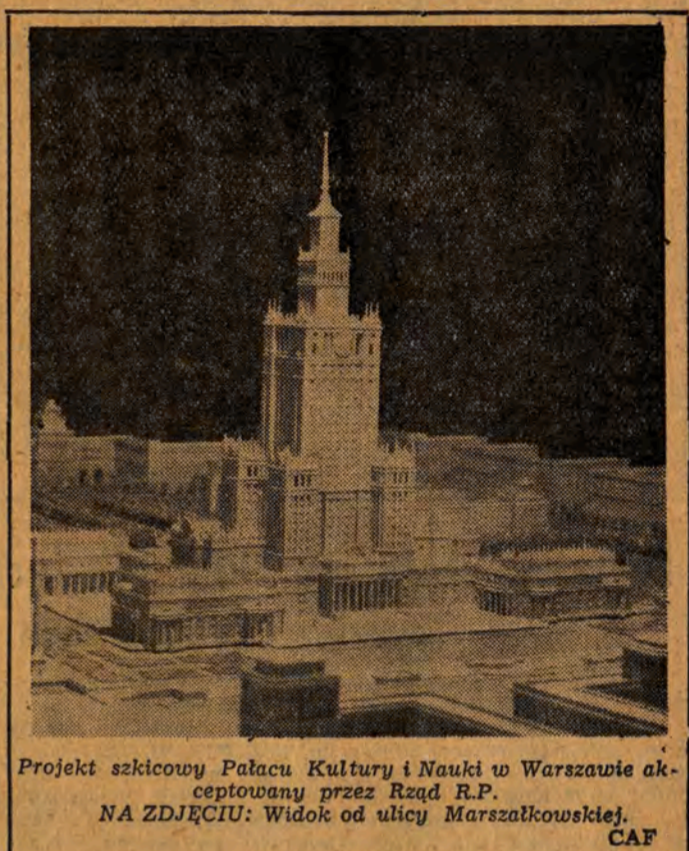
Projekt szkieletowy Pałacu Kultury i Nauki w Warszawie akceptowany przez Radę R.P. NA ZDJĘCIU: Widok od ulicy Marszałkowskiej.