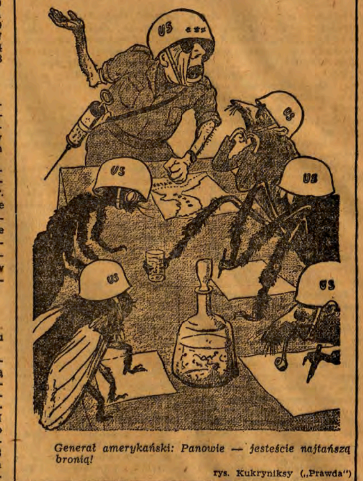
Generał amerykański: Panowie — jesteście najtańszą bronią!