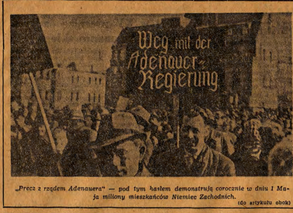
„Przec z rządem Adenauera” — pod tym hasłem demonstrują corocznie w dniu 1 Maja miliony mieszkańców Niemiec Zachodnich. (do artykułu obok)