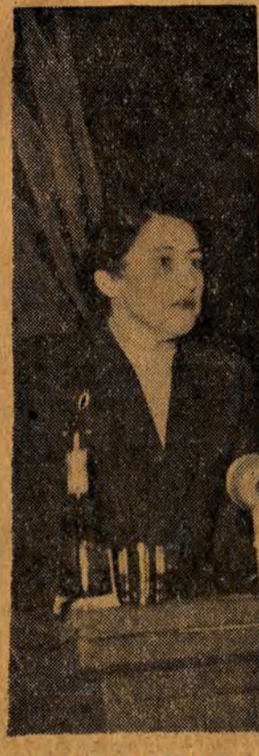
26.IV. br. w Hali Mirowskiej w Warszawie odbył się wielki wiec w obronie dziecka, w którym szereg uczestników wygłosił wykład o wykonaniu zadań trzeciego roku Planu 6-letniego.

OLSZTYN (PAP). — W Imprezach organizowanych w dniu 1 Maja w Olsztynie weźmie udział ponad 300 zespołów artystycznych.