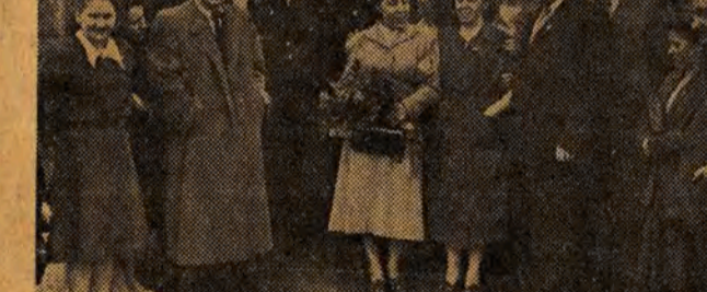
Członkowie delegacji radzieckiej — w otoczeniu młodzieży i robotników Zakładu C ZPB im. Stalina.

— obryzani portret wodza mas pracujących całego świata. Pod portretem — wprost od warsztatów stanęły przedownicze pracy. Tow. Wład-