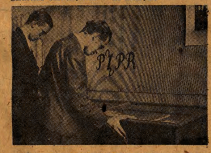
Na wystawie Książki w Bibliotece Uniwersyteckiej.

WYSTAWA PT.: „RUCH ROBOTNICZY W POLSCE” Biblioteka Uniwersytecka w