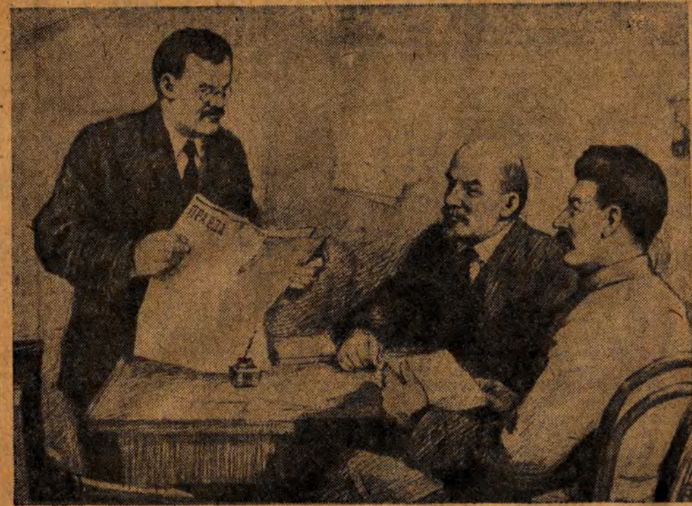
Lenin, Stalin i Molotow w redakcji „Prawdy” w 1917 roku.

40 lat temu, 5 maja 1912 roku ukazał się pierwszy numer „Prawdy”