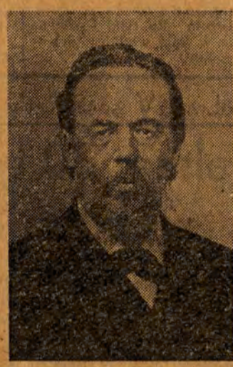
ALEKSANDER POPOW wynalazca radia

W maju 1895 roku wybitny fizyk rosyjski, A. S. Popow, przedstawił na posiedzeniu Fizyko - Matematycznego Towarzystwa Naukowego w Petersburgu skonstruowane przez siebie urządzenie nadawczo-odbiorcze, które pozwalało wykorzystywać fale do przesyłania sygnałów. Aparat ten, prototyp naszego radia, zapoczątkował rozwój radiotelegrafii na całym świecie. 7 maja, w rocznicę wielkiego wynalazku Popowa, Związek Radziecki i kraje demokracji ludowej, czcąc pamięć wybitnego uczonego, obchodzą uroczyste „Dzień Radia”.