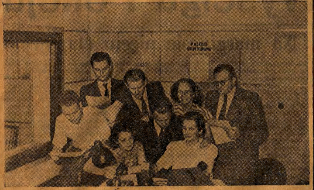
Wykonawcy audycji „Z mikrofonem przez miasto i wieś”. (do artykułu poniżej)