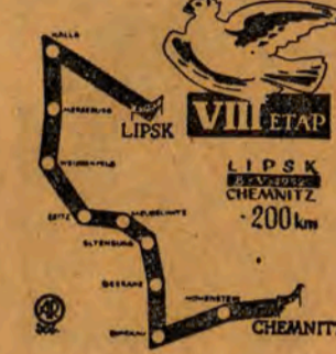
Wyciąg Pokoju VII etap