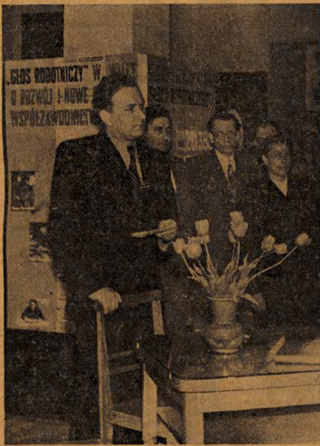
Lnia 7 maja, w ramach obchodu Dni Oświaty, Książki i Prasy, odbyło się otwarcie wystawy pn. „Głos Robotniczy” w walce o plan”...

IMPREZY ARTYSTYCZNE I FILMY NA WOLNYM POWIETRZU