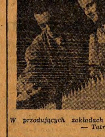
W przodujących zakładach włókienniczych Czechosłowacji — Tatra — Soit.

Przedstawicielstwo w Warszawie. Władze w Warszawie, w tym czasie, walczyły o utrzymanie w kraju socjalizmu, walczyły o pokój, o wykonanie zadań czwartego roku planu pięcioletniego. Majowe dni 1952 roku dla narodu czechosłowackiego dni walki o nowe zwycięstwa w budowie podstaw ustroju socjalistycznego.