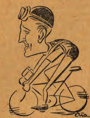
Czechosłowak Vesely w karykaturze Atlaszowskiego.

Altenburga, wszędzie entuzjastycznie witani przez zgromadzoną wzdłuż trasy publiczność.