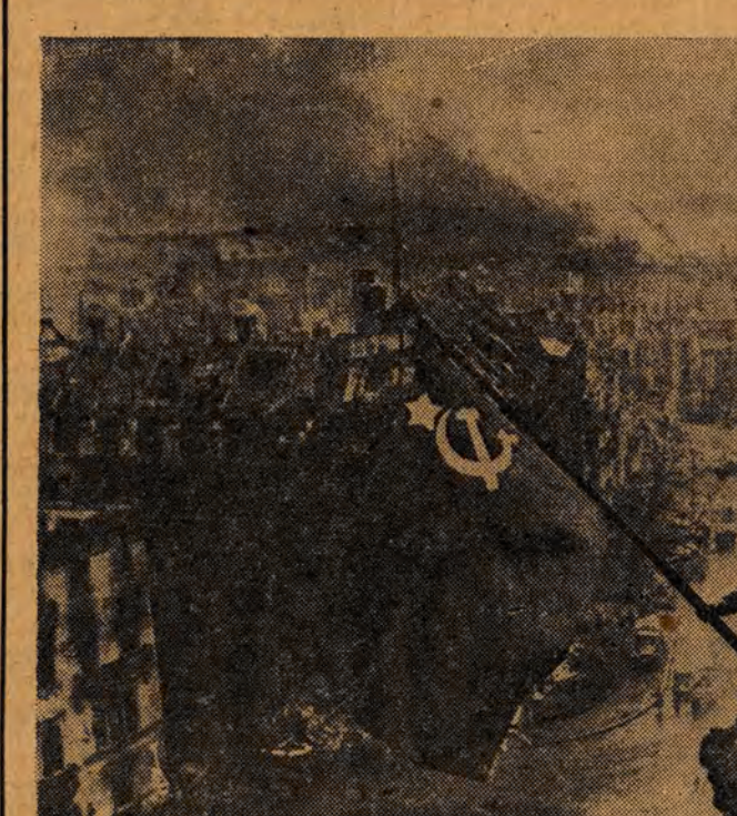
Sztandar Radziecki — Sztandar Zwycięstwa — powiewa nad Reichstagiem.