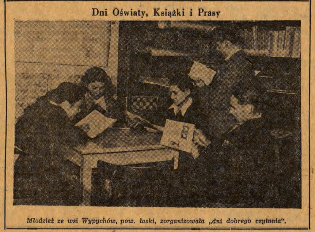
Młodzież ze wsi Wypychów, pow. Łaski, zorganizowała „dni dobrego czytania”.

Każda radiostacja ma swój sygnał. BBC oznajmia swoje audycje bicie w bębna. Nie znam sygnałów radiostacji Mutual Broadcasting System czy też American Broadcasting, sądzę jednak, że chociaż „Głosu Ameryki” mógłby podsunąć dyrektorom tych amerykańskich koncernów radiowych wiele doskonałych pomysłów. Ciekawka goryla poprzedza powinna słuchowska o zmieszczeniu Luwru, za bi chęć - transmisję z cyrku Madama; podręcznik zoologii mógłby dostarczyć wiele innych pomysłów.