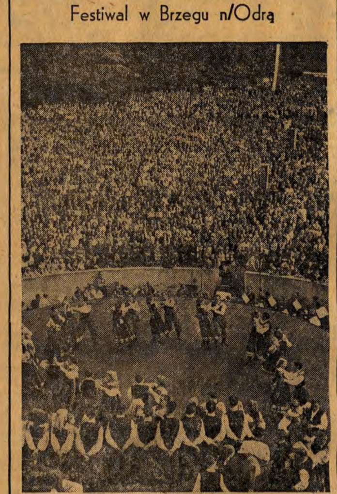
Festiwal w Brzegu n/Odra

MOSKWA (PAP). — Prasa radziecka opublikowała list budowniczych Kanałów Południowo-Ukraińskiego i Północno-Krymskiego do Józefa Stalina.