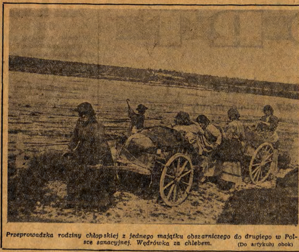
Przeprawa rodziny chłopskiej z jednego majątku obszarniczego do drugiego w Polsce sanacyjnej. Wędrowka za chlebem.