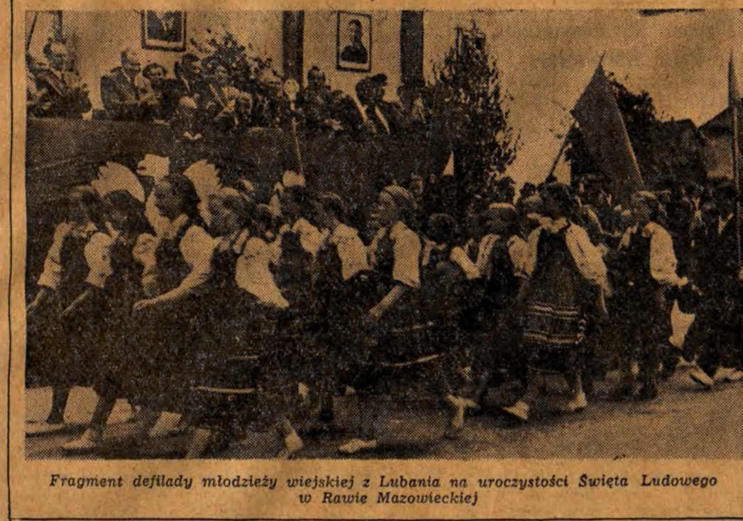
Fragment defilady młodzieży wiejskiej z Lubania na uroczystości Święta Ludowego w Rawie Mazowieckiej

Te wysokie odznaczenia państwowe wręczone zostały uroczysto w czasie obchodów Święta Ludowego w dniu 1 czerwca br.