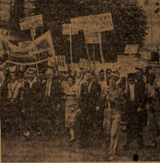
Cała Francja przyjęła amerykańskiego gauleitera Europy, generała Ridgwaya, falą demonstracji i strajków. NA ZDJĘCIU: manifestacja w Vitry. Napisy głosem „Ridgway — wygnaj się. Pinały również”.

Młodzież Szkoły Ogólnokształcącej ZPD w Piotrkowie podjęła na masowe następującą rezolucję: „Dolęzamy swój głos do fal protestów, która ogarnęła całą Francję, dołączamy swój głos do protestu naszej klasy robotniczej i jej przewodniczącej — Polskiej Zjednoczonej Partii Robotniczej. My, młodzież polska, młodzież wolnego kraju, żyjąca szczęśliwie, ucząc się spokojnie, odczuwamy głęboko krzywdę młodzieży i dzieci francuskich oraz