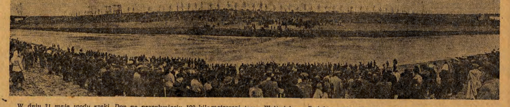
W dniu 31 maja wody rzeki Don po przepłynięciu 100-kilometrowej trasy Wołżańsko - Dońskiego Kanału żeglownego połączyły się z Wołgą.