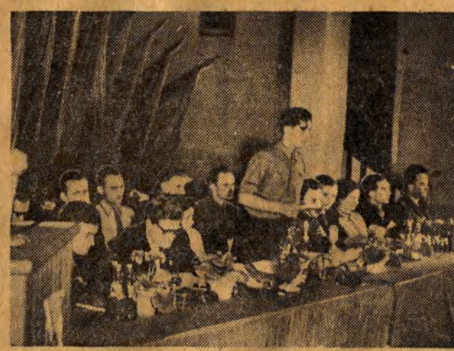
W sobotę i niedzielę obradowała w Łodzi I Wojewódzka Konferencja ZMP. NA ZDJĘCIU: prezydium Konferencji.

Z ZPDZ. im. Emili Plater nieprzerwanie napływają nowe meldunki o podejmowaniu zobowiązań. Dziewięć potok koszulowy, składający się z absolwentek SPP — jak donosi tow. Baranowski — podnieśli swą produkcję o 5 proc., dając dodatkowo 450 sztuk koszu. Szóstą taśmą, wyrabiającą koszule sportowe i zatrudniająca za tempową, podwyższyła swą wydajność o 7 proc., wykonując ponad plan 504 koszu.