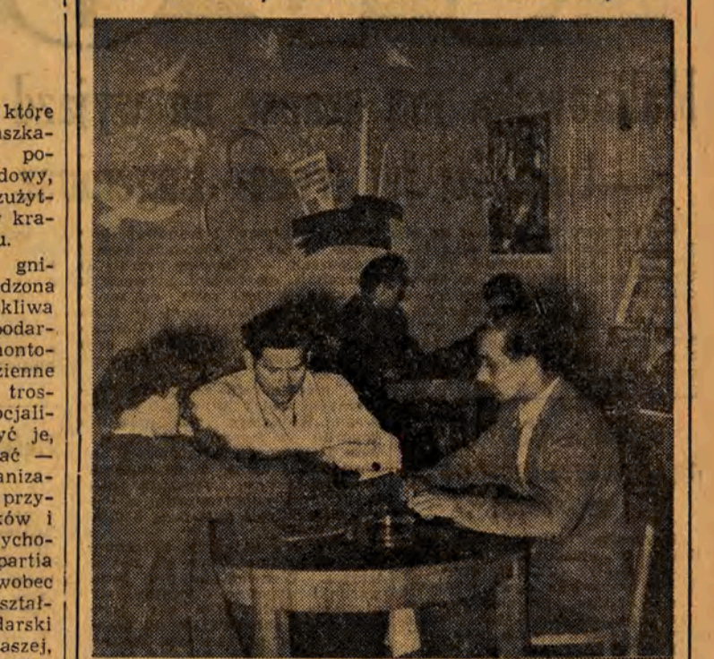
Pracownicy Zakładów im. Strzelczyka w Łodzi wolny po pracy czas spędzają na milej i pożytecznej rozrywce.