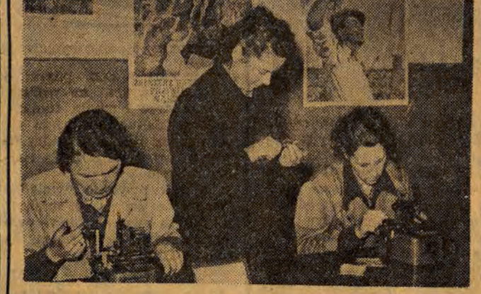
Fabryka Igiel Dzwierskich w Łodzi jest jednym z pierwszych zakładów nowej branży wysoko precyzyjnego przemysłu metalowego...