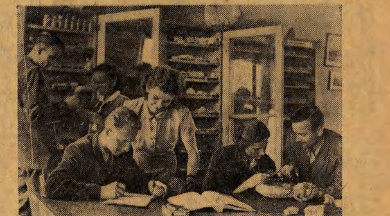
Studenty Wyższej Szkoły Pedagogicznej przygotowują się do egzaminów z geografii.