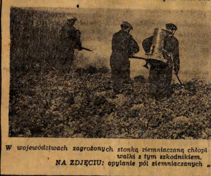
W województwach zagrożonych stonką ziemniaczaną chłopcy mobilizują wszelkie środki do walki z tym szkodnikiem. NA ZDJĘCIU: opylanie pól ziemniaczanych „Azotorem”

Obecnie ważnym zadaniem całego kierownictwa technicznego naszego zakładu jest rozwinąć i spopularyzować ruch racjonalizatorski w przedziałni cienkopiędnej.