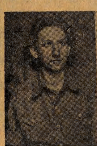
mamy już pleniędzy na opłacenie szkoły. Było to w roku 1938.

choć w ten sposób odwiedzić się nowej ojczyźnie za to, że pozwoliła mi się uczyć. Słowa dotrzymała, jestem zawsze jedną z najlepszych uczennic. Naukę przyswajalam sobie łatwo, toteż wiele godzin poświęcałam na docuczenie słabszych koleżanek i kolegów.