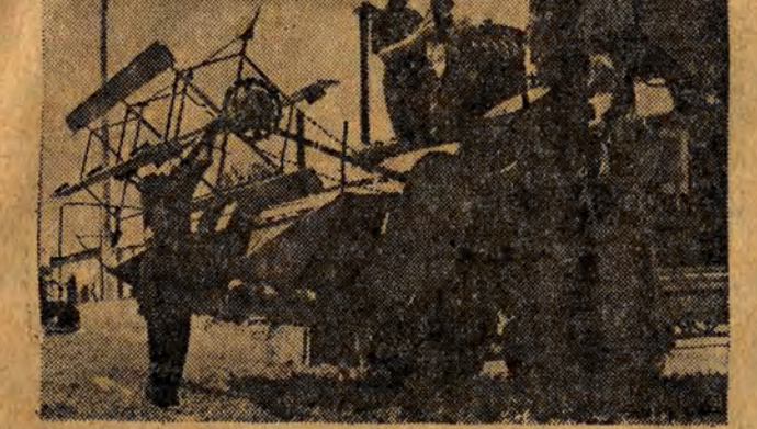
Warsztaty zespołu PGR Kobylniki, w powiecie inowrocławskim, przygotowują maszyny i narzędzia rolnicze do akcji żniwnej.