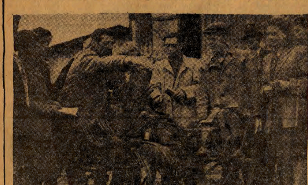
W całym kraju wycieczki chłopów zwiedzają spółdzielnie produkcyjne, zapoznając się z nowoczesnymi metodami gospodarki zespołowej, z życiem i pracą chłopów - spółdzielców.