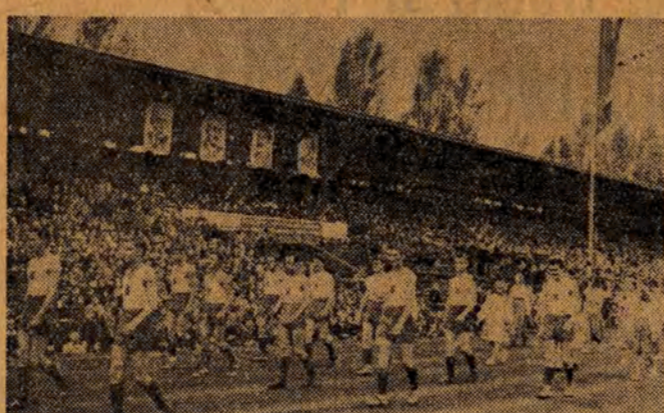
Wobecności przedstawicieli GKKF towarzysza Faruga dała szereg pokazów gimnastycznych, tanecznych i wizerunku ciekawych mecz w piłce ręcznej...