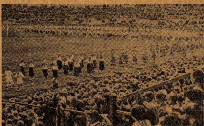
Wobecności przedstawicieli GKKF towarzysza Faruga dała szereg pokazów gimnastycznych, tanecznych i wizerunku ciekawych mecz w piłce ręcznej...